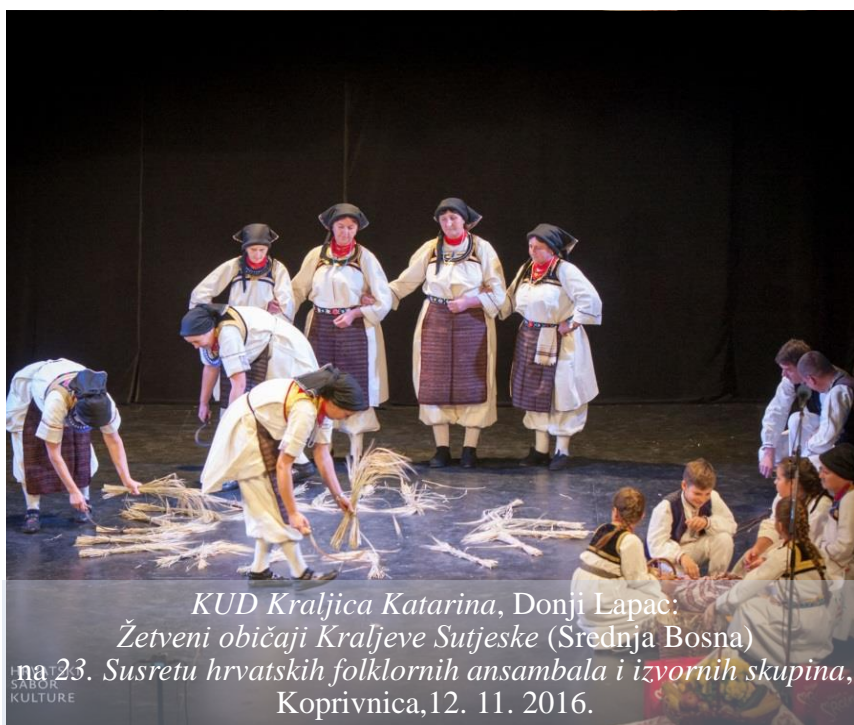
KUD Kraljica Katarina, Donji Lapac: Žetveni običaji Kraljeve Sutjeske (Srednja Bosna) na 23. Susretu hrvatskih folklornih ansambala i izvornih skupina, Koprivnica, 12. 11. 2016.

gostovanja) 90 na „koreografirani“ folklor, koji podrazumijeva organiziranije bavljenje amaterizmom. 91 Zanimljiva je tvrdnja predstavnika udruge kako izvornom folkloru „prijeti opasnost da se ugasi iz razloga jer svi mlađi voditelji daju šta će napraviti veselije, življe, no njegovi plesači su upoznali koliko je sirovi ples (izvorni, bez dodataka elegancije) zahtjevniji i naporniji“. Njegove riječi često puta se i obistinjuju u djelima stanovitih „koreografa“, točnije obrađivača povodom „koreografiranja“ zasnovanog na izvornom supstratu ili podlozi, odnosno scenskog prilagođavanja izvornih plesova. Kako bi na višem umjetničkom nivou ostvarili svoje „koreografije“, točnije scenske prilagodbe, koriste življi tempo (u cilju dobivanja što virtuoznijeg, prštavijeg, veselijeg i dopadljivijeg rada). Tako iskrivljuju izvornost pjesama i plesova, a to dovodi do spomenute opasnosti po izvorni folklor.