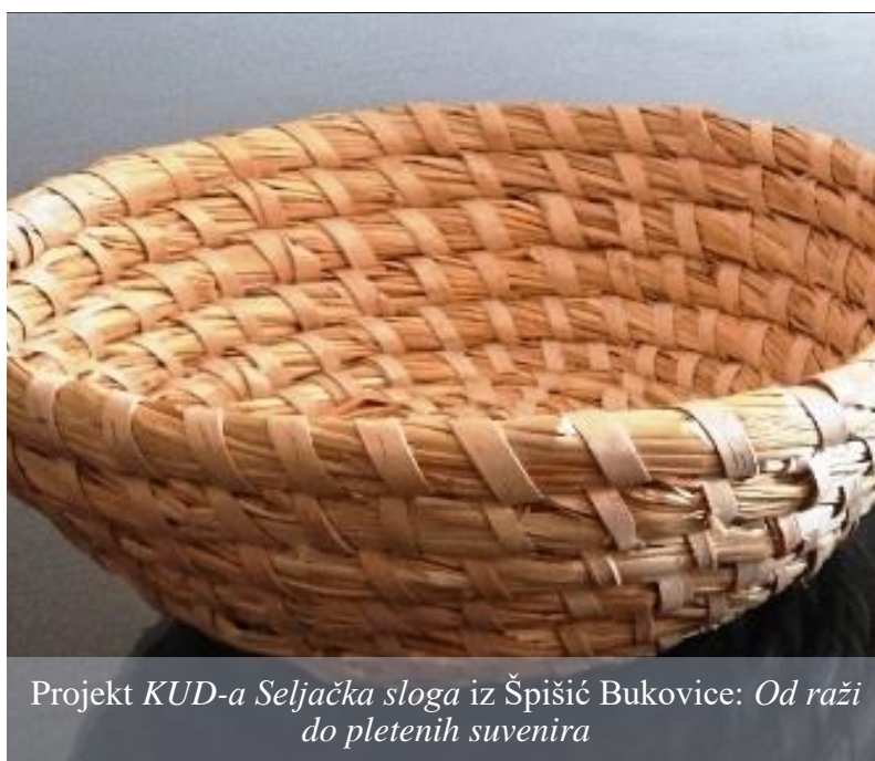
Projekt KUD-a Seljačka sloga iz Špišić Bukovice: Od raži do pletenih suvenira

Tako je predstavljen projekt udruge Od raži do pletenih suvenira , kojim su ostvarena značajna sredstva za obnovu zaboravljene nematerijalne kulturne baštine - pletenje košarica od slame. Osim toga, udruga je za ovu vještinu osposobila svoje i druge članice te izradila vlastiti suvenir koji prodaje u prigodi svojih promocija.