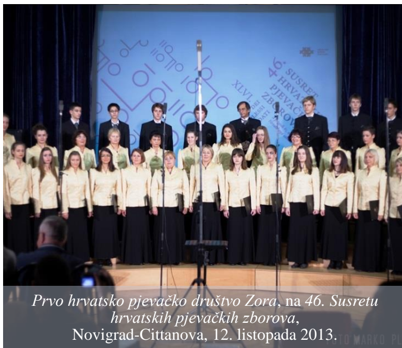
Prvo hrvatsko pjevačko društvo Zora, na 46. Susretu hrvatskih pjevačkih zborova, Novigrad-Cittanova, 12. listopada 2013.

građanski društveni život, posebice nakon 1860. godine, kada bilježimo pojavu značajnijeg osnivanja društava različitih vrsta (Širola, 1922, 210-211). U tom razdoblju ustanovljavaju se sljedeći zborovi: Prvo hrvatsko pjevačko društvo Zora iz Karlovca (još uvijek aktivno), osnovano 1858. godine kao Društvo karlovačkih pjevača , Hrvatsko pjevačko društvo