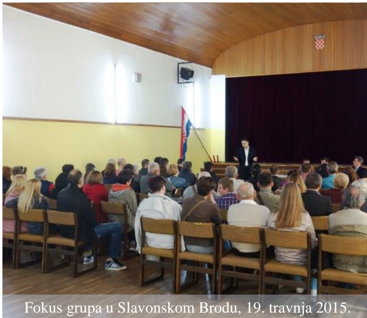
Fokus grupa u Slavonskom Brodu, 19. travnja 2015.

Spomenute fokus grupe imale su otvoreni karakter na način da smo njihove sudionike pitali za mišljenja i stavove o stanju kulturno-umjetničkog amaterizma u njihovoj županiji te kako oni vide mogućnosti njegova unapređenja. 70 Neke od tih fokus grupa usmjerili smo prema drugoj temi razgovora - zajednicama kulturno-umjetničkih udruga pojedinih županija, kao primjerima dobre prakse, i Hrvatskom saboru kulture ,