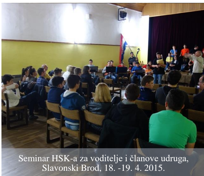
Seminar HSK-a za voditelje i članove udruga, Slavonski Brod, 18. -19. 4. 2015.

Predstavnici udruga (3) Brodsko-posavske županije 164