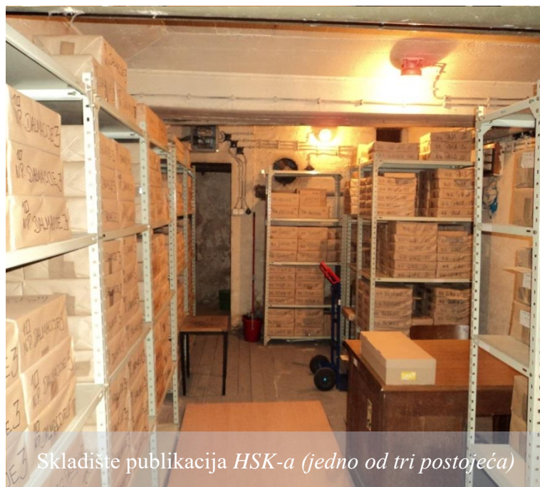
Skladište publikacija HSK-a (jedno od tri postojeća)

Iz namjerno poduže opisane prostorne agonije HSK-a, duge oko 19 godina, s ukupno 5 preseljenja mogu se izvući zaključci o društvenom lutanju u promišljanju misije i vizije ove organizacije, što dakako nije doprinosilo niti mogućnostima njenoga uspješnijeg rada. U međuvremenu, ni u pravnoj normativi nije se puno napravilo za HSK-a za razliku od Zakona o tehničkoj kulturi (NN, br. 76/93)