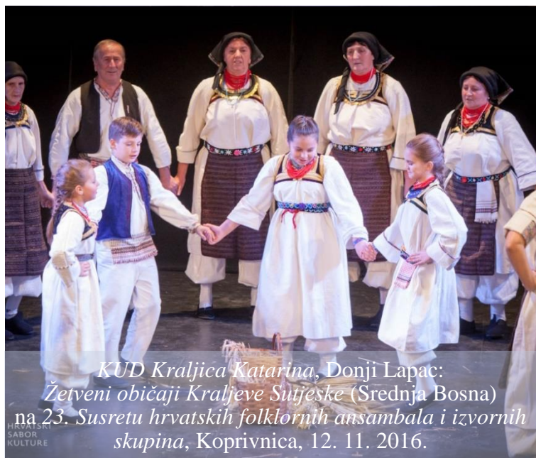
KUD Kraljica Katarina, Donji Lapac: Žetveni običaji Kraljeve Sutjeske (Srednja Bosna) na 23. Susretu hrvatskih folklornih ansambala i izvornih skupina, Koprivnica, 12. 11. 2016.

Članstva udruga u brojčanom smislu značajno se razlikuju, tako nalazimo one koje broje od desetak članova pa do 200, odnosno 250. Jedna udruga broji čak 200 do 250 aktivnih članova podijeljenih u sekcije, sukladno dobi članova. U drugu, ubrojili su sve žitelje iz sela, pa tako i one koji se ne bave kulturno-umjetničkim radom, uključivši ih u snimanje dokumentarnih filmova koje je udruga osmislila s HTV-om (npr. pečenje rakije, žetva). Aritmetička sredina brojnog stanja članstva udruga (10) iznosi cca. 54, što govori kako je riječ o masovnijem obliku društvenog organiziranja. Slična je situacija s dobi članova udruga , pa neke u svom članstvu imaju skoro sve dobne skupine, u nekim prevladavaju djeca i mladi (negdje su prisutne samo djevojke), negdje srednja dob ili pak oni najstariji. Uglavnom se susreće dijapazon različitih dobnih skupina, od vrtićke pa do onih s 80-tak godina, koje gdje gdje zajedno participiraju.