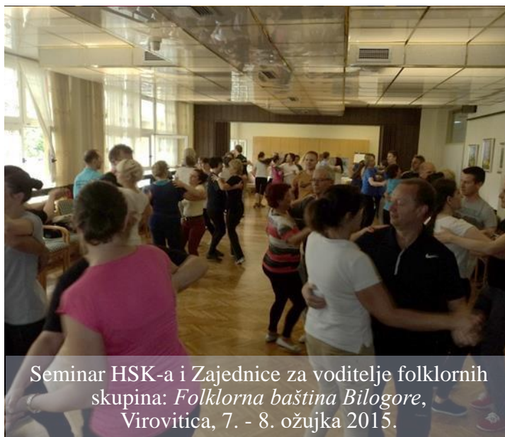
Seminar HSK-a i Zajednice za voditelje folklornih skupina: Folklorna baština Bilogore , Virovitica, 7. - 8. ožujka 2015.

Kao potporu organizaciji Seminara istaknuli su želju za školovanjem njihovih mladih članica u cilju preuzimanja mjesta voditelja „jer se mogu čuda napraviti kada dođete nekom stručnjaku u iskusne ruke“. Jedan od njih predložio je da se minimalno održe dva seminara godišnje na kojima bi se