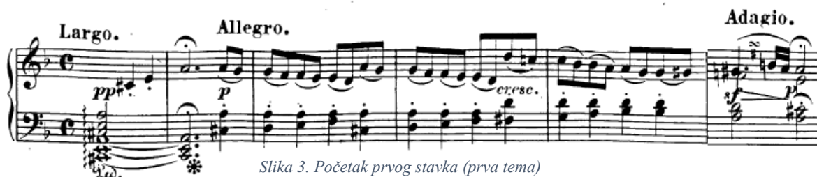
Slika 3. Početak prvog stavka (prva tema)