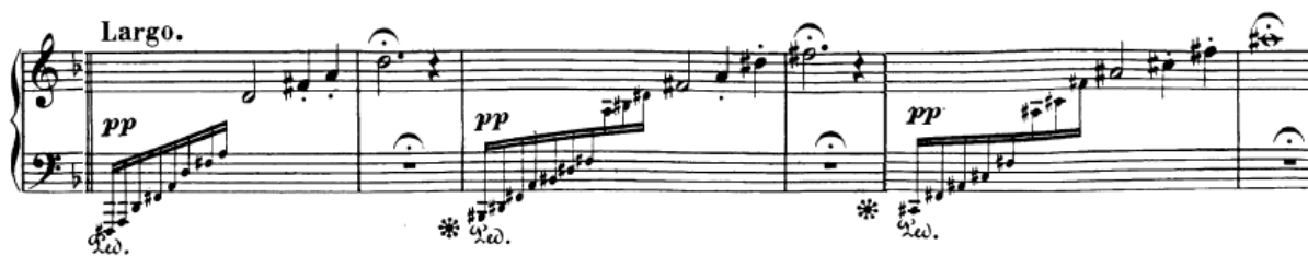
Slika 23. Arpeggio akordi (provedba)

što je dobro vizualizirati, što uvijek pomaže prilikom sviranja zbog slušne predodžbe. Prsti moraju dobro i aktivno raditi te treba pripaziti na dinamičku izjednačenost.