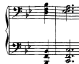
Slika 52. Tenuto akordi

Tenuto akordi su također prisutni (t. 2-3). Oni tehnički nisu toliko zahtjevni, treba se samo usredotočiti na izdržavanje tipaka nakon udara akorda i premještanje na idući.