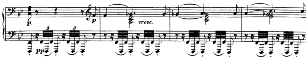
Slika 42. Kodeta u funkciji 'zastoja na dominantni'

Na taj način se zapravo vrlo lako moduliralo iz dominantnog tonaliteta u osnovni B-dur. Brza pasaža u 42. taktu dovest će nas do reprise koja, naravno, započinje prvom temom. Prva tema predstavljena u ekspoziciji je varirana – harmonije su ostale iste, ali melodija je obogaćena, dodan je srednji glas, a osim toga dodana je i harmonija u 47. taktu (mali durski septakord na tonici u funkciji subdominantne dominante). Drugi dio teme (t. 51) obogaćen je pratnjom u tridesetdruginkama koje se miješaju iz desne u lijevu ruku dok druga svira glavnu melodiju.