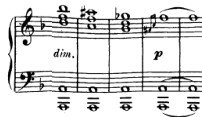
Slika 22. Tenuto akordi

Tenuto akordi javljaju se u 138. taktu u desnoj ruci pred kraj provedbe nad pedalom na dominantni. Nakon što odsviramo akord, treba izdržavati tipke sve četiri dobe, obavezno slušajući tonove koji su nastali, a zatim premještamo ruku na idući akord.