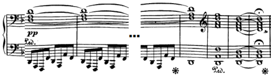
Slika 12. Koda

Druga tema započinje u 175. taktu i doslovno je transponirana u osnovni tonalitet, prema pravilima klasičnog sonatnog oblika (što odlično odgovara slušateljskom uhu jer je već dugo nismo čuli s obzirom na to da se materijal druge teme nije razrađivao u mostu). Na nju se u 203. taktu nadovezuje i kodeta, također doslovno transponirana. Stavak završava kodom od deset taktova (t. 224-233) koja se sastoji samo od toničkog akorda (d-mol) s osminskim pulsom u basovskoj dionici koja akord donosi razloženo. kojim se potvrđuje osnovni tonalitet.