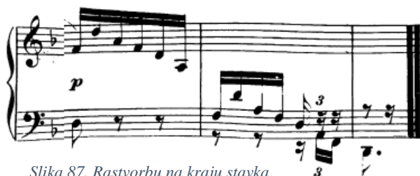
Slika 87. Rastvorbu na kraju stavka najbolje je podijeliti u dvije ruke

„d 1 “, nakon čega ton „a“ hvata lijeva ruka s obzirom na to da pripada položaju iz idućeg takta, a zatim bi posljednja tri tona u toj varijanti svirala desna ruka koja bi preskočila preko lijeve. Na taj način bi se jednostavno izbjegle neugodne promjene položaja.