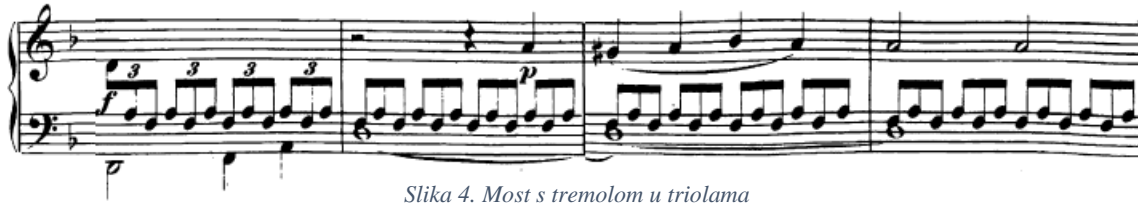
Slika 4. Most s tremolom u triolama

Kroz cijeli most (t. 21-40), kojem je uloga modulirati u e-mol kako bi druga tema mogla početi u dominantnom tonalitetu, faktura je ista: gornja dionica sadrži tremolo u triolama, dok donja najprije ima razloženi akord u donjem registru, a zatim nastavlja s melodijom u gornjem. Na tom principu je, dakle, građen cijeli most. Konkretna modulacija u a-mol događa se dijatonskim putem u 31. taktu kada je tonički sekstakord u d-molu (t. 29) tretiran kao subdominantni u a-molu, te je nakon njega upotrijebljen dominantni sekstakord (t. 31). Navedena faktura ostaje prisutna sve do trideset i osmog takta (ali puls u triolama ostaje) kada nastupa smanjeni septakord (dis-f-a-c) u funkciji dominantine dominante u e-molu (ciljni tonalitet), koji će se razriješiti u dominantu a-mola, kojom počinje druga tema.