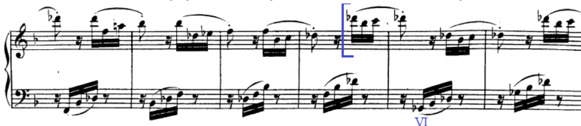
Slika 99. Nagla piana na submedijantnom kvintakordu često su dobra ideja

Lažna repriza počinje vrlo tiho, a zatim se gradacijom ostvaruje sve veći crescendo koji kulminira u 169. taktu gdje se izmjenjuju harmonija dominante i dominantine dominante, a pritom se ne smiju zanemariti ni sforzata u diskantu koja su naznačena. Nakon toga ponovno slijedi subito piano kojim počinje zadnji dio provedbe koji također generalno treba voditi u crescendo (rečenicu po rečenicu kako je i navedeno u formalno-harmonijskoj analizi) sve do zastoja na dominantnom septakordu u 199. taktu. Tada će desna ruka