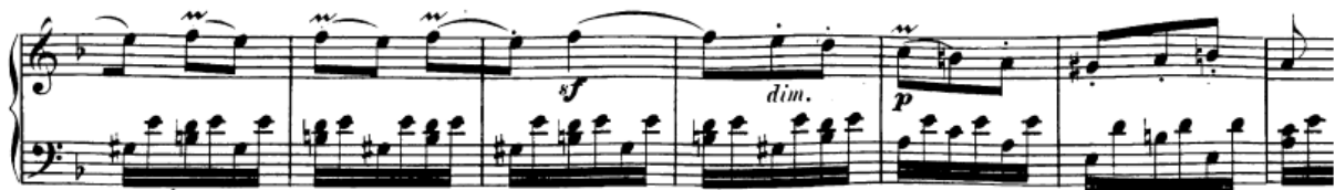
Slika 97. Rad na dinamičkom planu druge teme dobro je vježbati posebno

Melodija druge teme koju donosi desna ruka je vrlo pjevna. Zato ju je dobro vježbati posebno da bismo bolje zapamtili kakve ćemo dinamičke valove (i na kojim mjestima) uraditi. Dobro je voditi crescendo do naznačenog sforzata u 47. taktu, a zatim diminuendo do kraja fraze.