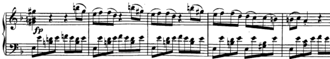
Slika 5. Druga tema

Kroz cijeli most (t. 21-40), kojem je uloga modulirati u e-mol kako bi druga tema mogla početi u dominantnom tonalitetu, faktura je ista: gornja dionica sadrži tremolo u triolama, dok donja najprije ima razloženi akord u donjem registru, a zatim nastavlja s melodijom u gornjem. Na tom principu je, dakle, građen cijeli most. Konkretna modulacija u a-mol događa se dijatonskim putem u 31. taktu kada je tonički sekstakord u d-molu (t. 29) tretiran kao subdominantni u a-molu, te je nakon njega upotrijebljen dominantni sekstakord (t. 31). Navedena faktura ostaje prisutna sve do trideset i osmog takta (ali puls u triolama ostaje) kada nastupa smanjeni septakord (dis-f-a-c) u funkciji dominantine dominante u e-molu (ciljni tonalitet), koji će se razriješiti u dominantu a-mola, kojom počinje druga tema.