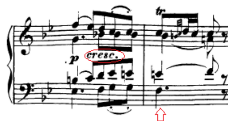
Slika 60. Vođenje zaključne fraze

U polovičnoj kadenci u 7. taktu nastavljamo voditi akorde izvlačeći gornji glas koji ima melodiju i diferencirajući višeglasje koliko je to moguće. U samoj je partituri označen i logičan crescendo koji vodi do trostruke appoggiature koja kao lokalni vrhunac (zbog napetosti harmonije) mora biti dinamički najjača. Zanimljivo je da je gotovo identična situacija (appoggiature i polovična kadenca) bila je i u prvom stavku (6. takt), također na zaključku prve rečenice.