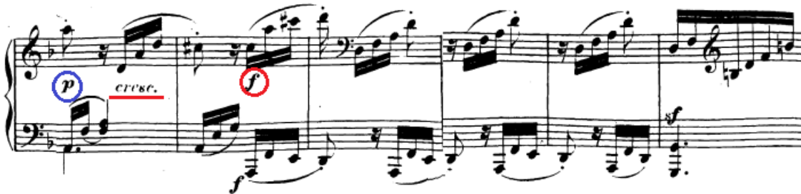
Slika 95. Nagli forte u prijelazu na most

Skok od oktave u forteu prije kromatske skale u 24. taktu označen je forteom i sforzatom. Međutim, skok je već sam po sebi naglašen, pa se izbjegavanjem sforzata može dobiti zanimljiv efekt. Pritom je važno u lijevoj ruci odsvirati svaku šesnaestinku, a ne odsvirati kao da se radi o arpeggio akordu. Da bi se ta jasnost još bolje postigla, u slobodnijoj interpretaciji moguće je gotovo neprimjetno na tom mjestu usporiti tempo. U kromatskoj skali koja slijedi treba maknuti pedal.