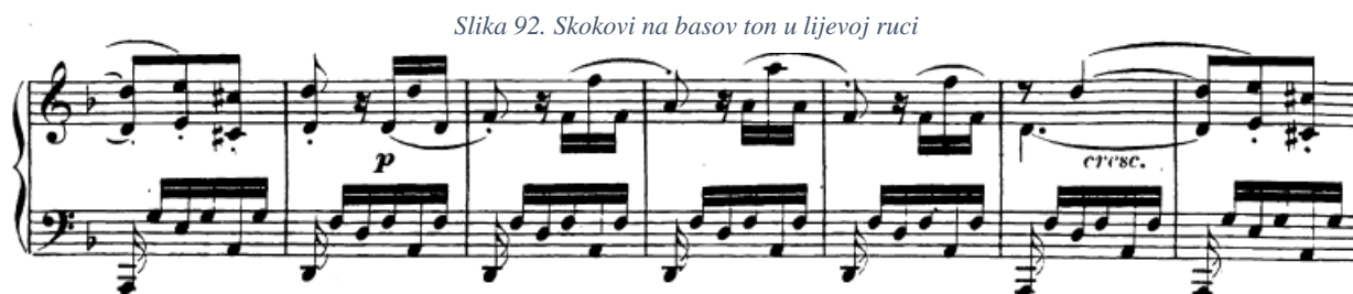
Slika 92. Skokovi na basov ton u lijevoj ruci

Dulji trileri se ne javljaju, međutim prisutni su kratki ukrasi osminki u melodiji druge teme, a sviraju se kao mala triola (t. 43). Većih skokova nema, no u kodeti se u lijevoj ruci javljaju skokovi na basov ton nakon čega slijedi položajna figura (slična situacija bila je prisutna i u drugom stavku), te se ta shema ponavlja svaki takt. Skok mora biti predvođen prstom, a vježbati je najbolje ponavljanjem skoka u sporom tempu ili prvo 'namještanjem' prsta skokom na basov ton pa tek onda sviranjem tipke.