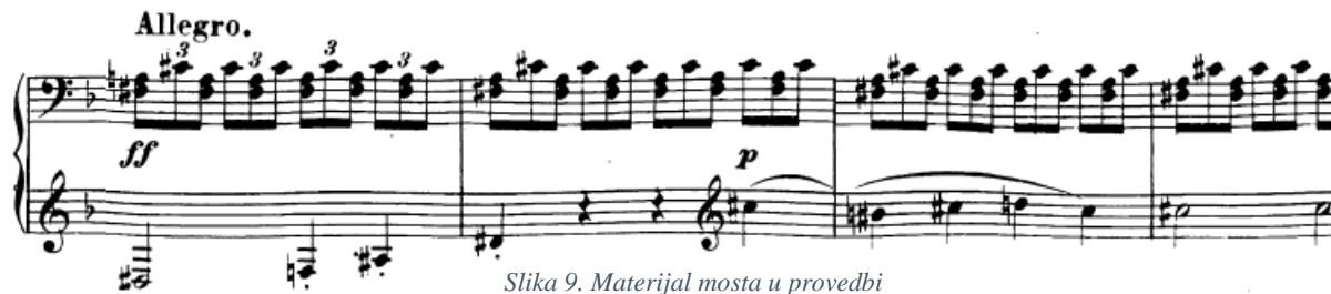
Slika 9. Materijal mosta u provedbi

D-dur sekstakorda (submedijanta fis-mola), smanjenog septakorda na tonu His (dominantina dominanta), te toničkog kvartsekstakorda u – Fis-duru. No, zatim Beethoven iznenada mutira iz Fis-dur kvintakorda u fis-mol u kojem kreće materijal iz mosta!