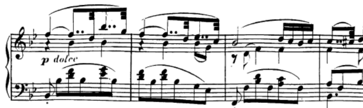
Slika 44. Druga tema u reprizi

Druga tema u reprizi je doslovno transponirana iz dominantnog u osnovni B-dur. Nakon nje se izravno nadovezuje kodeta , čije su tremolo oktave u ekspoziciji imale funkciju zastoja na