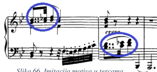
Slika 66. Imitacija motiva u tercama

U kodi se prestaje koristiti motiv tremolo oktava, a ona generalno služi smirivanju napetosti za kraj stavka. Iako je cijela koda u pianu, naznačena su sforzata i crescendo koja se svakako ne smiju zanemariti kako bismo dodatno oživjeli materijal. Svakako bi bilo dobro istaknuti i melodiju u tercama koja se imitira (t. 90-91) u donjem registru. Motiv s gruppettom ovdje se javlja izolirano, tj. bez pratnje, što će motivu dati dodatnu napetost i iščekivanje.