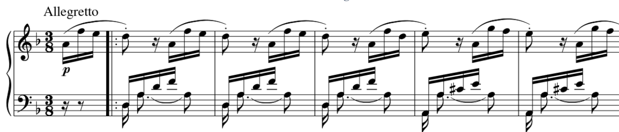
Slika 68. Prva tema trećeg stavka