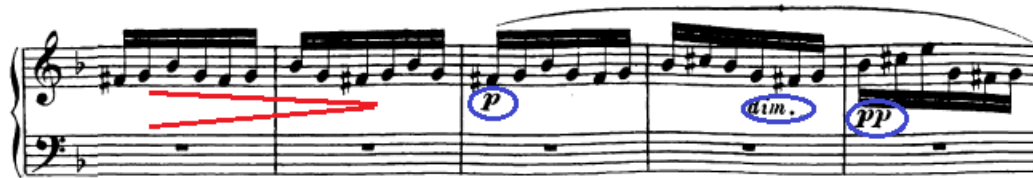
Slika 100. Figuracije pred reprizu završavaju naglijim diminuendom

ostati sama svirajući figuracije. Pritom je vrlo bitno ostati u forteu cijelo vrijeme i naglašavati tonove koji su označeni sforzatom. Tek pred samu reprizu počinje stišavanje i to čak do pianissima.