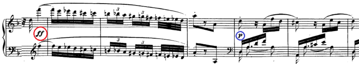
Slika 102. Kromatska skala posljednji je glasni moment u stavku prije tihe kode

U drugoj reprizi se tema doslovno ponavlja kao u ekspoziciji. Novi dio kreće u 382. taktu gdje treba doživjeti iznenadnu pauzu od šesnaestinke i ostvariti fortissimo u oktavnom skoku koja prethodi kromatskoj skali koja se sad javlja u produljenom i pojačanom obliku (kako dinamikom, tako i fakturom, jer sad desnu ruku prati i lijeva u ekvisonu). Moglo bi se reći da je ta kromatska skala u fortissimu posljednji 'trzaj' stavka. Nakon nje slijedi koda koja je u potpunosti u pianu do samoga kraja stavka i djeluje kao smirenje.