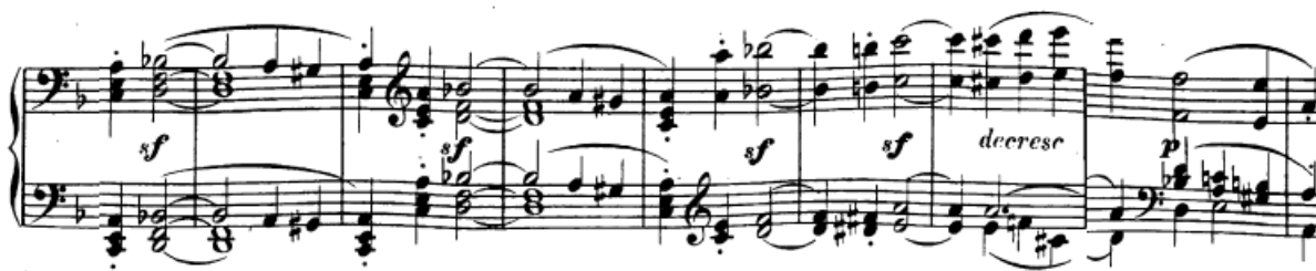
Slika 32. Interpretativno zanimljiv sinkopirani dio s izmjenama non legata i legata

način kao i prije) desna ruka ostaje sama. I u ovom slučaju dinamika ne opada nego direktno prelazi u novi dio.