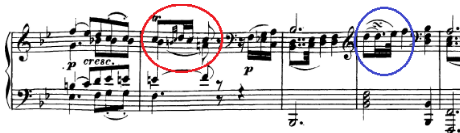
Slika 56. Triler i gruppetto

Trileri. U drugom stavku se od trilera javljaju 'klasičan' triler (8. takt) i gruppetto (10. takt).