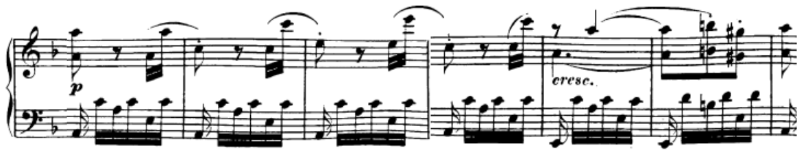
Slika 71. Kodeta

zatim u simultanim oktavama. Kod drugog ponavljanja ona se proširuje s još četiri takta (t. 63-66) koja su u principu ponavljanje drugog dijela rečenice. Kadenca je autentična u a-molu.