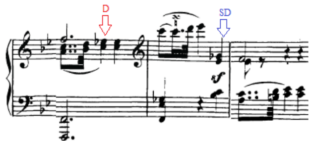
Slika 39. Korištenje sniženog šestog stupnja u sklopu dominantne i subdominante funkcije

Stavak započinje prvom temom u B-duru (tercno-srodan tonalitet s d-mol tonalitetom prvog stavka). U prvim taktovima gdje se tema predstavlja, izmijenjuju se toničke i dominantne harmonije. Ta će velika osmerotaktna rečenica kadencirati polovično (uz trostruku appoggiaturu s funkcijom dominantine dominante), a među akordima na kraju rečenice koriste se i sekundarne dominante za drugi i peti stupanj.