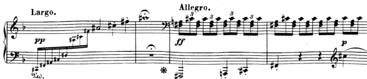
Slika 34. Iznenađni fortissimo i allegro u provedbi

Provedba započinje arpežiranim akordima na isti način kao i ekspozicija, te i tu za interpretaciju vrijedi sve što sam prije napisao: slušati svaku notu, ostvariti mir u Largo dinamici i nigdje ne žuriti. Poslije posljednjeg tona svakog arpeggia (koji je pod koronom) čekati da akord odzvoni neko vrijeme, pa zatim maknuti pedal prije idućeg. Nagli fortissimo koji nastupa u 103. taktu mora zaista biti iznenađan i efektan. Svakako i prije njega treba dignuti pedal, da se dva različita dijela ne bi miješala.