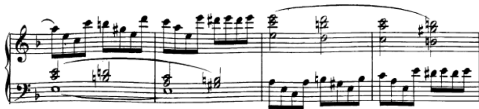
Slika 33. Imitacije razloženih akorada i obrat dionica

I kroz kodetu je prisutna prirodna potreba za crescendom s obzirom na sve intenzivnije harmonije koje skladatelj slaže. U pasažama lijeve ruke valja malim naglascima označiti tešku dobu u taktu, te dinamički rasti sve do dijela s malim rastvorbama. U tom dijelu se dionice lijeve i desne ruke izmjenjuju – koristi se imitacija koju valja istaknuti. Stoga preporučujem da se polovinke sviraju tiše, a melodija u rastvorbama jače, te tako nastaviti neovisno u kojoj ruci se što svira.