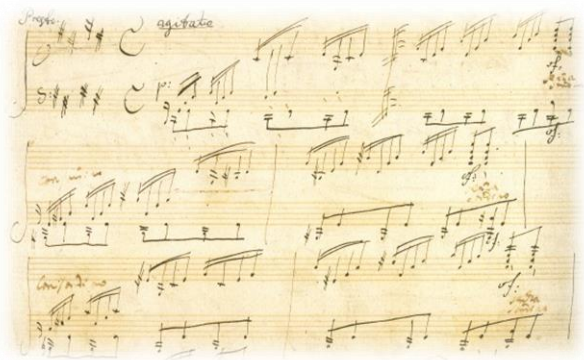
Slika 2. Beethovenov rukopis 'Mjesečeve sonate'

U svojem srednjem razdoblju Beethoven je počeo gubiti sluh, najprije neznatno, no postupno je potpuno oglušio. Beethoven počinje kršiti utemeljena pravila kompozicije. 1804. piše svoju treću simfoniju Eroicu koja opovrgava sva temeljna pravila kompozicije simfonije. Tada piše Rasumovsky gudačke kvartete iz op. 59 (br. 7, 8, 9), Četvrti i peti klavirski koncert, violinski koncert, četvrtu, petu, šestu, sedmu i osmu simfoniju, klavirske sonate uključujući br. 21 u C-duru ( Waldstein ) i br. 23 u f-molu ( Appassionata ), operu Fidelio , te poznatu Kreutzer sonatu za violinu i klavir op. 47. 7