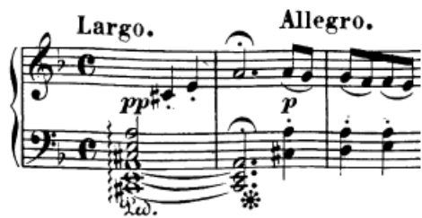
Slika 28. Nagli kontrasti u tempu

Prvi stavak 'Olujne sonate' vrlo je interesantan u vidu promjene ugodaja i raspoloženja, koja je stalno prisutna, a mijenja se zajedno s tempom. Tako je već na samom početku nakon početna dva takta u Largo tempu nagli skok na brz i energičan Allegro. Takav kontrast u tempu, boji i atmosferi važno je dobro istaknuti. Arpežiranom akordu u Lentu svakako valja lagano dinamički istaknuti najviši ton, jer je to ujedno i prvi ton melodije. Pritom treba biti smiren i dobro oslušivati svaku notu koju odsviramo. Nakon toga treba napraviti mali dah skupa s dizanjem pedala prije prelaska na Allegro kako bismo i slušno odvojili ta dva dijela.