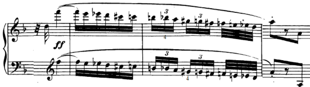
Slika 85. Allegro prstomet u kromatskoj skali

Skale. 'Klasičnih' skala u trećem stavku u principu nema, no javlja se kromatska skala i to najčešće u kraćoj varijanti kao poveznica između fraza u prvoj temi (npr. u t. 24), a ima je i u duljoj varijanti prije same kode u 383. taktu. Kad se svira u tempu, pokreti ruku i prstiju moraju biti minimalni, te ruku moramo brzo premetati (ponovno, olakšavajuća je okolnost što se premeće na crnu tipku što je pozicijski lakše). Vježbati se može kroz različita tempa ili akcentiranjem svake ente note da bi se ostvarila izjednačenost u ritmu i dinamici. U ovoj duljoj varijanti kromatske skale preporučujem allegro prstomet s obzirom na tempo, dakle u desnoj ruci bi se ton „b“ bi se svirao četvrtim prstom, a u lijevoj četvrtim prstom ton „gis“ (ostatak skale bi bio standardnog prstomet).