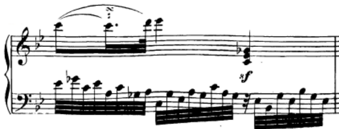
Slika 46. Pokretne (1. doba) i položajne figure (2. i 3. doba) u l. r.

Drugi stavak u sporijem je tempu, pa je samim time u virtuoznom smislu tehnički znatno manje zahtjevan od prvoga stavka, međutim svakako ima težih mjesta u drugom smislu, primjerice višeglasje u jednoj ruci koje je na mjestima dosta zahtjevno ostvariti. Osim toga javljaju i brojne note sitnijih ritamskih vrijednosti koje svakako treba dobro navježbati. No, svakako će u ovom stavku najteži zadatak biti interpretacija, o čemu ću govoriti kasnije. Stavak u svakom slučaju obiluje raznim vrstama tehnike: