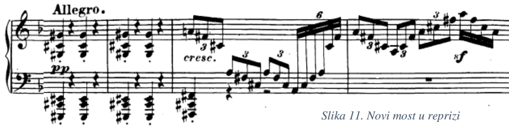
Slika 11. Novi most u reprizi

kojega skladatelj dodaje još četiri takta (t. 159-162) melodije bez pratnje, na isti način kao i maloprije (u stilu recitativa).