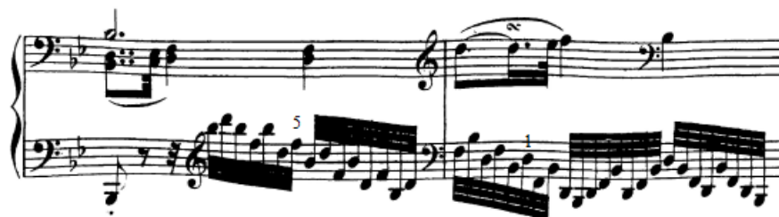
Slika 48. Primicanje malog prsta u desnoj ruci i palca u lijevoj

Rastvorbe. Brojne rastvorbe prisutne su u drugom dijelu prve teme u reprizi (t. 51-58). Radi se o varijantama malih rastvorbi gdje su položajne figure vezane primicanjem petog prsta (t. 51) ili primicanjem palca (t. 52). Vježbati je moguće na načine koje sam maloprije naveo – najprije s vježbama za utvrđivanje položaja, a zatim za promjene položaja.