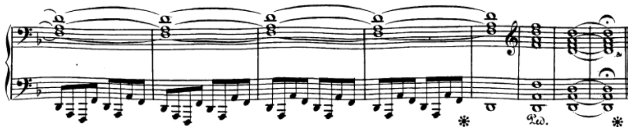
Slika 37. Koda s rastvorbama u lijevoj ruci

Koda sadrži rastvorbe u lijevoj ruci o kojima sam već pisao u tehničkoj analizi (vidi sliku 18). Prstomet koji sam predložio doprinijet će jasnoći basa u tako dubokom registru uz pianissimo dinamiku. Za ovaj dio svakako treba reći i nekoliko riječi o pedalima. Na partituri je naznačen pedal kroz cijeli taj dio, međutim to je pisano za klavire Beethovenova vremena. Današnji klaviri imaju puno masivniji zvuk i pedali puno dulje drže tonove, pa svakako valja mijenjati pedal svaki takt i to polupedalima ili vibrato pedalom. Uz izvježbanu izigranost i jasnoću basa to će biti dobitna kombinacija.