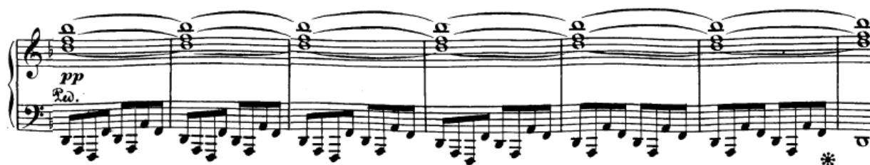
Slika 18. Rastvorba u kodi

Slične figuracije temeljene na rastvorbama tj. razloženim akordima još se javljaju u samoj kodi u lijevoj ruci (slika 18). Radi se o rastvorbi toničkog kvintakorda gdje u položajne figure vezane odmicanjem ili podmetanjem palca. Sve to zahtijeva veliku aktivnost prstiju i zgloba. Pozicija mora biti jasna a prste treba manje dizati. I ovo je dobro vježbati akcentiranjem, na ritmove ili proširivanjem i stezanjem formule ako je nužno. Ova situacija u kodi je zapravo najteža što se tiče skala jer jedina obuhvaća podmetanje palca. Ovdje bih svakako spomenuo prstomet lijeve ruke koji preporučujem za sviranje ove skale: 145 – 125 – 12 (što se zatim ponavlja prva četiri takta, kasnije je sve u poziciji) 12 . Uz opušten zglob, takav prstomet bude dosta ugodan, a i lakše je dobiti na jasnoći basa koja je neophodna s obzirom da je sve pisano u vrlo niskom registru te s obzirom na dinamiku ( pianissimo ), a pritom se ne smije pretjerivati ni s pedalom (više o tome kasnije u interpretativnoj analizi).