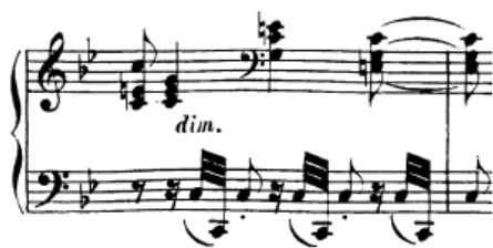
Slika 53. Non legato akordi (desna ruka)

I ovdje se radi o sporom tempu, pa se ručni zglobovi pomiču gore-dolje prilikom premještanja. Non legato akordi prisutni su prilikom nizanja obrata toničkog kvintakorda u 29. taktu. S obzirom na tempo, svirat ćemo ih iz podlaktice (da se radi o bržem tempu, svirali bismo ih iz ručnog zgloba).