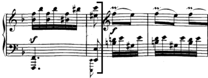
Slika 96. Frigijska kadenca kao kraj fraze prije početka druge teme

Subito forte koji se javlja početkom mosta (30. takt, slika 95) nakon kraćeg naglog crescenda vrlo je značajan trenutak iznenađenja te mu se interpretativno svakako mora dati na važnosti. Slično vrijedi i kod modulacije u C-dur koja započinje rastvorbom dominantnog septakorda (34. takt), a i u partituri je označena sforzatom. U taktovima s razloženim oktavama C-dur akorda (t. 35-37) dobro je maknuti pedal iako je cijelo vrijeme ista harmonija s obzirom da više odgovara željenom karakteru.