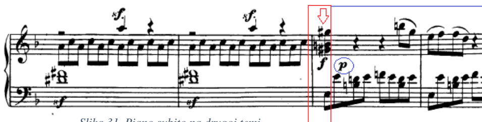
Slika 31. Piano subito na drugoj temi

Most je u harmonijskom smislu Beethoven tako genijalno razradio da same harmonije jednostavno vode porastu napetosti i intenziteta sve od 29. takta pa do početka druge teme u 41. taktu. U skladu s time moramo postupati i prilikom sviranja te doživjeti i slušati svaku promjenu harmonije. Faktura cijelo vrijeme ostaje nepromijenjena, a pritom još samo treba pripaziti na sforzata koja su naznačena u desnoj ruci (ti naglašeni tonovi također visinski rastu). Svakako najintenzivniji dio mosta je njegov kraj (posljednja tri takta, počevši s 38. taktom) u fortissimo dinamici na smanjenom septakordu u funkciji dominantine dominante. Prije rješenja u dominantu, čime počinje druga tema, ne treba raditi ritardando, no svakako treba slušati i dati na značaju posljednjim osminkama tremola vrlo malim tenutima.