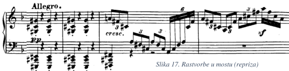
Slika 17. Rastvorbe u mostu (repriza)

Jedna nešto zahtjevnija situacija s rastvorbama javlja se u novom mostu u reprizi (t. 165). Radi se o rastvorbi (tj. razloženom akordu) kroz više oktava koje svakako preporučujem podijeliti u dvije ruke kako bi svaka ruka svirala u položaju i omogućila brži tempo i lakše i razgovjetnije sviranje. U tom slučaju također neće biti premetanja ruke i podmetanja palca, što će znatno olakšati situaciju.