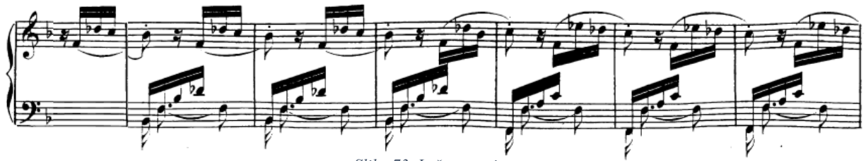
Slika 73. Lažna repriza

U b-molu skladatelj ostaje duže, te ovdje osim toničke i dominantne funkcije koristi i subdominantnu funkciju (t. 135-138) ili pak šesti stupanj (t. 143), a prisutan je i kratak uklon u As-dur koji može biti shvaćen kao sekundarna dominantna za prirodni sedmi stupanj (t. 145-148).