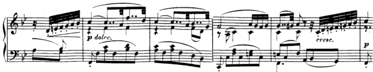
Slika 57. Skokovi na bas u dionici lijeve ruke

Skokovi. Iako se ne radi o nekim zahtjevnim skokovima, a i tempo je sporiji, treba svakako istaknuti neke slučajeve. Premještanje tremolo motiva iz basovskog u diskantski registar (most od t. 23 nadalje, vidi sliku 54) zahtjeva prebacivanje ruke i skok koji mora biti vrlo precizan. Ruka mora biti slobodna, lakat pokretan, zglobovi elastični, šaka raširena, a prsti moraju voditi kuda će ruka ići. Skok automatiziramo ponavljajućim vježbanjem. Prije samog skoka je bitna tonska predodžba tonova koje ćemo odsvirati. Osim toga prisutni su skokovi i u lijevoj ruci na basov ton u drugoj temi (t. 31, 33 i slično):