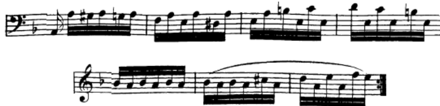
Slika 88. Skrivena dvoglasja u kodeti

Tehnika rotacije najviše se koristi u vidu jednostranog udara (polurotacija) kod skrivenih dvoglasja koja su prisutna u kodeti, najprije u lijevoj ruci u drugom dijelu kodete (t. 79) te kasnije i u desnoj ruci (t. 93). Takve situacije imali smo i u prvom stavku i dobro ih je vježbati, primjerice, u dvohvatima s diferenciranjem dinamike između glasova, tako da to dvoglasje naučimo čuti. Dobro ih je i vježbati kao dvije pod lukom gdje bi se glas koji donosi melodiju akcentirao.