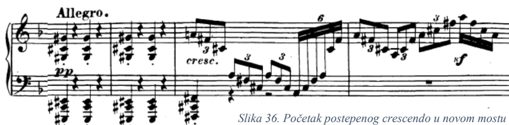
Slika 36. Početak postepenog crescendo u novom mostu

nju vrijedi isto (crescendo kroz frazu sve do sforzata na kadenci). Nakon toga slijedi još jedan sporiji recitativni odlomak koji mora izvedbeno odgovarati prethodnom. Također će završiti na koroni. Kad posljednji ton odzvoni, pedal se diže i kreće novi dio – novi most građen od novog materijala.