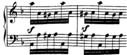
Slika 83. Pomične figure u protupomaku

Osim u prvoj temi, položajne figure prevladavaju i u ostatku stavka. Recimo, pratnja u lijevoj ruci tijekom cijele druge teme je temeljena samo na njima (t. 43, slika 82). Zanimljive su i pokretne figure na kraju kodete gdje se u obje ruke u protupomaku svira razlomljena oktava nakon čega se premeće ruka (t. 87, slika 83) i vraća u početni položaj. U provedbi se javljaju i položajne figure temeljene na rastvorbama koje se izmjenjuju u lijevoj i desnoj ruci (t. 99) šireći se kroz opseg više oktava. U principu one nisu problematične i radi se i dalje samo o položajnim figurama koje se sviraju jednako kao i u prvoj temi gdje su se javljale. Spomenuo bih još i figuracije desne ruke na kraju provedbe gdje su korišteni zanimljivi položaji, gdje je recimo kažiprst u samom položaju namješten preko palca. Položaj nije toliko nezgodan s obzirom na to da je kažiprst na crnoj tipki, a palac na bijeloj (slika 83).