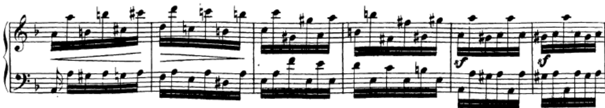
Slika 90. Lomljene oktave u desnoj ruci (kodeta)

Oktave se kao dvohvati non legato javljaju se u drugoj temi (t. 55) gdje se nakon rastavljenih oktava one počinju svirati simultano (desna ruka) i to iz ručnog zgloba, na čijoj pokretljivosti treba raditi dok su palac i mali prst fiksirani na oktavu. Nakon toga se kombiniraju non legato (tj. staccato) i legato oktave, pa treba dobro proučiti na kojim mjestima se svira legato, a na kojima ne. Tu će svakako pomoći vježbanje