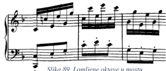
Slika 89. Lomljene oktave u mostu su tehnički vrlo nezgodne

Osim toga, na tehnici rotacije temeljene su rastavljene (lomljene) oktave koje su u mostu jedno od težih tehničkih mjesta (t. 35 i sukladni u reprizi, vidi i sliku 76). Šaka u takvim slučajevima mora zadržati fiksirani oblik raspona oktave, a kod promjene položaja će se suziti (kod uzlaznih oktava) ili širiti (kod silaznih oktava) pa će doći do intervala sekste, odnosno decime. Dobro je vježbati u sporom tempu uz aktivne prste i obraćanjem pozornosti na rotaciju podlaktice. Osim toga moguće je i vježbati umnožavanjem svake pojedine oktave uz akcentiranje određenih tonova ili pak sve oktave vježbati simultano. Rastavljene se oktave u nešto lakšem obliku javljaju i u drugoj temi (t. 51) gdje ih je lakše svirati zbog razloga što se ne radi o skokovima, već su oktave jedna do druge (pomak za sekundu više ili niže). Još su prisutne i na kraju kodete, gdje su na mjestima oktave jedna do druge, a ponegdje se javljaju u skokovima. I ova je situacija, međutim, lakša od one u mostu jer se radi o skokovima na crne tipke.