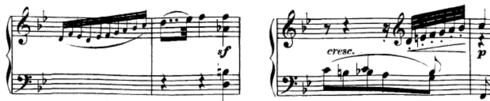
Slika 47. Elementi skale prije nove fraze

Skale. Elementi skala korišteni su najčešće kao poveznica između fraza: