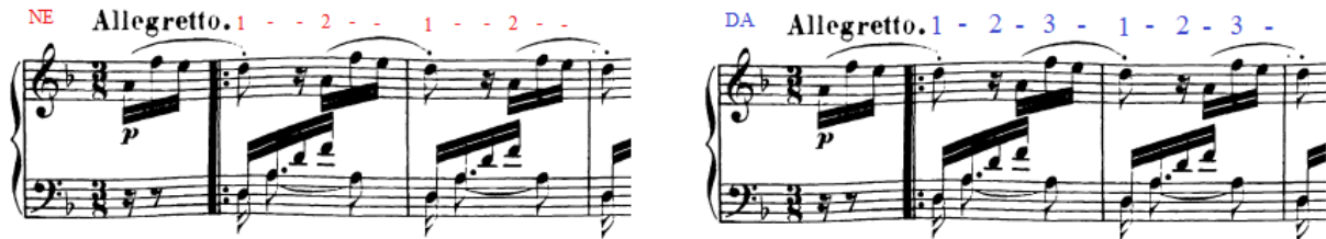
Slika 93. Pravilni osjećaj pulsa u trećem stavku

Slušno doživljavanje pulsa možemo vježbati tako da stavak sviramo u sporom tempu radeći naglaske prvu, drugu i treću dobu (osminku) u taktu.