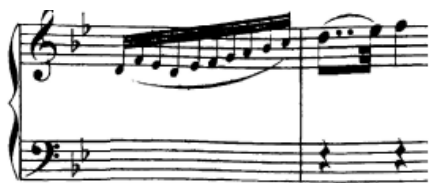
Slika 59. Pasaže prije nove fraze

Kao što je spomenuto u tehničkoj analizi, prije novih fraza je u desnoj ruci često upotrebljena brza pasaža u tridesetdruginkama kao prijelaz. Nakon što je tehnički izvježbana i izigrana, treba raditi na njenom ostvarivanju u piano dinamici, nastojeći da zaista zvuči poput jednog melodijskog vala koji vodi do prve note nove fraze, a tu je svakako poželjno napraviti i mali crescendo koji bi trebao spontano doći vođenjem fraze. Ovakve kratke pasaže javljat će se i kasnije tijekom stavka, te će i za njih vrijediti iste stvari.