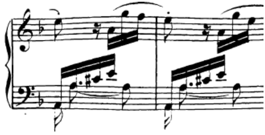
Slika 81. Premetanje ruke

Kod prve teme iznimka je samo na mjestima gdje se u lijevoj ruci (npr. u četvrtom taktu, slika 81) javljaju i pokretne figure i tu se radi o premetanju lijeve ruke s obzirom na to da je opseg tonova prevelik da bi se uhvatio u položaj. Ovdje svakako treba osigurati da ruka ne zapinje prilikom promjene položaja. Osnovno je da prsti u poziciji moraju biti artikulirani, a pritom onda još treba raditi na