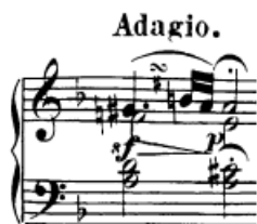
Slika 27. Gruppetto

Konačno, od trilera se javlja samo gruppetto u 6. taktu krajem glavne fraze prve teme (i ponovno isti u reprizi). U sporom je tempu (Adagio) pa tehnički nije zahtjevan, a treba obratiti pozornost da je ispod znaka za gruppetto povicilica što se odnosi na ton fis, pa ga treba svirati kao A-Gis-Fis-Gis.