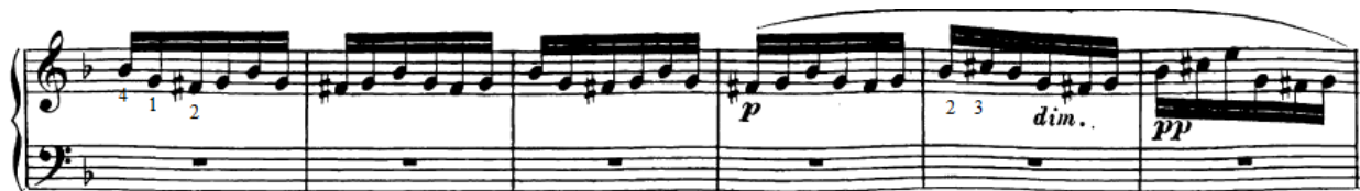
Slika 84. Figuracije temeljene na položajnoj figuri