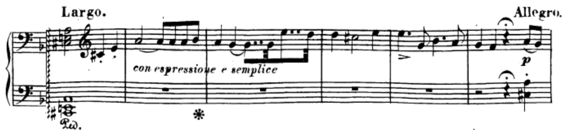
Slika 35. Recitativni odlomak u reprizi

Interpretacija koju sam naveo za most u ekspoziciji može se na jednak način primijeniti i za materijal mosta u provedbi: dakle, ključna stvar je ostvariti lakoću tremola u desnoj ruci, dinamički kontrast između melodije u basu i diskantu, te generalni rast dinamike i napetosti kroz cijeli dio. U ovom slučaju kulminacija dolazi u 128. taktu gdje se dolazi do fortissima i slijedi završni dio provedbe (zastoj na dominantni – t. 128-146). Taj dio treba ostati neizvjestan, ali opet na neki način i statičan s obzirom na pedalni ton na dominantni koji je stalno prisutan u fakturi. Ponavljam, bitno je istaknuti skriveno dvoglasje, te voditi melodiju u tercama, a isto tako i obavezno ostvariti zapisana sforzata. Uloga ovog dijela je kroz svojevrsnu statičnost donijeti napetost koja će dovesti do reprize.