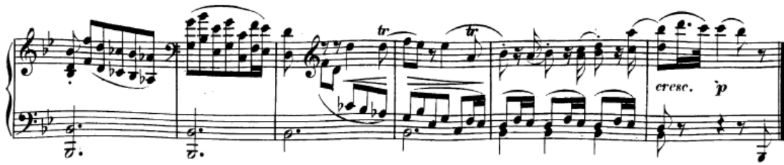
Slika 45. Završni taktovi kode

materijal prve teme, zatim kadencira varijantom mješovite kadence (t. 96-98) nakon čega slijedi završni dio od šest taktova, također na toničkom pedalu, čime završava stavak (dakako u B-duru).