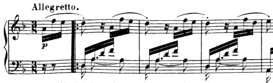
Slika 80. Položajne figure prevladavaju u trećem stavku

Čitav je treći stavak, kad pričamo o vrstama tehnike, zapravo temeljen na položajnim figurama . Naime, preko 90% skladbe ispunjeno je samo položajnim figurama i one su većinom temeljene na rastvorbama akorada (uzmimo za primjer prvu temu koja je gotovo cijela građena samo od položaja koji se izmjenjuju u desnoj i lijevoj ruci). To je svakako dobra vijest za pijanista s obzirom da su položajne figure najmanje zahtjevna klavirska tehnika. Radi se uglavnom o širim položajima jer prelaze raspon kvinte. Ruka je, dakle, uvijek u istoj poziciji, samo se izmjenjuju prsti koji sviraju. Problem koji bi se tu mogao javiti je eventualna neizigranost kod sviranja. Ako dođe do tog problema, dobro je vježbati položaje prstnim staccatom ili akcentiranjem određenih tonova kako bi se to saniralo.