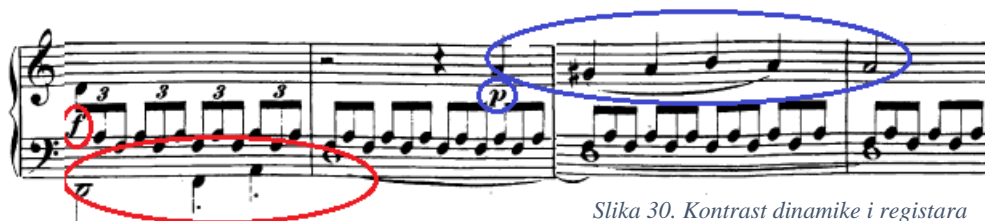
Slika 30. Kontrast dinamike i registara

Most (21. takt) je, kako sam već naveo, jedno od tehnički najzahtjevnijih mjesta, a u interpretativnom smislu najbitnije je paziti na što tišu pratnju (tremolo u desnoj ruci). Neki ovo mjesto sviraju tako da prebacuju tremolo iz desne u lijevu ruku, dok neki drže tremolo u desnoj ruci i prebacuju ruku preko ruke. U svakom slučaju, glavnu melodiju treba istaknuti i napraviti kontrast fortea i piana ovisno javlja li se ta melodija u basu ili diskantu, što je i naznačeno u partituri (25. takt).