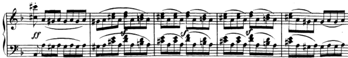
Slika 10. Završni dio provedbe – zastoje na dominantni

Most je u provedbi u početku doslovno transponiran u fis-mol, a zatim se stvari mijenjaju u 113. taktu kada skladatelj koristi istu fakturu, ali mijenja akorde i harmonijski plan (tipični postupak u razradbenim dijelovima sonata). Tako ćemo se sada susreti s nizom zanimljivih akorada kojima će se ostvariti rast gradacije i napetosti! Nakon subdominante fis-mola u 113. taktu slijedi napuljski sekstakord (H-D-G) koji je razriješen u C-dur akord, a on je pak kromatskom tercnom vezom spojen s dominantnim sekstakordom d-mola (t. 119) koji se rješava u tonički kvintakord (t. 121) te je na taj način modulirano u osnovni d-mol. Nakon toga slijedi polovična kadenca s frigijskom kadencom (t. 126-128) koja će dovesti do dominante.