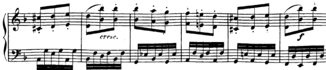
Slika 91. Izmjene staccato i legato oktava u desnoj ruci

ruku posebno kojim ćemo naviknuti uho da slušno zapamti gdje su oktave vezane, a gdje ne, te da kasnije lakše slušno diferencira jednu od druge ruke. Kod legato oktava najbitnije je pripaziti da su dvije oktave slušno čim vezanije.