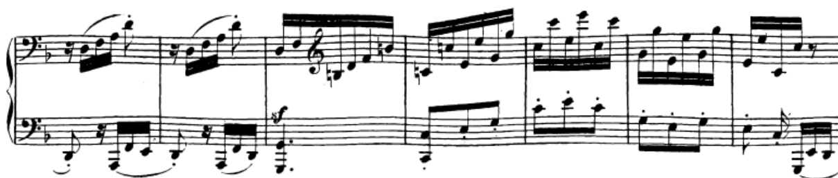
Slika 69. Most trećeg stavka

razloženim akordima. Rečenica je građena po principu 4+4 – prva njena fraza kadencira polovično, a druga autentično. Na to se nastavlja nova rečenica (t. 9-16) koja je motivima i fakturom identična, te zadržava ritamski puls u šesnaestinkama. U njoj skladatelj koristi i akorde sa subdominantnom funkcijom (kvintakord četvrtog stupnja i napuljski sekstakord). Ta se rečenica nakon toga doslovno ponavlja, a prilikom završne autentične kadence na kraju njenog ponavljanja iznenada se javlja motiv oktave u desnoj ruci (t. 22) nakon koje slijedi kromatska skala do tonike. Zatim se ponovno koriste tri takta uzeta iz prethodne rečenice (t. 25-27) za čim će ponovno uslijediti motiv oktave i kromatski niz transponirani za kvartu više, koji će dovesti do dominantne harmonije. Slijede dva takta kadence s motivima iz rečenica gdje se na kadencu izravno (bez stanke) nadovezuje most.