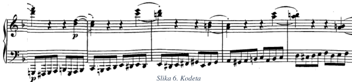
Slika 6. Kodeta

Kodeta (t. 69) je u početku građena tako da dionica lijeve ruke donosi pasaže u osminkama, dok desna krajem svakog takta svira dvije terce pod lukom u četvrtinkama. U stvari se radi o kraćoj sekvenci koja započinje spomenutom sekundarnom dominantom za treći stupanj (t. 69-70) i njenim rješenjem, nakon koje slijede dominantna i tonika a-mola (71.-72.), te potvrda tonaliteta mješovitom kadencom u 73. i 74. taktu.