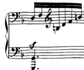
Slika 86. Rastvorba u mostu

Rastvorbe. Javlja se velika rastvorba akorda u 34. taktu (most; slika 85) i u sukladnim taktovima u reprizi i to samo u desnoj ruci dok lijeva drži dvohvat u oktavi. Kod rastvorbi je promjena položaja znatno teža nego kod skala jer su u pitanju veći rasponi između tonova. Potrebna nam je veća brzina i aktivnost ruke i palca. Dobro je rastvorbe vježbati akcentima na tonove koji nisu prvi ton novog položaja – naprotiv, njega treba naučiti što manje akcentirati tako da bi cijela rastvorba glatko tekla. Osim toga, posljednja tri takta skladbe su rastvorba toničkog kvintakorda koja se pretače iz desne u lijevu ruku. Ovisno o tome kako se podijeli u dvije ruke može, a i ne mora imati premetanja ruke i podmetanja palca. Možda je najbolja varijanta svirati posljednja tri takta tako da najprije u prvom taktu od navedenih desna ruka svira u položaju do tona