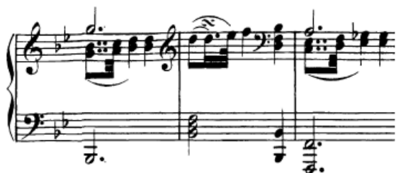
Slika 61. Dvostruko punktirani ritam u tercama

Nova rečenica, koja je u biti varirana prva, obogaćena je novim, srednjim glasom, koji donosi melodiju u tercama koje treba istaknuti kao novi materijal. Dvostruko punktirani ritam koji se javlja mora