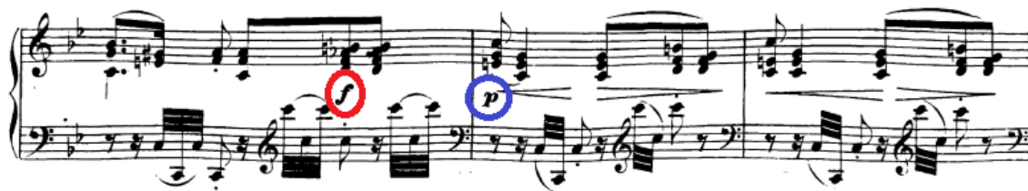
Slika 63. Vođenje dinamike krajem mosta

Do 26. takta ponovno valja voditi frazu u crescendo do fortea tako da lakše napravimo kontrast koji slijedi pri prijelazu na subito piano (27. takt). Tada trebamo pratiti male i dinamičke valove koji su naznačeni.