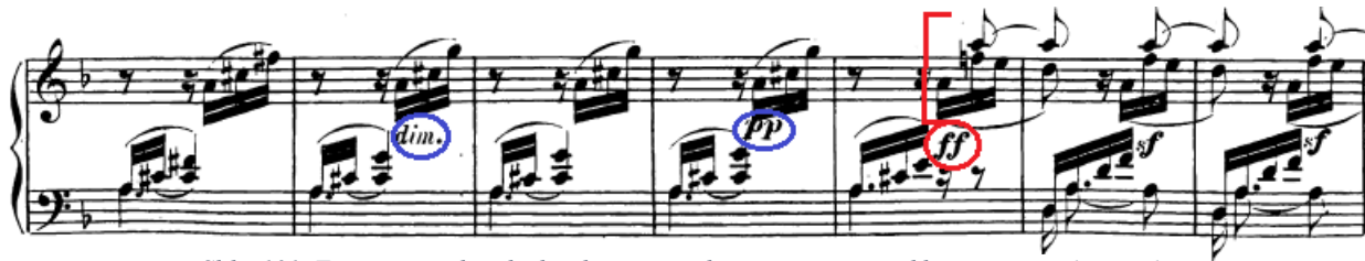
Slika 101. Fortissimo subito kod zadnjeg ponavljanja prve teme je ključan trenutak u stavku

Novi dio javlja se tek u drugoj provedbi (t. 328) koja je u pravilu cijela prilično tiha s manjim valovima u dinamici kako je naznačeno (crescenda i decrescenda). Čak niti zastoj na dominantni neće voditi do crescenda, već će se smiriti u pianissimo (t. 350) tako da bi se mogao napraviti glavni kontrast u fortissimo kad krene druga repriza s dodanim ležećim tonom u diskantu (t. 352).