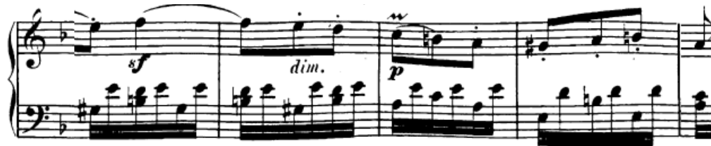
Slika 82. Položajne figure u lijevoj ruci (druga tema)

glatkoći promjene tako da bude nečujna i s minimalno pokreta. Ovdje se radi o premetanju ruke. Vježba se na način da posljednji ton pozicije držimo palcem (kako je i zapisano u partituri), a zatim vježbamo na premetanju ruke svirajući naizmjenice predzadnji ton prve pozicije i prvi ton iduće.