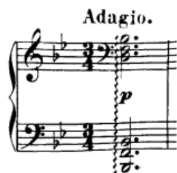
Slika 51. Arpeggio akord

ostvarivanju legata kod vezivanja dvohvata. Želimo dobiti na neovisnosti prstiju, pa je dobro vježbati gornje tonove legato, a donje staccato, pa zamijeniti. Prsti moraju biti dovoljno samostalni da se dionice mogu odsvirati u različitim dinamikama, pa je dobro tako i vježbati (jedan glas forte, drugi piano).