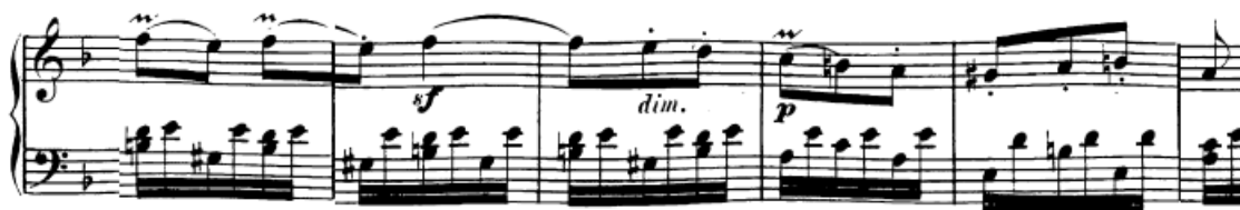
Slika 70. Druga tema

Most (t. 31) je građen razrađivanjem motiva prve teme. Šesnaestinski puls i motivi dalje ostaju. U 34. taktu dolazi do dijatonske modulacije u C-dur (tonika d-mola postaje supertonika C-dura) nakon čega se on potvrđuje autentičnom kadencom. Tada se na toničkom kvintakordu javlja novi materijal građen od rastavljenih oktava temeljenima na razloženom akordu (t. 35). Nakon te male četverotaktne rečenice ponovno se vraća prijašnja faktura nakon koje slijedi kromatska modulacija pomoću talijanskog sekstakorda (sekstakordu drugog stupnja u C-duru povisuje se seksta čime dobivamo povećani sekstakord s funkcijom dominantine dominante u a-molu).