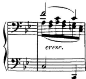
Slika 50. Višeglasje u jednoj ruci

Dvohvati legato i višeglasje u jednoj ruci dvije su vrste tehnike koje često dolaze 'u kompletu'. Primjerice, u sedmom taktu obje ruke imaju dvohvate kod kojih je svaki ton dvohvata zasebni glas. Iako se ne radi o složenoj polifoniji, svakako je riječ o višeglasju koje je najbitnije prepoznati,