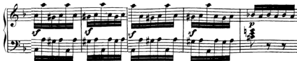
Slika 98. Ostvarivanjem naznačenih sforzata postiže se zanimljiv efekt

može pratiti crescendo fraze kako je zapisano, što će uvelike pomoći ostvarivanju takve dinamike i u desnoj ruci. Figuracije s izmjeničnim tonom i oktavom (t. 87-90) imaju naznačena sforzata na određenim mjestima koja izuzetno efektno zvuče ako se tako odsviraju. Na tom mjestu pedal treba smanjiti tako da se sforzata mogu jasno ostvariti.