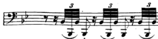
Slika 62. Tremolo motiv u mostu

Motiv tremolo oktava u triolama koji sam već više puta do sada spomenuo vrlo je karakterističan i doprinosi oživljavanju cijelog stavka. Osnovni preduvjet da bismo tu karakterističnost mogli i pijanistički ostvariti je tehnička izigranost i izvježbanost toga motiva. Kad to postignemo, uz rad na olakšavanju tog motiva (tako da zvuči kao mali kolibrić koji se lagano a brzo odbija od zraka), moći ćemo te motive doživljavati kao