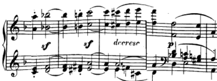
Slika 20. Oktave u desnoj ruci i višeglasje u lijevoj ruci

Dvohvati legato su najčešće miješani uz višeglasje u jednoj ruci . Recimo, prije kodete u 56. taktu lijeva ruka ima melodiju u svojem najvišem glasu dok ostali prsti drže akord, a isto je