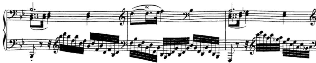
Slika 65. Prateća uloga pasaza u tridesetdruginkama

se 'nasloniti' na akord). Prije nove rečenice, u 49. taktu, ponovno imamo malu frazu kojom ćemo polovično kadencirati (odgovara onoj u 7. taktu u reprizi). I u ovom slučaju obavezno je voditi crescendo doživljavajući višeglasje koje se javlja i naglasivši appoggiaturu kao mali vrhunac. Nakon toga kreće nova rečenica s pratnjom u tridesetdruginkama koje se provlače čas u desnoj, čas u lijevoj ruci. One su tu više tehnički problem. Kad se postigne njihova izigranost, valja raditi na njihovoj lakoći, tečnosti i pratećem karakteru.