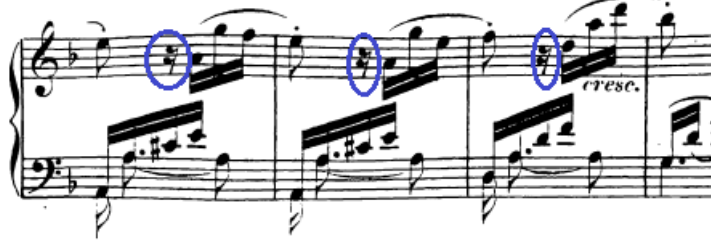
Slika 94. Doživljavanje pauza kao dahova između fraza

Što se tiče dinamike, u drugoj rečenici javljaju se se mali valovi crescendo i diminuenda (t. 8-11), a pravi crescendo koji će dovesti do fortea je na kraju rečenice u 15. taktu. Novu frazu prati i subito piano kojeg treba dobro istaknuti kontrastom.