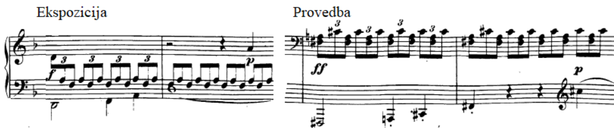
Slika 26. Usporedba tremola (tehnika rotacije) u ekspoziciji i provedbi (most)

ne radi o tremolu samo dvaju tonova kao ranije, već se izmjenjuju terca akorda (kao dvoхват) s kvintom (vidi 103. takt ili sliku 26). Najbolji način za vježbanje ovog tehničkog problema je akcentiranje u grupama po tri.