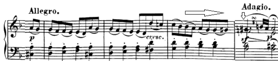
Slika 29. Crescendo i vrhunac fraze

Kod glavne fraze u prvoj temi s osminkama pod lukom (3. takt) bitno je osjetiti prvu dobu u taktu, a pritom ju malo i naglasiti (u protivnom će se posljednja doba drugog takta čuti kao teška doba, što je krivo). Cijelu frazu dobro je voditi u crescendo sve do njene polovične kadence u šestom taktu.