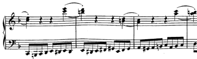
Slika 19. Dvohvati pod lukom u desnoj ruci (kodeta)

Dvohvati legato koriste se na više mjesta. U desnoj ruci u kodeti (t. 70) prisutne su dvije četvrtinke u dvohvatima pod lukom, što nije tehnički zahtjevno, no treba pripaziti da se za oba dvohvata koristi samo jedan pokret, da se dvohvat odsvira istovremeno, te da prsti ostanu aktivni. U 60. taktu desna ruka ima