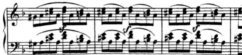
Slika 24. Polurotacija (skriveno dvoglasje) – kraj ekspozicije

Tehnika rotacije prisutna je u na više mjesta i u više oblika. Ova vrsta tehnike temelji se na sposobnosti rotacije ruke oko svoje osi. U stavku se javljaju sljedeće situacije: jednostrani udar tj. tehnika polurotacije kroz skriveno dvoglasje pred kraj provedbe (t. 129). Radi se o tome da jedan ton ostaje ležati (dominantna kao vrsta pedalnog tona ukomponiranog u fakturu) izmijenjujući se s melodijom u tercama. Treba se posvetiti isticanju melodije u tercama s obzirom na to da pedalni ton nije dio melodije, a već je sam po sebi istaknut ponavljanjem i to u obje ruke. Moguće je vježbati to isticanje tako da sviramo dvije osminke pod lukom uz naslanjanje na terce zamahom.