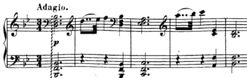
Slika 58. Pretakanje melodije iz diskanta u bas

Zbog toga već od samog početka stavka treba stvoriti mirnu, opuštajuću atmosferu, počevši već s prvim arpeggio akordom koji služi kao uvod i 'otvaranje' stavka. Glavna melodija prve teme koja slijedi skladana je na principu pitanja i odgovora pomoću izmjene diskantskog i basovskog registra. Ta dva registra diferencirana su već sama po sebi bojom koju im isti taj registar daje, no s druge strane obavezno je i doživjeti cijelu frazu kao jednu cjelinu. Naime, melodija se zapravo pretače iz diskanta u najviši glas akorda (vidi sliku). Zato trebamo slušati, doživljavati i interpretirati frazu imajući tu činjenicu na umu.