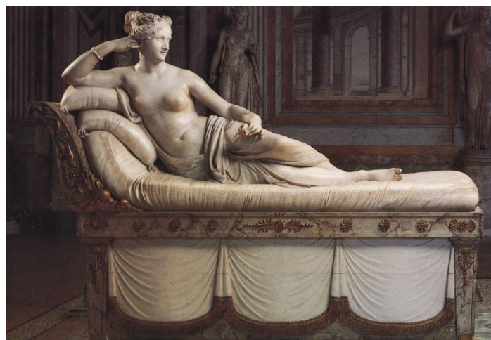
Slika 16. Pobjednička Venera, A. Canova