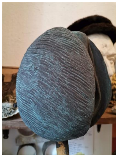
Slika 43., 44., 45. Rezultat patiniranja