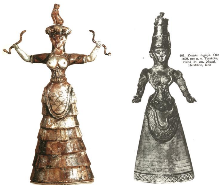
Slika 6. i 7. Gospodarica zvijeri

Preteča kulture Stare Grčke jest Egejska kultura. Jedno od poznatijih nalazišta Egejske umjetnosti je Knos koji se nalazi na sjeveru otoka Krete i smatra se da je tu procvatela prva europska civilizacija. U religijskom vjerovanju najčešće su štovali bikove, ali i božicu, zvanu Gospodaricom zvijeri. “U središtu glavne kretske religije bila je božica majka koju su štovali u svetištima i špiljama još od najranijih vremena. Često se prikazivala sa simbolima živih stvorenja, kao što su zmije, ptice ili cvijeće. U ranome razdoblju, prije 1700. pr. Kr., štovanje se odvijalo u središtima visoko na planinskim vrhovima. Darovi su se prinosili u obliku glinenih modela koji su prikazivali ono što je štovatelje zabrinjavalo. Modeli su često prikazivali dijelove tijela ili domaće životinje, a neki su imali veze s plodnošću. (...) Odnos između božice majke i bika tema je velikih polemika. Prema grčkim mitovima, Minotaur je bio hibridno čudovište, čovjek s bikovom glavom. Smatralo se da je čudovište plod žudnje kretske kraljice Pasifaje za bikom, a podrijetlo možda vuče iz minojskog kulta koji uključuje sveti brak božice majke i bika.” 7 Njihova božica tj. Gospodarica zvijeri prikazivana je kao atraktivna žena s razotkrivenim poprsjem, dok joj je ostatak tijela prekriven raskošnom slojevitom haljinom sa zmijama u obje ruke i mačkom na glavi.