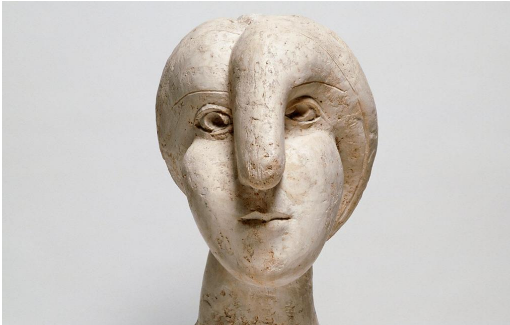
Slika 17. Marie Therese, Picasso