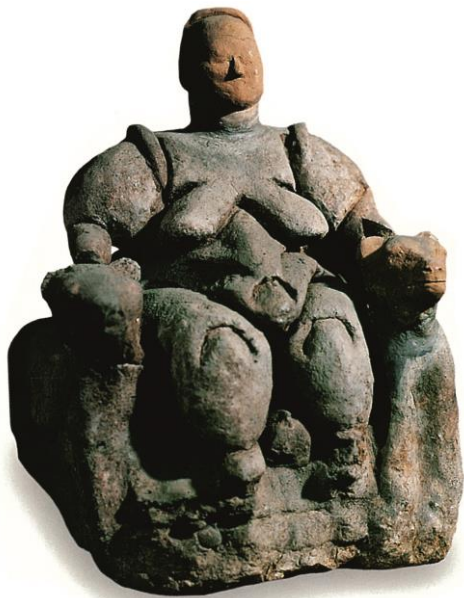
Slika 2. Božica na prijestolju

“Kipići od terakote najvjerojatnije su bili zavjetni darovi izrađeni za potrebe obreda, a poštovali su vjersku tradiciju ranijih stanovnika koji su stoljećima prije nastanka velikih gradskih središta živjeli u dolini Inda.” 4