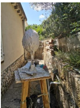
Slika 29. Nabačen gips na rad