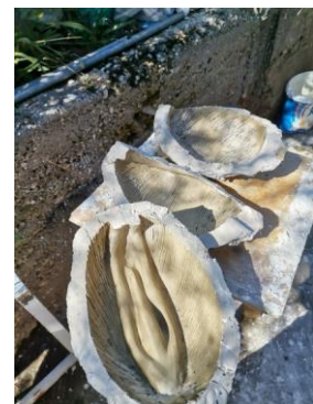
Slika 31. Kalupi