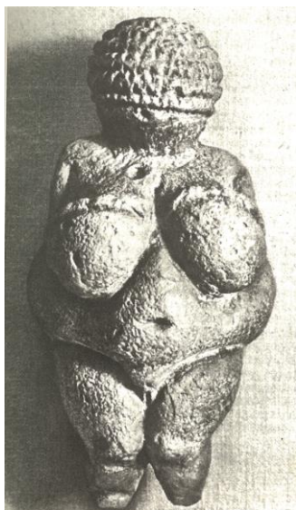
Slika 1. Venera iz Willendorfa

Moj cilj bio je dobiti skulpturu koja predstavlja Veneru u duhu postmodernizma. Težim čišćenjem forme od suvišnih detalja koje sadašnje društvo negira i osvrnućem na srž ideje; na spoj ženske spolnosti i povezanosti s prirodom.