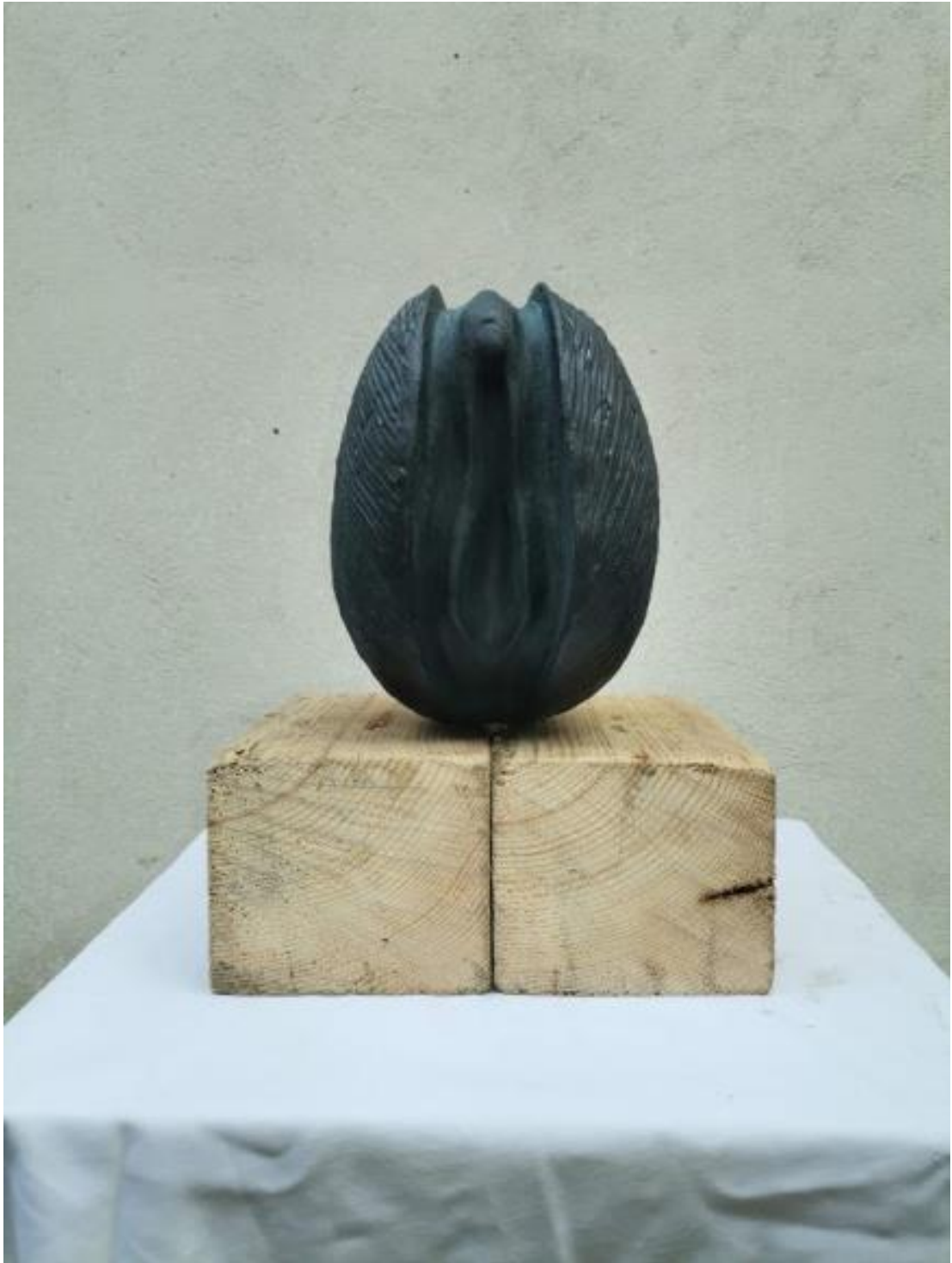
Slika 46. Gotov rad s postamentom