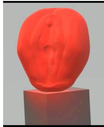
Slika 20. Skica 3D modela