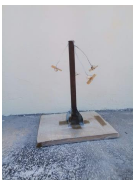
Slika 23. Metalni stalak za konstrukciju