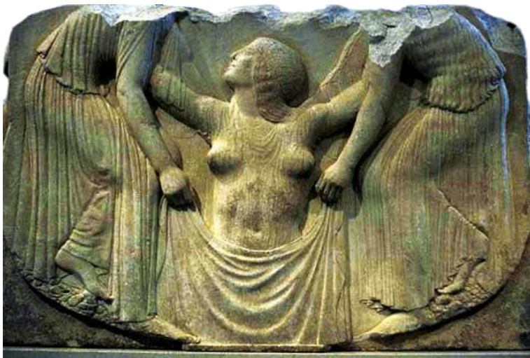
Slika 9. Rođenje Venere

prapovijesne majke božice koja će se također nastaviti razvijati kroz povijest umjetnosti. Kiparstvo Stare Grčke složenije je od predhodno navedenih naroda. Grčko kiparstvo dijelimo na dvije vrste: arhitektonsko i slobodno kiparstvo. Također ono je imalo tri klasifikacijska razdoblja: arhajsko , klasično i helenističko . U prvom razdoblju arhajsko kiparstvo imalo je snažan utjecaj na egipatsku umjetnost, što se očitovalo u stiliziranim formama, ali stvar koja je grčko kiparstvo činilo posebnijim od egipatske prikaz je realnije anatomije. Međutim, Grci su se nastavili razvijati u umjetničkom smislu i tako dolazili do savršene ravnoteže između idealizma i realizma. To razdoblje nazivamo klasičnim. Iz spomenutog razdoblja nastali su vrhunski kiparski radovi na temu Venere. Imamo primjer Trono Ludovisi, mramorno prijestolje s uklesanim reljefima s obje strane od kojih je jedan prikaz rađanja Venere. (Slika 9.) Kipovi postižu potpuni realizam što dovodi simbol Venere u čistu erotiku i užitak, gdje se simbol plodnosti pretvara u simbol žudnje i strasti. Zatim imamo helenističko kiparstvo, kiparstvo koje se razvilo van granica tadašnje Grčke, ali pod njihovim utjecajem. Tu nalazimo jedan primjer prikaza ženskoga tijela, skulpturu Nike sa Samotrake. (Slika 10.) To je prikaz boginje s krilima koja djeluje kao da vjetar puše izanj. U pitanju je skulptura koja je također najveća iz helenističkog perioda, visoka je svega 2, 4 m i danas je možemo naći u muzeju Lovreu, u Parizu.