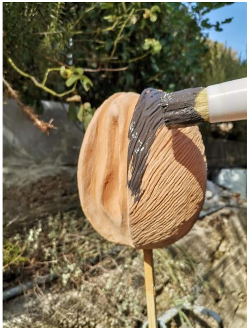
Slika 40. Početak bojanja temeljne boje

Među posljednjim sam zahvatima radila patiniranje nad samim radom. Patiniranje je proces kojim se ukrašavaju umjetnički radovi, specificiranije, to je proces mijenjanja boja i teksture na bronci ili drugim metalima, ali i drvenim površinama koje su se izmjenile pod faktorom vremena. U mojem slučaju mijenjala sam boju na terakoti da nalikuje bronci. Cilj mi je bio dobiti rad koji kopira oksidiranu bronzcu i tako zavarati promatrača o samom materijalu. Za sam početak rad od terakote sam premazala slojem crne boje za beton. (Slika 40.) Ta boja ostavila je matiranu ugušenu površinu kao idealan temelj za brončanu patinu. (Slika 41.) Nakon što se temeljna boja potpuno osušila površini sam dala skroz novi tretman. Zamutila sam zelenu, tirkiznu i azurno plavu boju u posudi s vodom i pomoću kista mazala boju od gore prema dolje na rad i istovremeno čistom vodom raspršivala boju po samoj površini rada i tako sam težila dobiti ekeft prirodne oksidacije. (Slika 42.) Rezultat tom procesu može se vidjeti na priloženim slikama i presudu o kvaliteti i uspješnsoti same patine ostavljam promatraču. (Slika 43., 44., 45.)