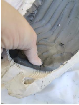
Slika 32. Prikaz utiskivanja gline u kalup