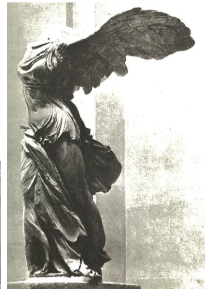
Slika 10. Nika sa Samotrake