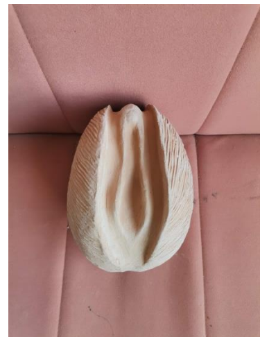
Slika 39. Rad od terakote