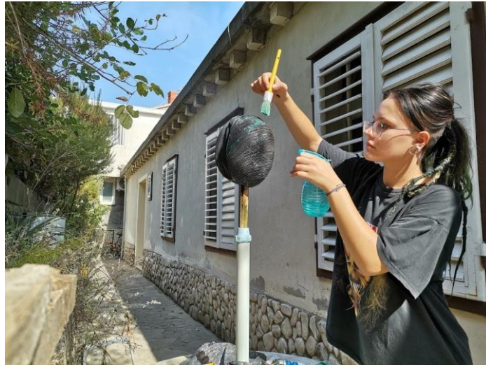
Slika 42. Proces mazanja boje po radu