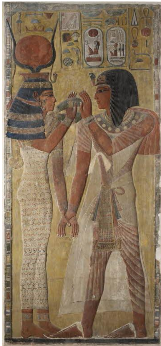
Slika 4. Doček kralja Sethosa I. u podzemlju, prikaz božice Hathor

prikazivana u haljama crvene, tirske ili kombinaciju tih dviju boja. Na glavi ima krunu oblika sunčeva diska s bikovim rogovima. Također, postoje slučajevi u kojima se predstavlja doslovnim oblikom krave sa sunčevim diskom između rogova ili u ljudskom obliku s kravljom glavom. Jedan od najlijepših primjera prikaza Hathore u umjetnosti je reljef iz grobnice Sethosa I., najveće grobnice u Dolini kraljeva. Božica je prikazana kako dočekuje kralja stižući mu ruke i pružajući ogrlicu kao simbol svoje zaštite (Slika 4.). Na ovom se primjeru može primjetiti kako je tradicionalna hijeratska kvaliteta egipatskoga crteža ublažena određenom mekoćom.