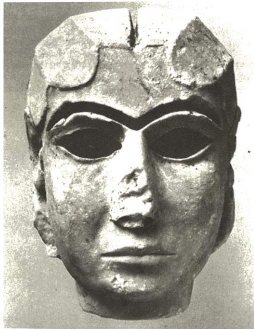
Slika 5. Ženska glava, iz Uruka

U međuvremenu, na Bliskom istoku pojavila se još jedna civilizacija u Mezopotamiji, “zemlji između rijeka”. Sumerani koji ne samo da su bili poznati po svojem klinastom pismu, već i po kiparstvu. U Uruku nađena je ženska glava od bijeloga mramora i pretpostavlja se da je u pitanju prikaz božice Inane. “Oči i obrve su prvobitno bile izvedene umetanjem raznobojnog materijala, a glava je bila pokrivena “perikom” od zlata ili bakra. Ostali dio kipa, koji je vjerojatno bio sagrađen u prirodnoj veličini, po svojoj prilici je bio od drveta. Kao umjetničko djelo, ova glava je na istoj razini kao i najljepša djela egipatskog kiparstva Starog carstva. Meko zaobljeni obrazi, fini lukovi usana, kombinirani s nepomičnim pogledom ogromnih očiju stvaraju ravnotežu između čulnosti i strogosti, dostojno svake boginje.” 6 (Slika 5.) Prema podacima iz Povijesti Umjetnosti autora H. W. Jansona u pitanju je mramorna glava visine 20 cm i datira od prije 3500.-3000. godina prije Krista. Božica Inana Sumerska je božica ljubavi, ljepote, rata, pravde, političke moći i seksa. Uruku je bilo njezino glavno kultno središte i smatrala se božicom neba. Bila je povezana s planetom Venerom i njezini simboli bili su lav i osmerokraka zvijezda. Inana se također kao i egipatska Hathor smatra pandanom grčke Afrodite.