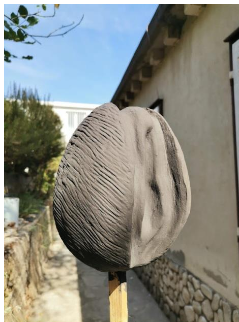
Slika 41. Rad premazan betonskom bojom