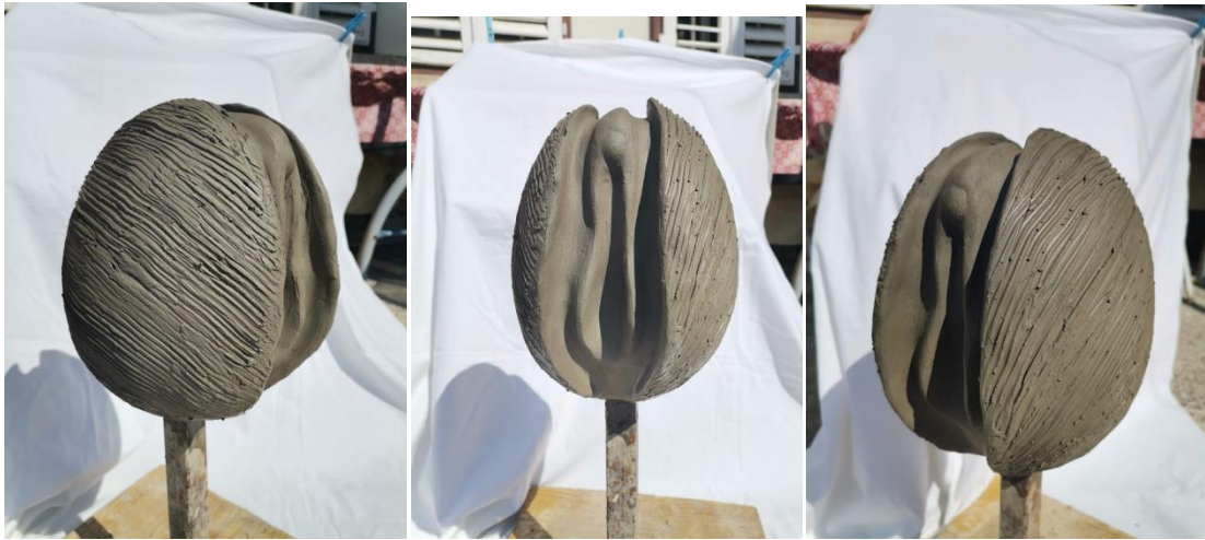
Slika 24., 25. i 26. Gotov rad u glini