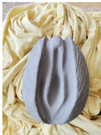
Slika 38. Osušen rad