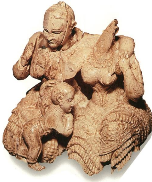
Slika 8. Majčinska ljubav

Za Egejsku kulturu uz Knos bitan je i arheološki lokalitet Mikena koja se nalazi na sjeveroistoku Peloponeza u Grčkoj. Tamo su u jednom od svetišta pronađene figurice od bjelokosti (Slika 8.). Zanimljive su po odjeći koja otkriva prsa, kakva se nosila i u minojskoj Kreti. Te se figurice smatraju među prvim prikazima božice Demetre i njene kćeri Perzefone.