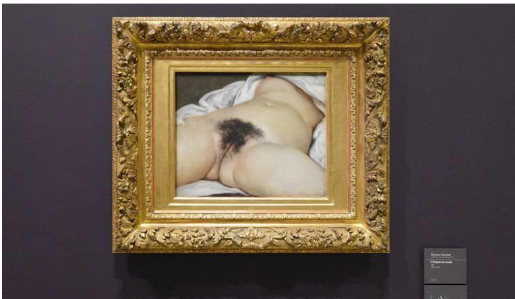
Slika 18. L'Origine du monde, Courbet