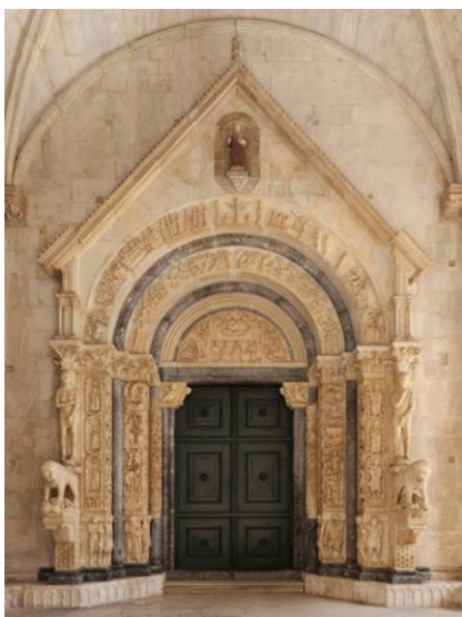
Slika 13. Radovanov portal

„Uloga Venere u srednjem vijeku za razliku od antičke Venere dovelo ju je do sveprisutne ikonografije božice kao erotske golotinje, čija je prisutnost uzbuđivala ljude. Sama po sebi je bila erotski nasljednik i provocirala je druge na seksualne činove. Iako je formalno štovanje božice sigurno palo u kasnom rimskom razdoblju, zanimanje za teme ljubavi i plodnosti koje je predstavljala nije nestalo, a njezina gola figura i dalje je služila kao metafora za seksualne veze, posebno u svadbenom kontekstu. Pjesme rađanja za vjenčanja i poganskih i kršćanskih parova predstavljale su Veneru kao središnji lik; njezina je bitna erotika bila dosljedno podcrtana opisima božice kao gole, nevezane kose. (...) U kršćanskom epitelamiju Magnusa Felixa Ennodiusa početkom šestog stoljeća, Venera je stajala gola na kamenčićima hladnog mora, s kosom koja se vijorila oko nje, izazivajući erotske nagone kod mladoženja i sprječavajući „frigidno djevičanstvo“ da dominira njegovim odnosom sa svojom mladenkom. Venera je djelovala kao zavodljiva figura i u poganskoj i u kršćanskoj epilamiji, ne samo da simbolizira vjenčanje, već i da potakne odgovarajuće emocionalne (dnosno senzualne) odgovore na događaj.“ 11