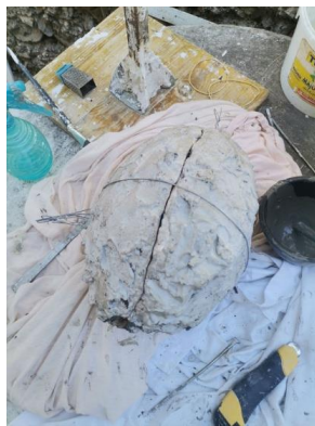
Slika 35. Spojeni kalupi