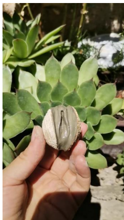
Slika 21. Skica od školjke i gline