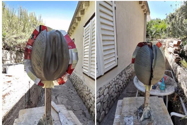
Slika 27. i 28. Prikaz na lemiće prije lijevanja