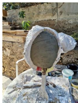
Slika 30. Dizanje kalupa s rada