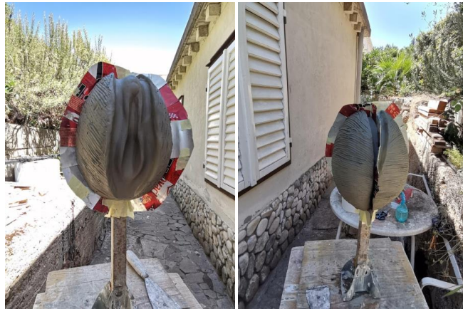
Slika 27. i 28. Prikaz na lemiće prije lijevanja