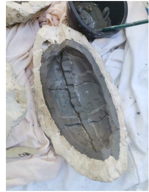
Slika 34. Glineni „mostići“