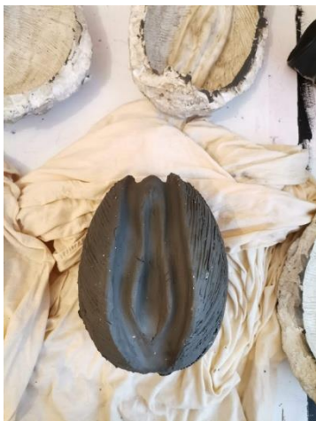
Slika 37. Rad izvađen iz kalupa, prije retuša