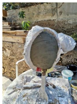
Slika 30. Dizanje kalupa s rada