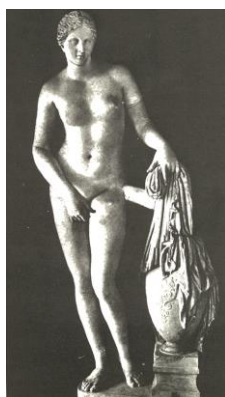
Slika 11. Afrodita Knidanska