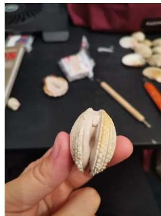
Slika 22. Skica od školjke i FIMO mase