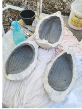
Slika 33. Otkvečana glina u kalupima