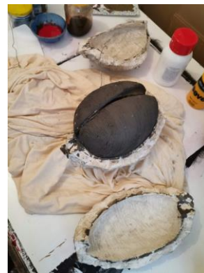
Slika 36. Dizanje kalupa