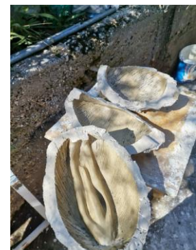
Slika 31. Kalupi