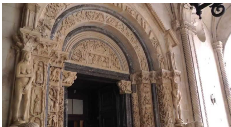
Slika 14. Radovanov portal (detalj Eve na lijevoj strani)