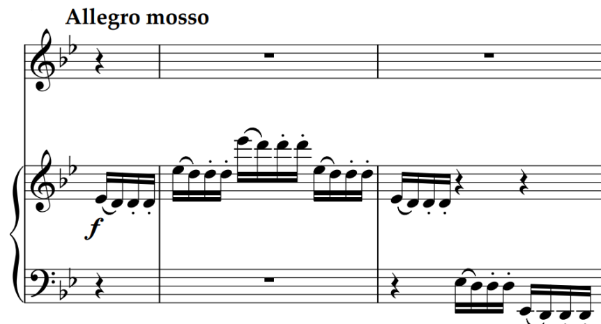
Slika 148 – t. 25-27 (izvornik)

Nije teško zaključiti da spomenuta struktura priprema novi sadržaj.