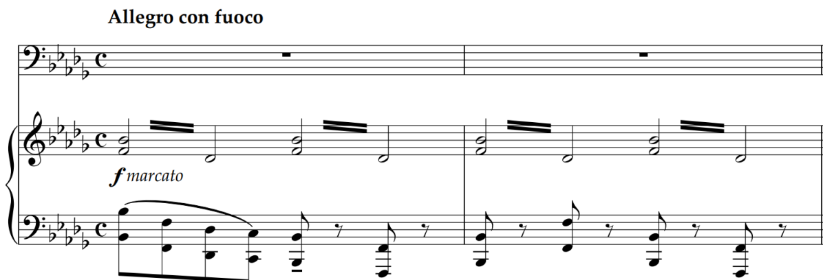
Slika 1 – Uvod (izvornik)

Već spomenuti tonalitet b-mola zadržan je i u aranžmanu za zbor jer su glasovi u optimalnim registrima. Tempo je Allegro con fuoco što je ipak brzo i tehnički neizvedivo za kvalitetnu zborsku izvedbu- svi glasovi kasnije donose tekst i teže je pjevati čiste intonativne skokove u melodiji brzog tempa. Klavirskoj pratnji je taj postupak izvediv i efektan- na početku (uvodu) popijevke nastupa brza i skokovita melodija u donjem glasu: