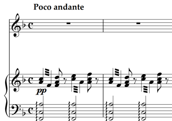
Slika 36 – t. 1-2 (izvornik)

Zadržan je izvorni tonalitet- F- dur- jer su glasovi u optimalnim registrima. Oznaka tempa je Poco andante a dinamika pp . Skladba započinje klavirskim uvodom- nježnom i mekanom zvukovnom bojom istaknutom arpeggiom i tremolom: