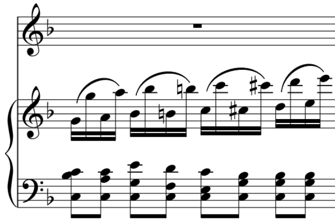
Slika 60 – t. 33 (izvornik)

Kod aranžmana je taj takt izostao radi jako koncentrirane strukture koja se ne može prenijeti u zborske dionice, i to radi dva razloga: ne može se umetnuti odgovarajući tekst i ne bi se postiglo ni približno isto djelovanje umetnutog takta na glazbeni sadržaj koji je prethodio i koji nadolazi – čak bi se stvorio kontraefekt. Umjesto toga stavljen je znak korone u svim glasovima iznad pauza na završetku prethodnog takta – na trenutak je ostavljen dojam prekida toka glazbene misli.