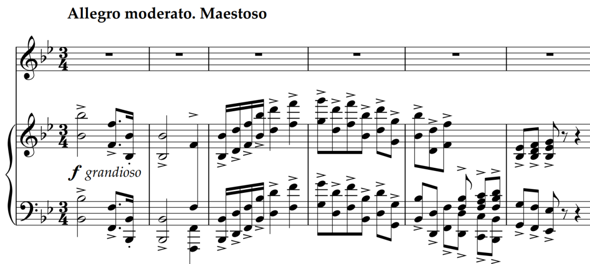
Slika 134 – t. 1-6 (izvornik)

Skladba u izvorniku započinje grandioznim klavirskim uvodom od osam i pol taktova. Akcentirajući oktavni nastupi glasova u pratnji uveličavaju svečani karakter: