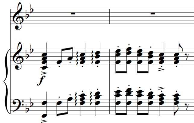
Slika 164 – t. 54-55 (izvornik)

U izvorniku ide ulomak klavirske pratnje koji donosi svečani ali strukturno različit glazbeni sadržaj – akordni sklopovi: