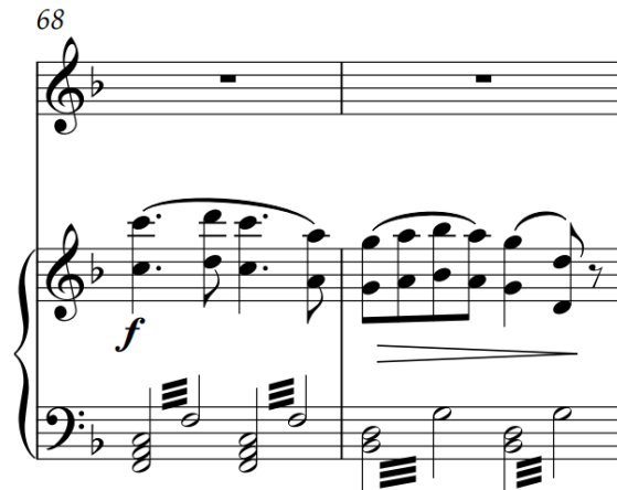
Slika 63 – t. 38-39 (izvornik)

Posljednji nastup treće teme dovodi nas do vrhunca. U izvorniku prvi dio posljednjeg nastupa teme donosi klavirska pratnja (u oktavi popraćena jakim tremolom) gradeći kulminaciju: