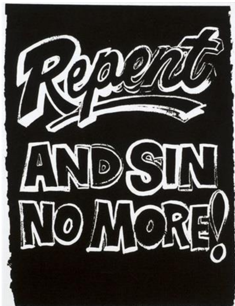
Slika 6. Andy Warhol, Repent and sin no more, akrilik i sitotisk na platnu, 1985-1986 2kom 2034 × 1781 × 33 mm, ARTIST ROOMS Tate and National Galleries of Scotland, http://www.artnet.com/artists/andy-warhol/repent-and-sin-no-more-wNwHZT_1hUWeFaA94KVtRQ2 (Pristupljeno 9.9.2022)