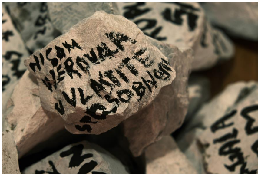
Slika 2. Jelena Tucak, Ispovijed, akrilik i kamen, 2022. 85kom, cca Ø15cm, , Ninska 20, Split, Hrvatska