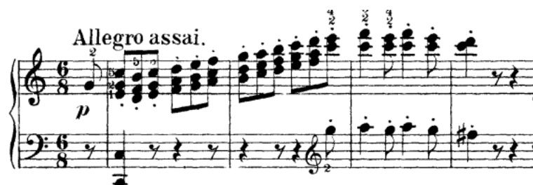
Pr. br. 13

Osnovni motiv je četverotaktan, a izgrađen je od niza akorada. Ima i karakterističan uzmah, ali on nedostaje kada se dijelovi lančano povezuju. Metarski naglasak motiva se nalazi na teškoj dobi trećeg takta, vrhuncu melodije što dijeli motiv na dva dijela. Kao u prvom stavku. Isto je i njegovo ekspozicijsko izlaganje: pitanje – odgovor.