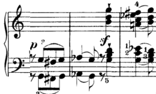
Pr. br. 11

Motiv kruženja transponiran u viši registar prilikom trotaktnog proširenja zastoja ima ulogu najave reprize. U ovim se zastojima krije i dominantni tehnički problem stavka: skokovi.