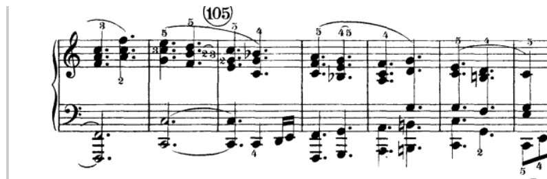
Pr. br. 15

Treća tema sazdana je od legato akorada. Melodiju čini gornji glas akorada pa mu treba pridati posebnu pažnju. Ukoliko se legato ne može realizirati, potrebno ga je zamišljati i pripomoći desnim pedalom. Prelaskom melodije u dionicu lijeve ruke, u njevoj oktavnoj verziji, za dobivanje legata od pomoći su i tihe zamjene prstiju.