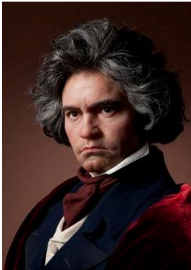
Slika 1. Kompjutorski rekonstruirana slika L. van Beethovena

Umro je u Beču 26. ožujka 1827. u 58. godini života, a uspio je steći takvu popularnost da je njegovom sprovodu prisustvovao „cijeli“ Beč.