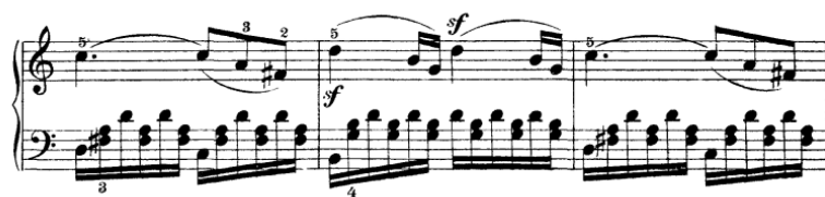
Pr. br. 14

Druga tema je vrlo sažeta. Ima svega osam taktova, nakon čega slijedi razrada materijala. Metarski model je dvotaktni motiv sa toliko karakterističnim akcentima da njihovo ispuštanje daje još veći značaj materijalu koji gradi zaključni dio ove rečenice. Uz kadencirajuću ulogu, četverotakt donosi novi motiv koji se razrađuje već u idućem javljanju razrađuje. Motiv je silaznog kretanja po akordu obogaćenog malom sekundom (bilo dijatonskom ili kromatskom) i time pogoduje nestabilnosti tonaliteta.