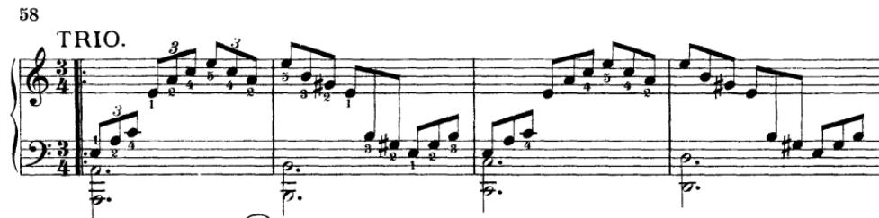
Pr. br. 12

koje se potom uvezuju u veću. Sve pozicije moraju se precizno izvoditi legato i staccato jer zbog tihe dinamike pasaži zvuče leggiero . Schnabel u svojoj interpretaciji čak stavlja oznaku molto leggiero u kadenci kad dvoglasje postaje jasnije.