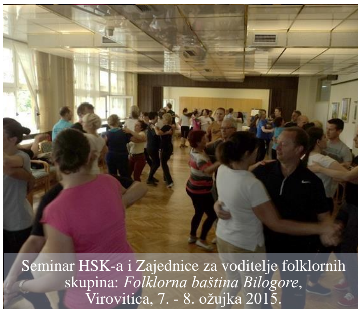
Seminar HSK-a i Zajednice za voditelje folklornih skupina: Folklorna baština Bilogore , Virovitica, 7. - 8. ožujka 2015.

Kao potporu organizaciji Seminara istaknuli su želju za školovanjem njihovih mladih članica u cilju preuzimanja mjesta voditelja „jer se mogu čuda napraviti kada dođete nekom stručnjaku u iskusne ruke“. Jedan od njih predložio je da se minimalno održe dva seminara godišnje na kojima bi se