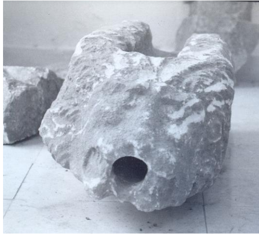
Sl.1. Rimska voriga ukrašena lavljom protomom, Omiš, Gradski muzej 7

Prikazivani su na više načina, uglavnom kao kombinacija životinja i ljudi od kojih su mnoge više humoristične nego zastrašujuće. No danas više služe kao ukras, a sve manje kao sredstvo zastrašivanja djece. Ovakvi ukraši znali su i otpadati i nanositi štetu ljudima i okolnim kućama i zgradama pa od 1724. godine London uvodi zakonsku mjeru da se na sve sljedeće novogradnje stavljaju obični vodoravni žljebovi bez ikakvih ukrasa koji bi mogli predstavljati opasnost. Osim što i danas nanose štetu zbog neočuvanosti i nedostatka financija za njihovo održavanje, u Italiji pronalazimo primjer vodoriga koji služe kao sredstvo u humanitarne svrhe. Milanska katedrala je 2012. godine ponudila na posudbu oko 135 vodoriga kako bi skupila novce koji im trebaju za čišćenje vanjskog pročelja katedrale.