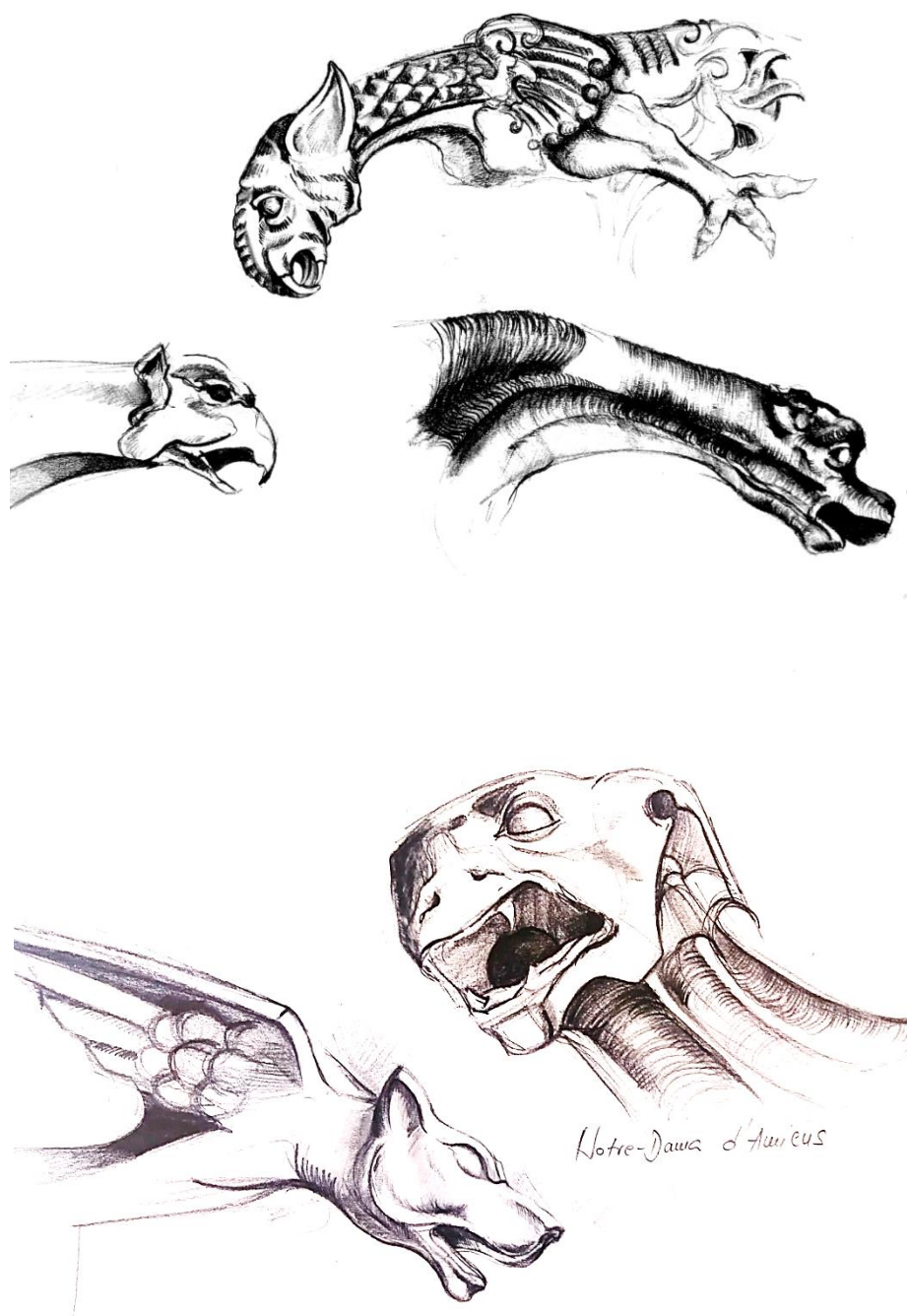
Sl.4. Skice za daljni diplomski rad