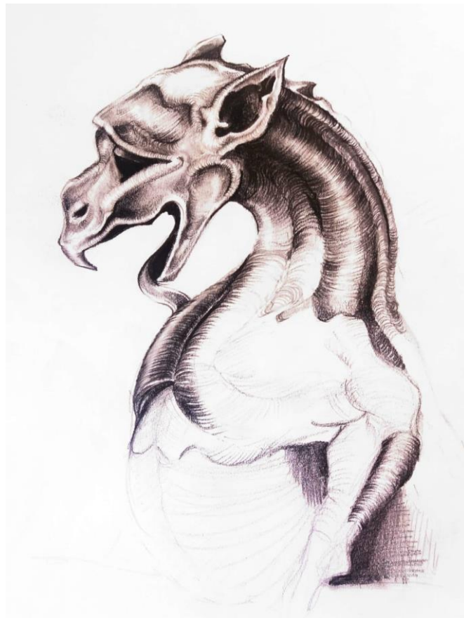
Sl.5. Odgovarajuća skica za rad na platnu (30x30cm)