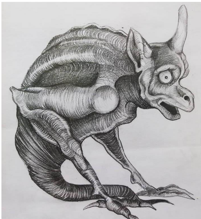
Sl.2. Vodoriga (skica)