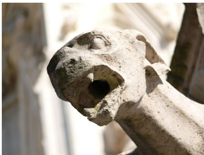
Sl.3. Vodoriga s katedrale Notre-Dame d'Amiens