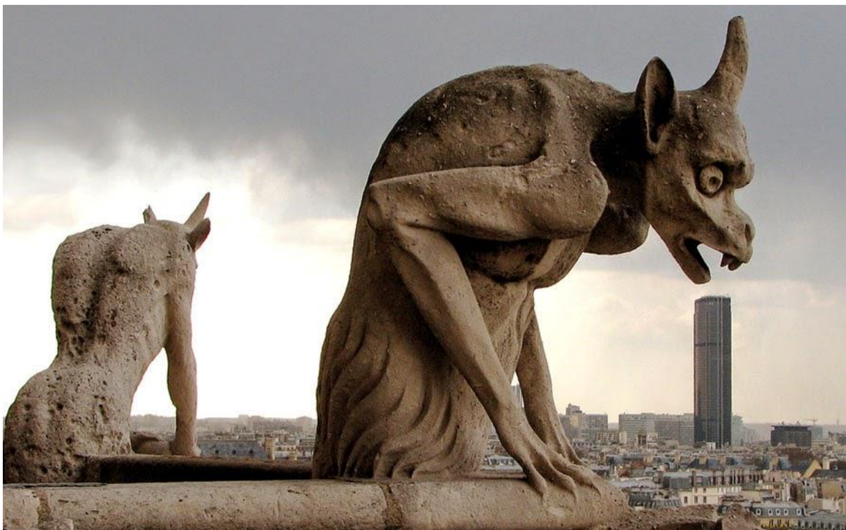
S1.2. vodorige katedrale Notre Dame, Pariz

U mom radu su dominantne vodorige glavni element cijeloga platna. Radi se od četiri zasebna platna, različitih dimenzija i kompozicija. Proučavajući vodorige poglavito na katedrali Notre Dame u Parizu, skiciram ih u detalje i tako skupljam materijal. Nakon desetak nacrtanih čudnovatih bića prebacujem ih zasebno na platno, uzimajući u obzir da se na jednom platnu nalaze po dvije vodorige. Nakon skicirane vodorige, u lazurnim nanosima akrilnih boja, tamnijih tonova, ističem njihovu građu, mišiće, to jest anatomiju. Pozadina je tamna, crna do neke granice gdje se zapravo gubi u čistini platna. Unutar iskapanih boja ili detaljno naslikanih dijelova ovih mističnih čudovišta se naziru skice, nacrtane flomasterom debljine 0.1 i 0.2, kako bih naglasila povezanost sa arhitekturom, jer kroz povijest jedno ne ide bez drugoga. Lazurno kapanje vode iz svake gargule simbolizira njihovu glavnu funkciju, a to je odvod kišnice sa krovova katedrala. Ovisno o svakom segmentu rada korišten je drugi element arhitekture, tako se negdje pojavljuju prozori, bifore i trifore, rozete, negdje portali ili čak kontraforni sustav.