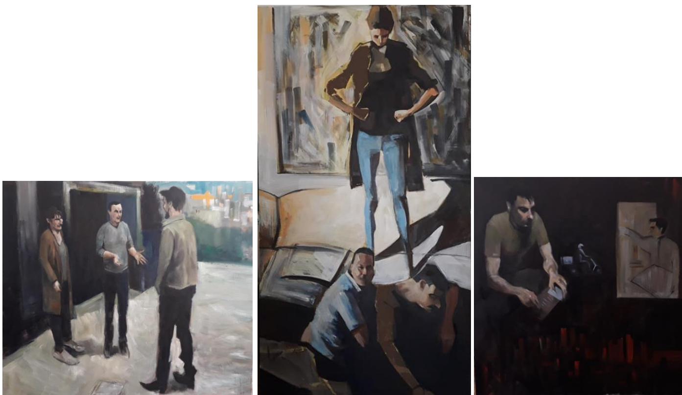
„Opterećenja”, triptih, 150x150, 205x105, 150x150cm

Istom tehnikom često sam radio kroz dosadašnje preddiplomsko obrazovanje.