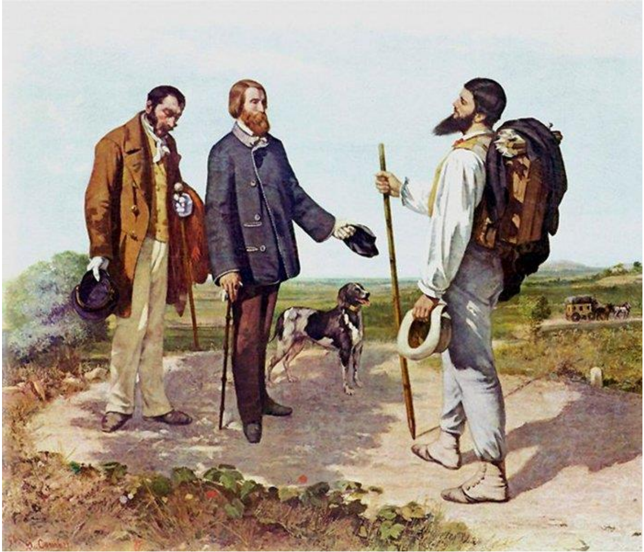
„Bonjour Mr Courbet“, 160x110 cm, ulje na platnu, 1850,

Kako bi se u konačnici odlučio reinterpretirati Gustav Courbetovo djelo, odluci je prethodilo višegodišnje promatranje autorovog opusa. Na taj sam način uočio sličnost u odabiru motiva, što me zaintrigiralo te me još uvijek intrigira.