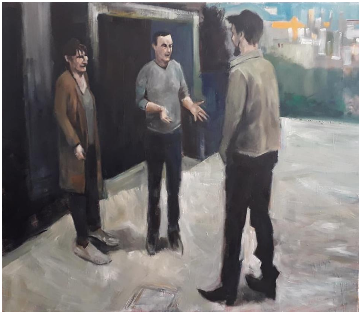
Bonjour Mr. Grubišić, 150x150cm, ulje na platnu, 2019