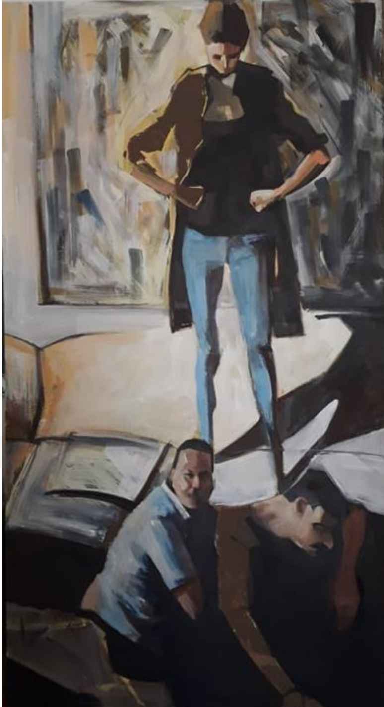
"Karlo dolazi", 205x105cm, ulje na platnu, 2019