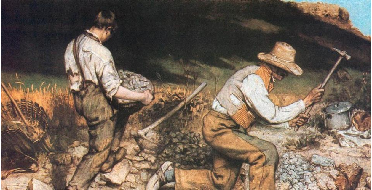
Gustav Courbet , Stonebreakers, ulje na platnu, 1849, 240x170 cm.

Kako je u prethodnom semestru na studiju naslov zadatka glasio „Stvoriti iznova“, uz Gustav Courbeta pratio sam rad američkog suvremenog figurativnog slikara Eric Fischla. Također rad iz prvog ciklusa „Karlo dolazi“ se najviše referira na Fischerovu estetiku. Čisti kontrasti,