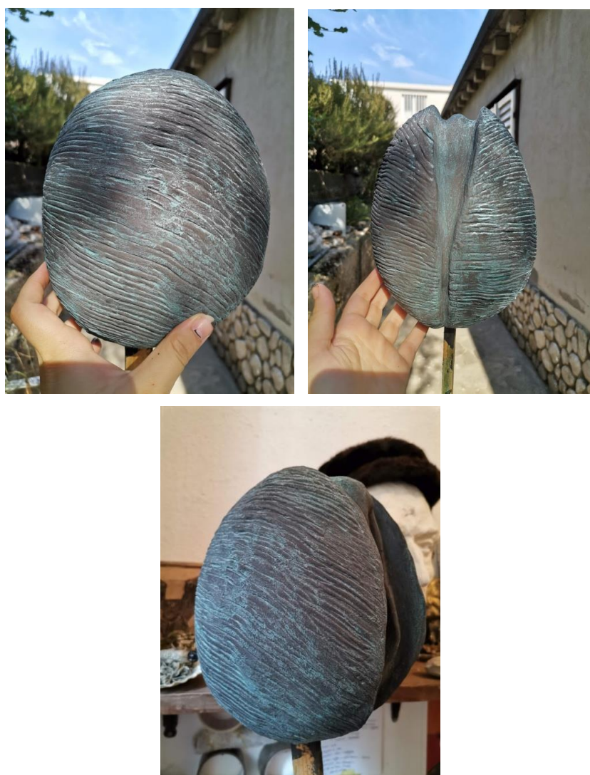
Slika 43., 44., 45. Rezultat patiniranja