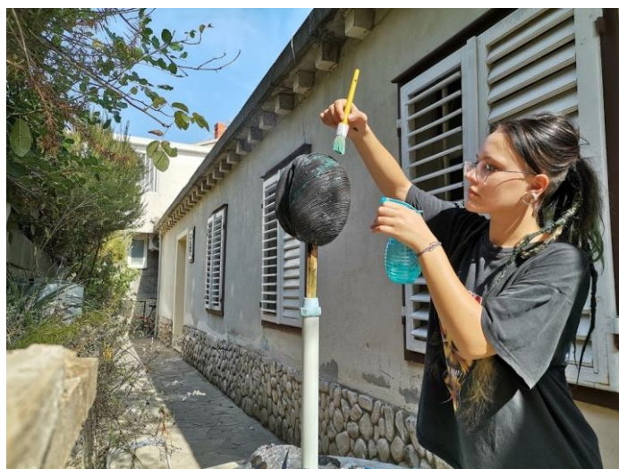
Slika 42. Proces mazanja boje po radu