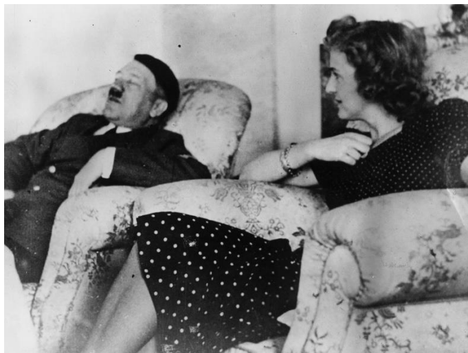
Hitlerov i Evin odnos – on drijema, ona pazi na njega