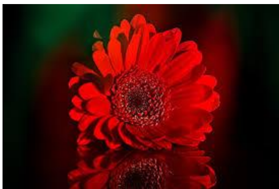
Eva kao cvijet – crveni gerber