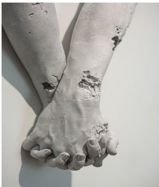
Daniel Arsham – Holding Hands