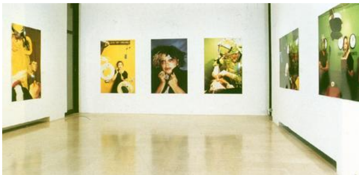
Slika 4 Orlan, Reinkarnacija svete Orlan ili slika, nove slike, izložba fotografija, 1990