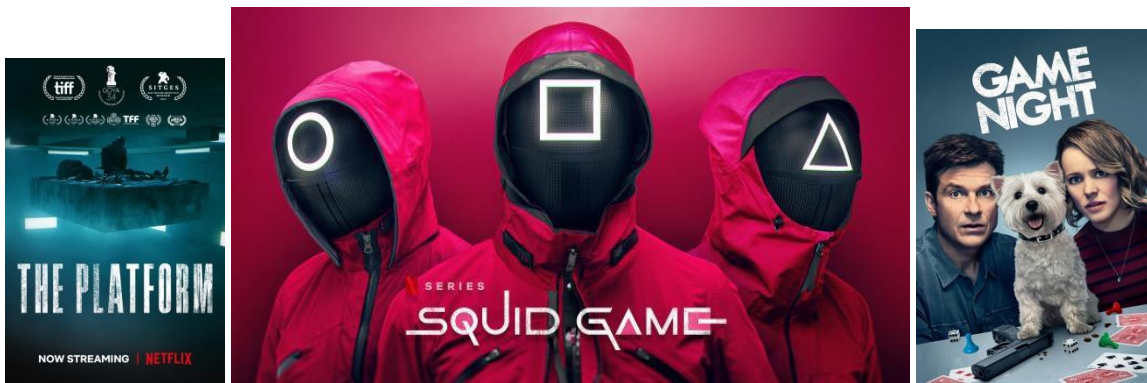
Slika 6 Slika 7 Slika 8

Saznat ćemo za zadovoljstvo u nespitanosti. Pokazat će nam probitačni performansi. Obratit će nam se kroz poznate strukture na nepovratan način, između ostalog, o mogućnostima koje smo naslućivali da u nekoj varijanti postoje kao “ono nešto” što čini remek djelo. To će biti trenutci u kojima likovi iskaču iz platna, čime god se poslužili, u “zonu” (Stalker) u kojoj će nam se približiti kao svojoj svrsi, izvoru svoje težnje iza tobožnje granice, svojem stvoritelju. Ali često, na granicama svojeg svijeta, taj lik odbacuje autore filma kao svoje stvoritelje.