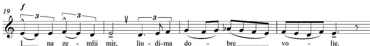
Primjer 22: t. 19-22; Tema fugata

Tema je provedena po uzoru na četveroglasni redosljed nastupa tema (četveroglasna reperkusija) u pravilnoj izmjeni imitacija na osnovnom tonu e i gornjoj kvinti h , pri čemu orgulje odebljavaju zbarske dionice. Nedostaje samostalan nastup teme u dionici alta, međutim, zajednički nastup svih zbarskih dionica u altovskom registru te stalni kontrapunkt koji je u nastavku pripao dionici alta, upućuje na to da je prvi nastup teme namijenjen upravo altu. Stoga je redosljed nastupa tema sljedeći: Svi/A ( e ) – S ( h ) – B ( e ) – T ( h ).