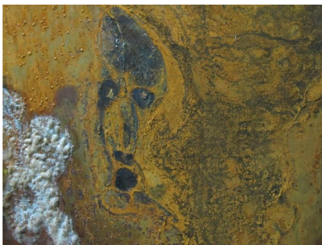
Slika 3. Detalj forme koja tvori lice

Inspirirana teksturom i oblicima koje sam uočila na pločama, odlučila sam ponovno intervenirati i kreirati dimenziju nekog novog svijeta koji se sastoji od mnoštva neobičnih oblika. Na određenim dijelovima dviju ploča, kojima je to po mojoj procjeni bilo potrebno, ponovno sam koristila hidrogen, sol i vodu kako bih dodatno pospješila nastanak hrđe. Potaknuta spontanom prepoznavanjem organskih formi, naposljetku sam koristila i uljane boje istih i/ili sličnih tonova poput same hrđe, što je rezultiralo isticanjem već postojećih oblika, figura i lica (Slika 3.). Razlog korištenja istih i/ili sličnih tonova karakterističnih za hrđu, leži u namjeri da se istaknu same forme te da se naglasi ljepota zahrđale površine. Osim toga, željela sam ostvariti kontrast između tamnih i svjetlih komponenata cjelokupne kompozicije, kako bih postigla dojam dinamičke ravnoteže te na taj način kreirala vizualnu impresiju zaustavljenog trenutka u dimenziji vremena.