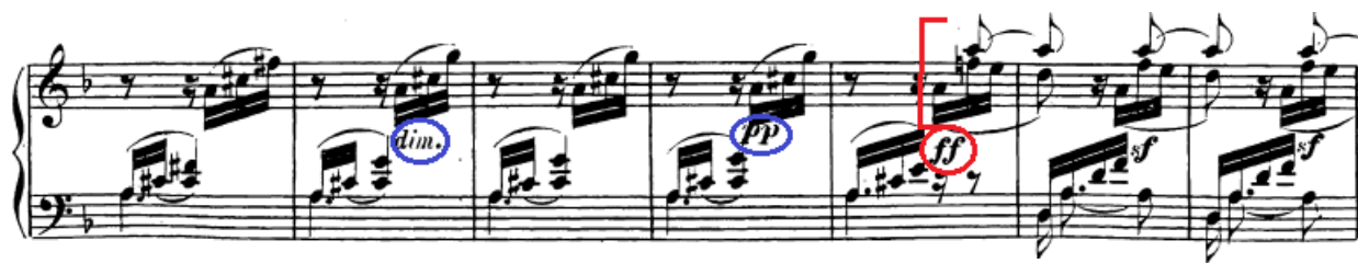
Slika 101. Fortissimo subito kod zadnjeg ponavljanja prve teme je ključan trenutak u stavku

Novi dio javlja se tek u drugoj provedbi (t. 328) koja je u pravilu cijela prilično tiha s manjim valovima u dinamici kako je naznačeno (crescenda i decrescenda). Čak niti zastoj na dominantni neće voditi do crescenda, već će se smiriti u pianissimo (t. 350) tako da bi se mogao napraviti glavni kontrast u fortissimo kad krene druga repriza s dodanim ležećim tonom u diskantu (t. 352).