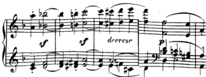
Slika 20. Oktave u desnoj ruci i višeglasje u lijevoj ruci

Dvohvati legato su najčešće miješani uz višeglasje u jednoj ruci . Recimo, prije kodete u 56. taktu lijeva ruka ima melodiju u svojem najvišem glasu dok ostali prsti drže akord, a isto je