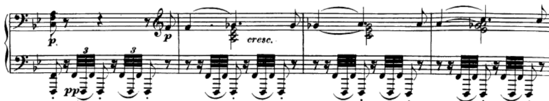
Slika 64. Rast napetosti u kodeti

Ponovna javljanja motiva iz mosta (tremolo oktave) u kodeti (38. takt) sad su u funkciji dizanja napetosti prije reprize. Smanjeni septakord koji se javlja u obratima u desnoj ruci mora biti izdržan, težak i svaki put sve glasniji s obzirom na crescendo, koji je ovdje sada još i intenzivniji s obzirom na to da je čitav taj dio u ulozi provedbe te spaja dva veća dijela forme (ekspoziciju s reprizom).