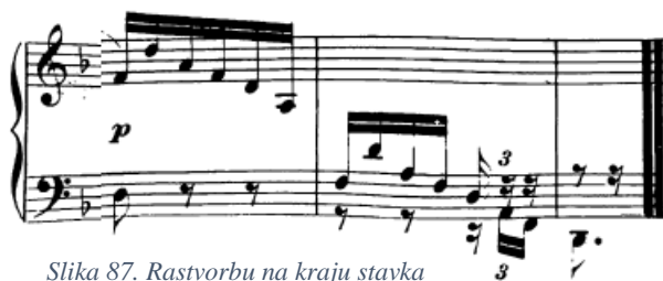
Slika 87. Rastvorbu na kraju stavka najbolje je podijeliti u dvije ruke

„d 1 “, nakon čega ton „a“ hvata lijeva ruka s obzirom na to da pripada položaju iz idućeg takta, a zatim bi posljednja tri tona u toj varijanti svirala desna ruka koja bi preskočila preko lijeve. Na taj način bi se jednostavno izbjegle neugodne promjene položaja.