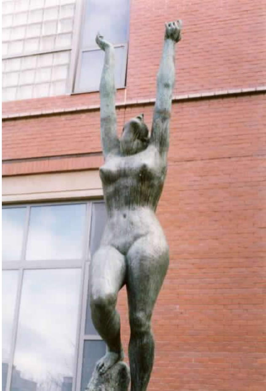
Slika 3. Ivan Meštrović, Perzefona, Perzefona, Sveučilište Syracuse, New York i Galerija Meštrović, Split 1946.