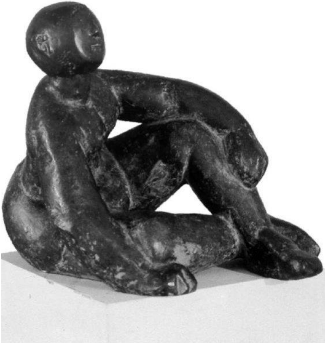
Slika 10. Kosta Angeli Radovani. Duna, Zagreb, Moderna galerija, 1963.