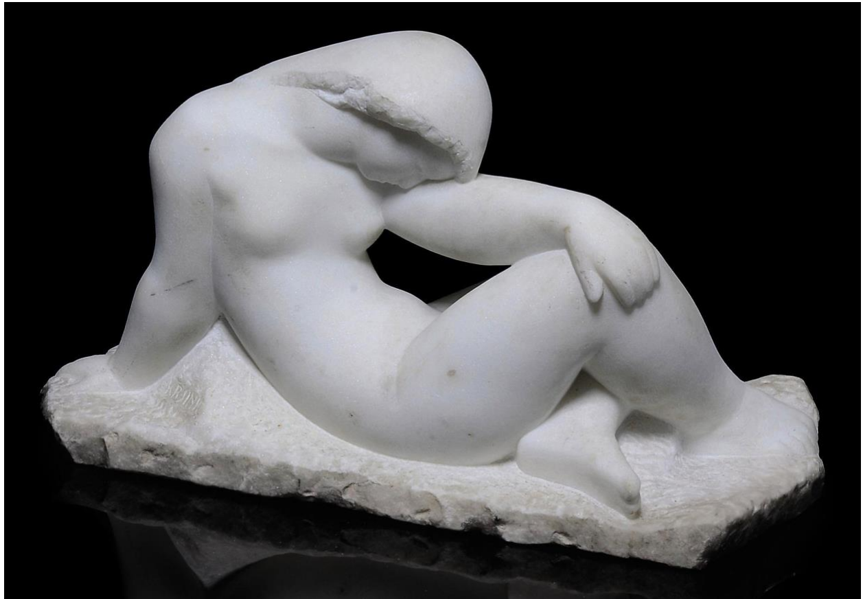
Slika 5. Frano Kršinić, Meditacija, Izveden oko 1960.