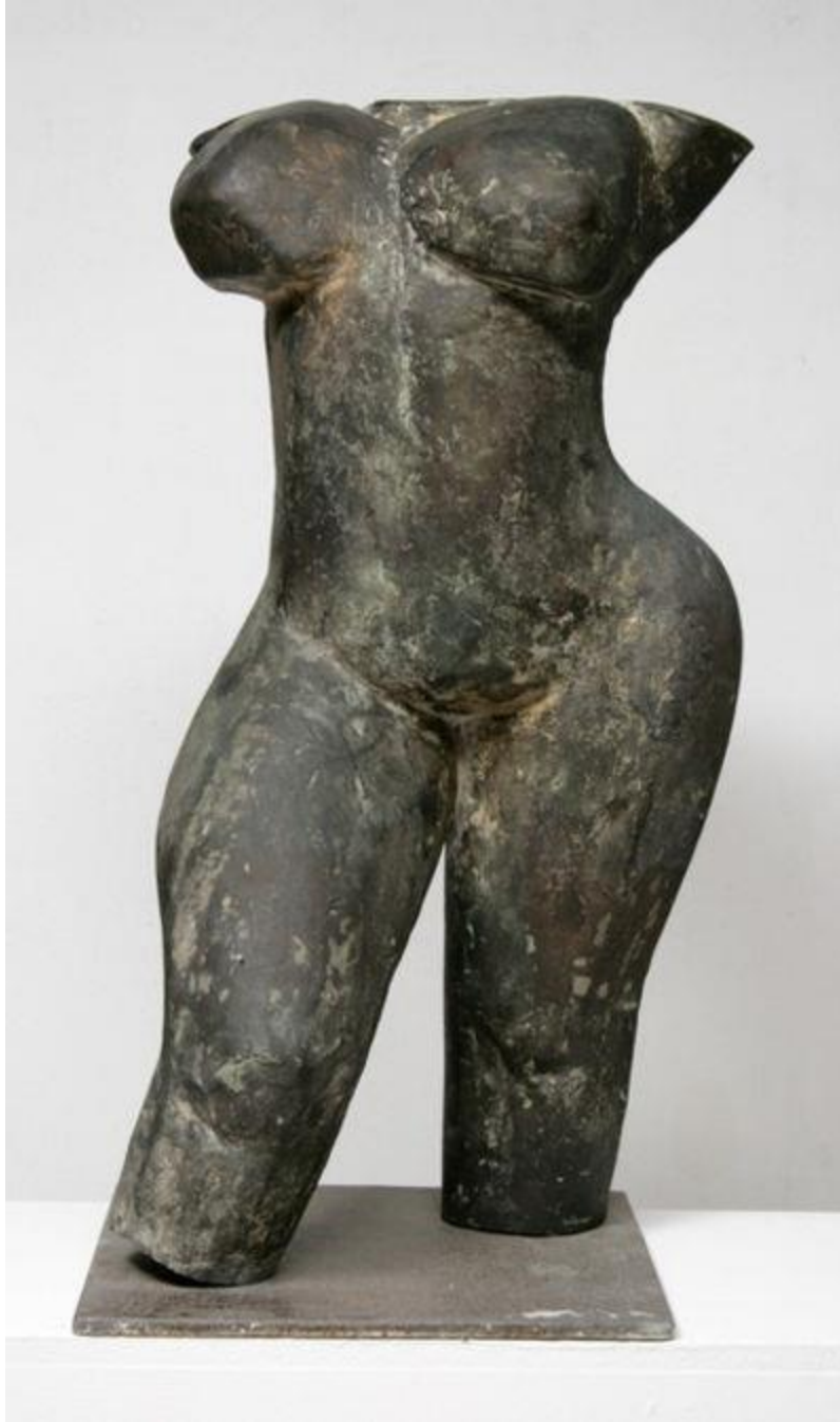
Slika 9. Kosta Angeli Radovani, Torzo, Muzej modern umjetnosti 1968.