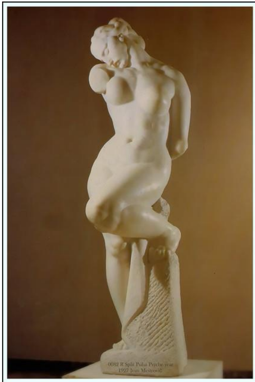
Slika 1. Ivan Meštrović, Psiha, Muzeji Ivana Meštrovića, 1927.