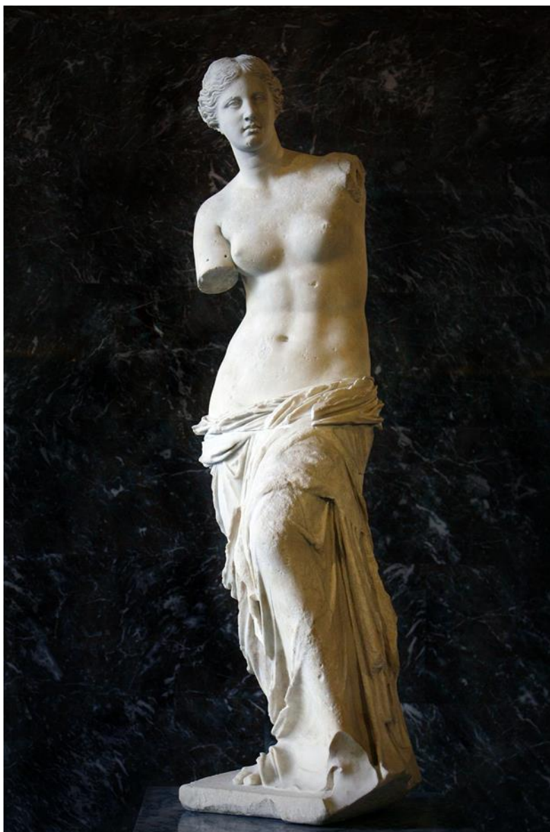
Slika 11. Alexandros of Antioch, Venera Miloska muzej Louvre, 101. pr. Kr.