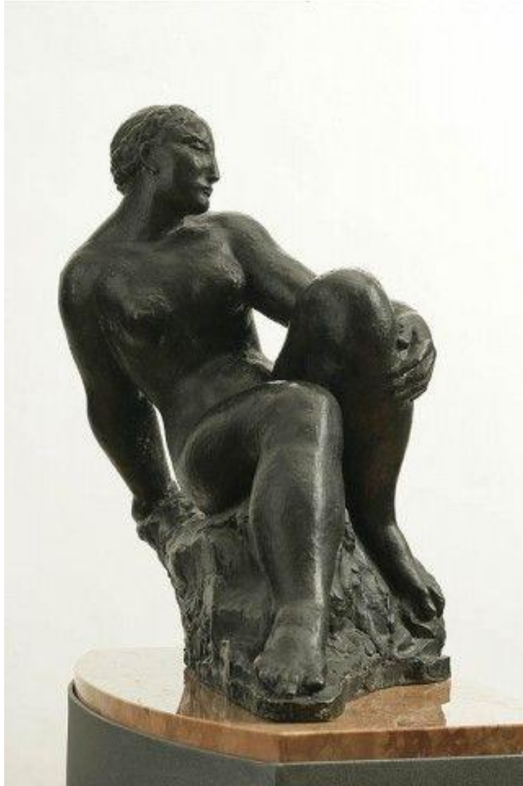
Slika 7. Ivo Lozica, Ženski akt, 1938.

Izvor: Gamulin, G., & Mirić, M. (1999). Hrvatsko kiparstvo XIX. i XX. stoljeća.