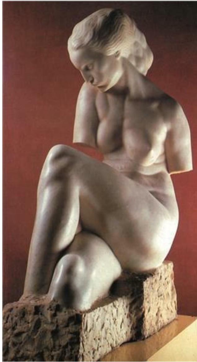
Slika 2. Ivan Meštrović, Sjećanje, Muzeji Ivana Meštrovića, 1908.

Izvor: Meštrović, M. M., Kovačić, M., & Zidić, I. (2011). Život i djelo Ivana Meštrovića. Matica Hrvatska.