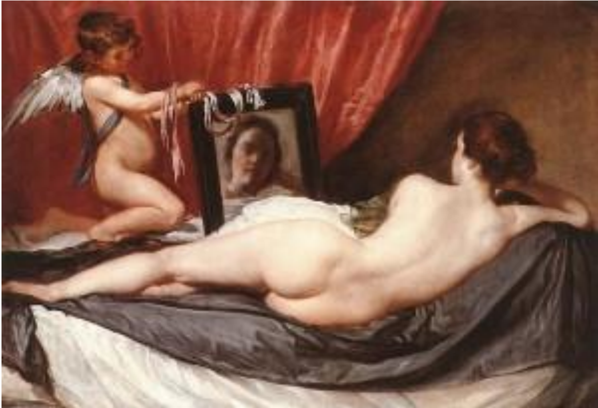
Slika 14. Venera pred ogledalom, Diego Velázquez, Nacionalna galerija, 1648.