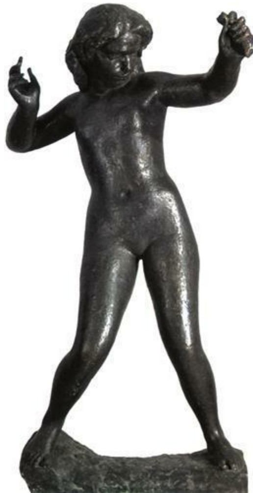
Slika 6. Frano Kršinić, Diana, Moderna galerija, 1929.