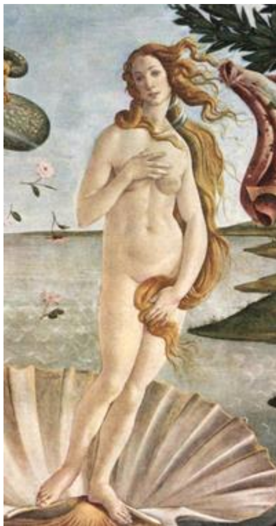
Slika 11. Sandro Botticelli: Rođenje Afrodite, Firenca, 1482.