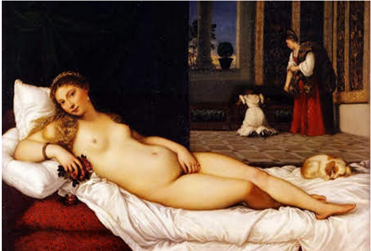
Slika 13. Tizian, Venera Urbinska, Galerija Uffizi, 1534.