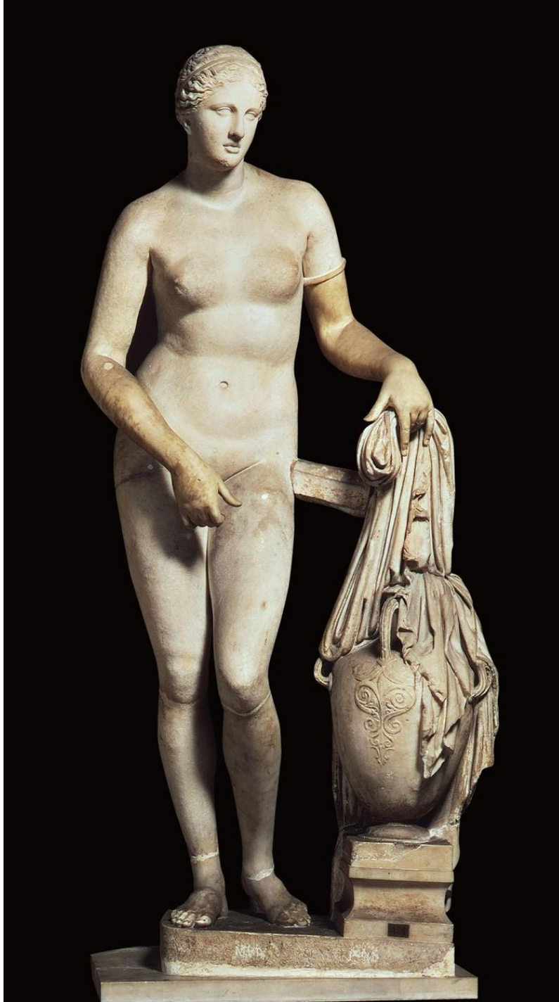
Slika 12. Praxiteles, Afrodita Knidska, 4. st. pr. Kr. Nacionalni muzej, Rim.