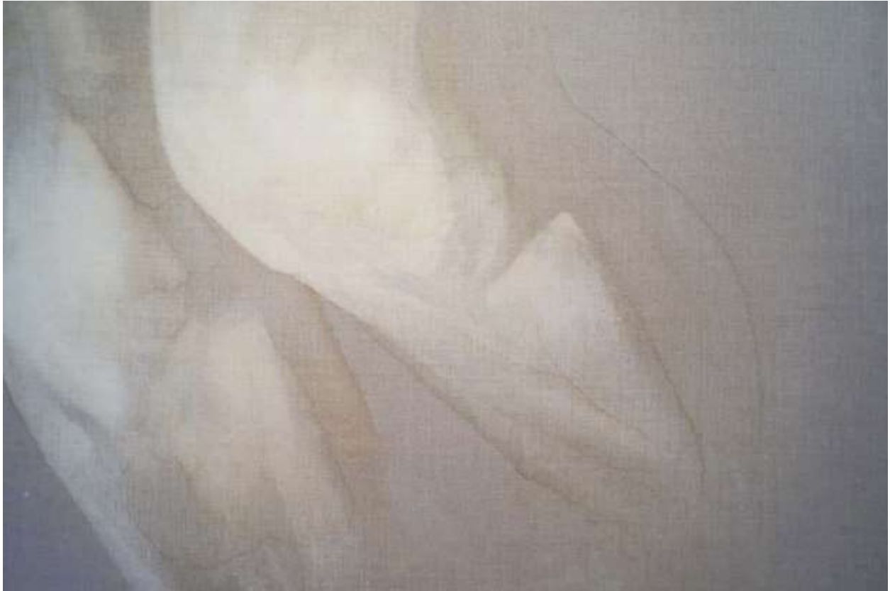
Slika 2.: Iva Martinović, koljena (iz serije rad s klorom), 2019., klor na lanenom platnu, 70 x 100 cm