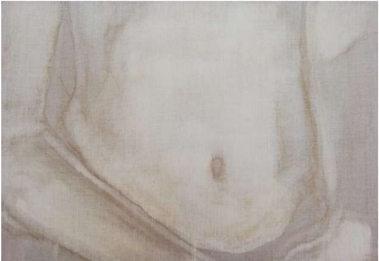
Slika 3.: Iva Martinović, trbuh (iz serije rad s klorom), 2019., klor na lanenom platnu, 70 x 100 cm