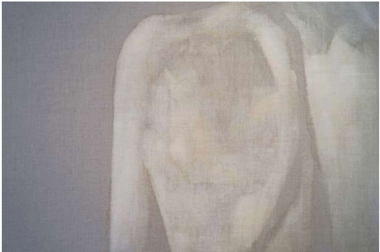
Slika 1.: Iva Martinović, leđa (iz serije rad s klorom), 2019., klor na lanenom platnu, 70 x 100 cm