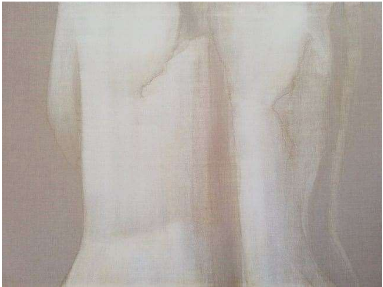
Slika 4.: Iva Martinović, cijela leđa (iz serije rad s klorom), 2019., klor na lanenom platnu, 140 x 200 cm