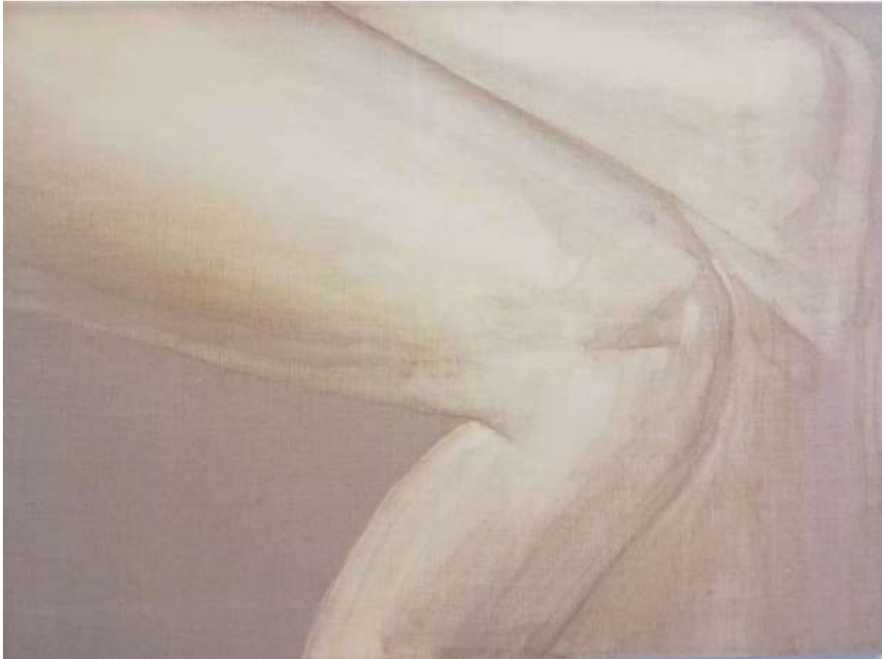
Slika 2.1.: Iva Martinović, koljena (iz serije rad s klorom), 2019., klor na lanenom platnu, 140 x 200 cm