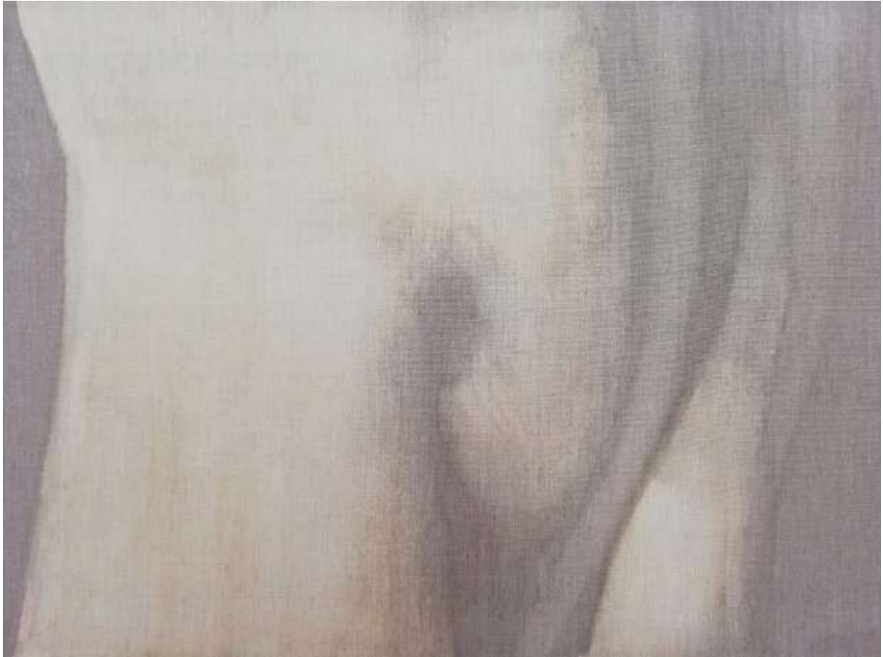
Slika 4.: Iva Martinović, trbuh i ruka (iz serije rad s klorom), 2019., klor na lanenom platnu, 70 x 100 cm