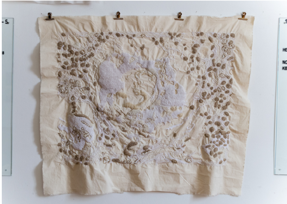
Arhiva patoloških stakalca (detalj), 2018., vez na žutici, 110 cm x 135 cm, prikaz tuberkuloze pluća, Stara gradska vijećnica, Split.