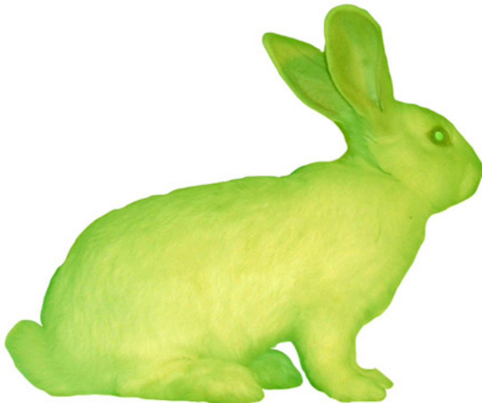
slika 5: Eduardo Kac, Alba , fluorescentna zečica, 2000.

Žive, bioinženjerski tretirane životinje u svojim radovima koristi i Eduardo Kac ( GFP Bunny ) (slika 5).