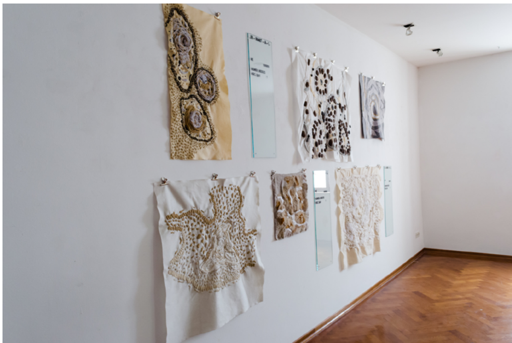
Arhiva patoloških stakalca , 2018., vez, filcana vuna na žutici, tapisonu, filcu, lanu i reteksu, stakla, dimenzije varijabilne, Stara gradska vijećnica, Split