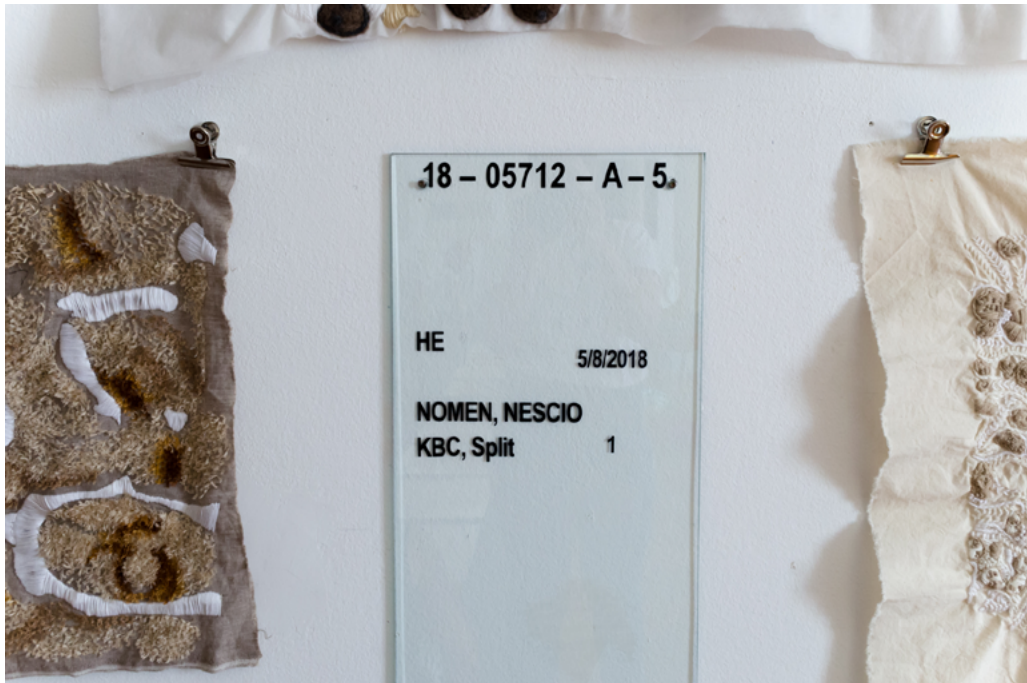
Arhiva patoloških stakalca (detalj), 2018., staklo, 90 cm x 30 cm, uvećano histološko stakalce s osnovnim podacima pacijenta, Stara gradska vijećnica, Split