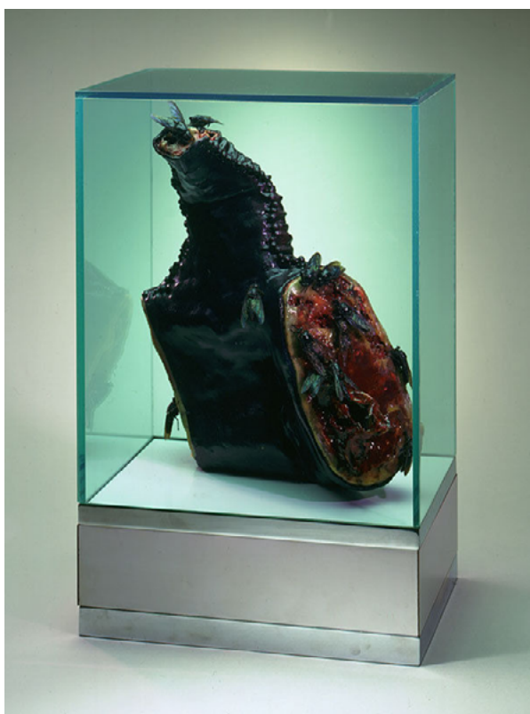
slika 2: Paul Thek, Untitled (Meat Piece with Flies) , 1965., iz serije Technological Reliquaries , drvo, melamin laminat, metal, vosak, boja, dlaka i pleksiglas, 48.3 x 30.5 x 21.6 cm, Los Angeles County Museum of Art; The Judith Rothschild Foundation © The Estate of George Paul Thek; courtesy Alexander and Bonin, New York © 2009 Museum Associates/LACMA/Art Resource, NY1

Arhiva patoloških stakalaca i radovi Paul Theka i to u ovom slučaju radovi iz serije Meat Pieces (slika 2), dijele zajedničku jasnu zazornost. Thek koristi tijelo kao “sirovi materijal”, izmjenjujući “specifične i nespecifične”, odnosno jasno razlučive dijelove tijela kao što su udovi i amorfne mase mesa koja predstavlja samu tjelesnu tvar. Te skulpture