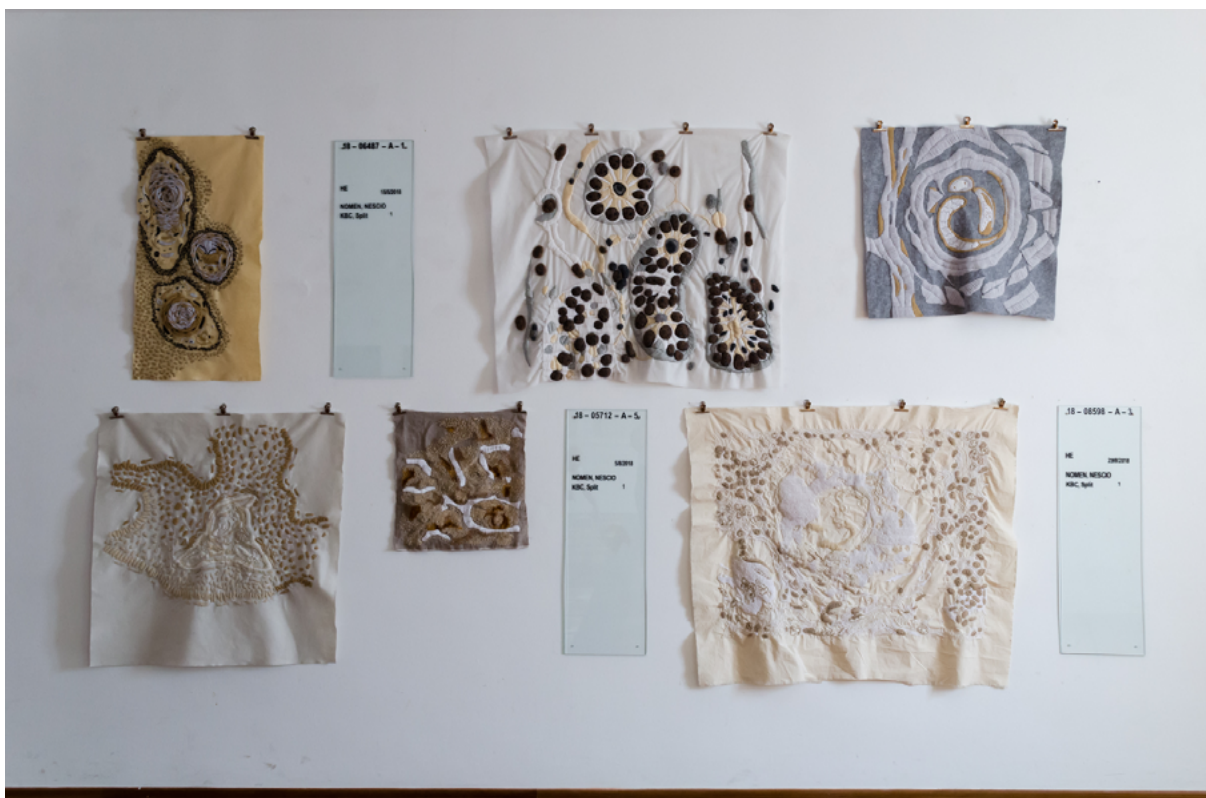
slika 1: Arhiva patoloških stakalca , 2018.

Rad Arhiva patoloških stakalaca se sastoji od šest vezenih „tapiserija“ na različitim materijalima (filcu, žutici, lanu, reteksu i tapisonu) različitih dimenzija, povećih formata, te tri stakla (svaki 30 cm x 90 cm) koja su proporcionalno uvećana sama stakalca s podacima o histološkom preparatu (kao što je datum, broj, pacijent, itd.). Različite komponente su postavljene na zid u proizvoljnoj mreži/formaciji i to tako da tekstilni dijelovi rada vise pričvršćeni pomoću hvataljki, a stakla su direktno pričvršćena na zid (slika 1).