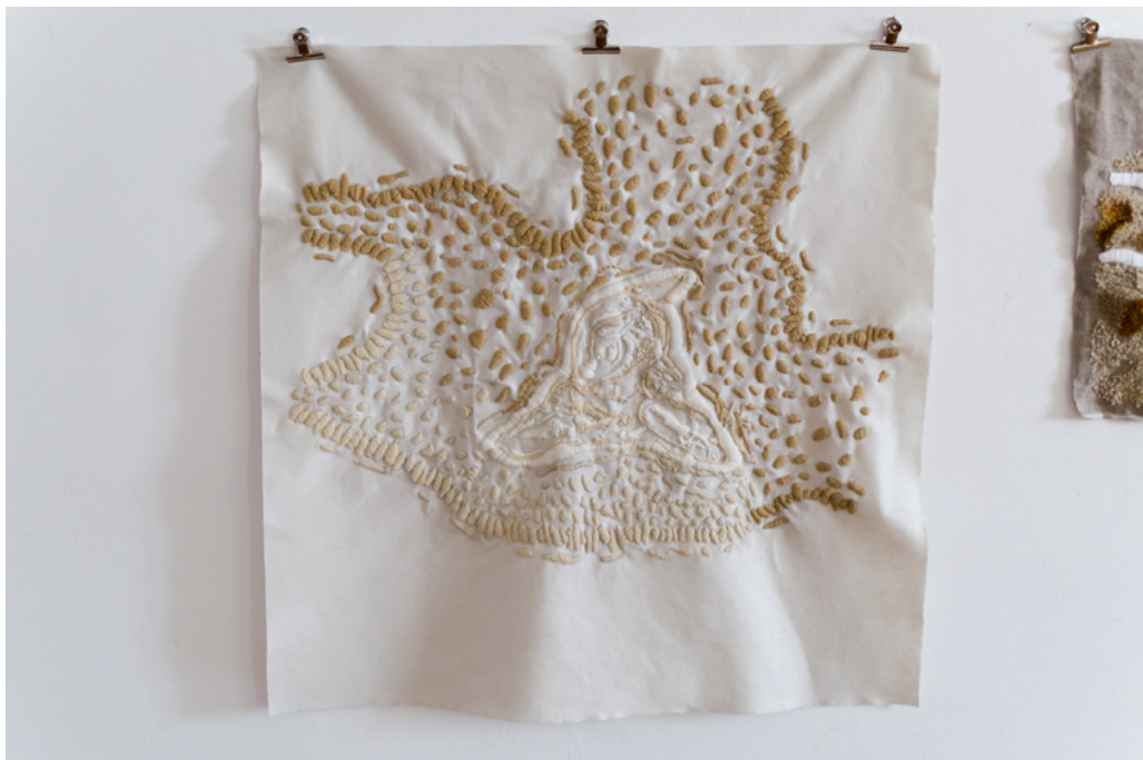
Arhiva patoloških stakalca (detalj), 2018., vez na filcu, 90 cm x 90 cm, prikaz raka ženskih spolnih organa, Stara gradska vijećnica, Split