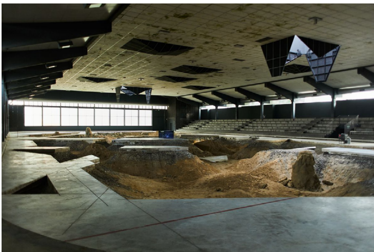
slika 4: Pierre Huyghe, After Alife Ahead, 2017. , betonski pod klizališta, pijesak, alge, pčele, kimera paun, glina, crno promjenjivo staklo, inkubator, ljudske stanice raka, konusni tekstil, genetski algoritam, proširena stvarnost, pomični strop, kiša, logička igra, Skulptur Projekte Münster, Njemačka

Pierre Huyghe stvara intrigantne “biosfere” sačinjene od živih bića, nekad modificiranih, nekad ne, prirodnih materijala i ljudskom rukom napravljenih objekata. Ti novi hibridni, umjetni prostori evociraju krajolike nalik snovima u kojem modificirani oblici života žive i uspijevaju u ljudskom rukom dizajniranim i zatvorenim ekosistemima ( Untitled (2011- 2012) , Zoodram 4 , After Alife Ahead (slika 4)).