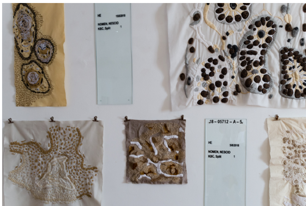
Arhiva patoloških stakalca (detalj), 2018., vez na vuni, žutici, tapisonu, filcu i reteksu, stakla, dimenzije varijabilne, Stara gradska vijećnica, Split