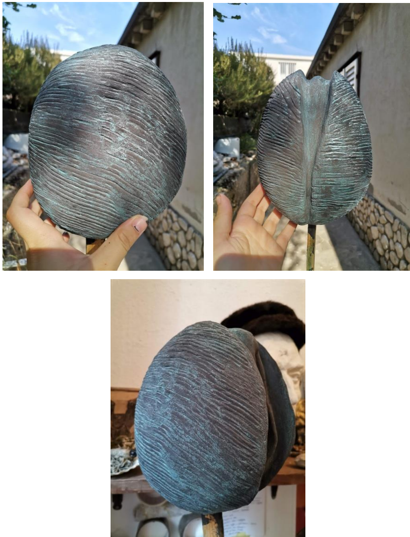
Slika 43., 44., 45. Rezultat patiniranja