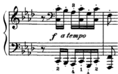
T.16: uvodni motiv

Slijedi most (t. 23-38) kojeg čine dvije osmerotaktne rečenice. Prva počinje u As-duru dvotaktom koji se ponavlja za stupanj više (na trenutak se osjeti boja es – mola) na što se nastavlja četverotakt koji završava dominantom B – dura. Druga rečenica počinje u B-duru, a čine je četiri dvotakta sa završetkom na dominantu As-dura.