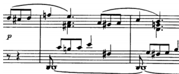
početak drugog dijela prve teme (t.6/7-8)

Drugi dio prve teme (t.7-15) čine dvije četverotaktne rečenice s kadencama na dominantu pri čemu je druga rečenica djelomice varirana. Pisane su polifono: lirska tema se provodi u sopranu i tenoru tehnikom slobodne kanonske imitacije, a sve se odvija na pedalnom tonu dominante. Unisoni, ljestvični niz nas uvodi u most.