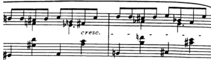
skokovi u lijevoj ruci, t.184/185

Skokovi nisu ni prečesti, ni prezahitjevni i većinom se javljaju u dionici lijeve ruke između basovog tona i ostatka akorda. međutim, kad se Jave u okviru osmingskog ritma mogu predstavljati problem i unijeti nesigurnost. Stoga ih treba osigurati ponavljanjem i vježbanjem brzog pokreta prema tonu na kojeg skačemo što radimo tzv. nijemim vježbanjem (bez sviranja tona na kojeg skačemo). Pri izvođenju skoka ruka i lakat moraju biti slobodni i opuštteni, a zglob elastičan dok prsti vode ruku.