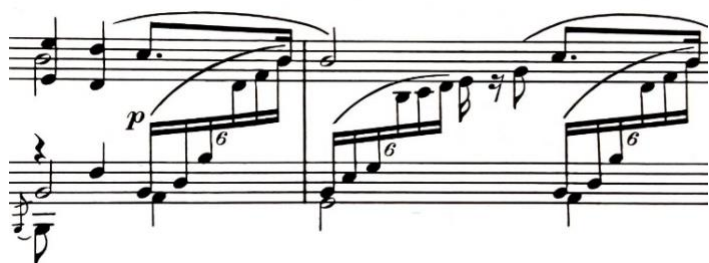
Nocturno slog, t. 8-9

Tehnički problem specifičan za ovaj stavak je pojava tzv. nocturno sloga unutar kojeg se glazba odvija u tri razine i gdje melodiju u gornjoj dionici i basa u donjoj povezuje pratnja.