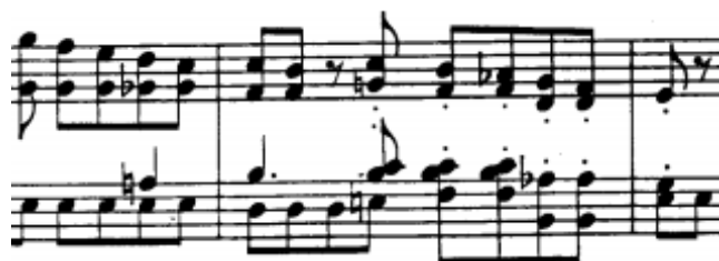
početak druge teme, t.26/27-28

Druga tema (t.26-70) u Es-duru građena je od dvije velike cjeline. Prva započinje sedmerotaktnom rečenicom od 2x2+3 takta koja, koristeći motiv b u inverznom obliku završava polovičnom kadencom na početku t.33.