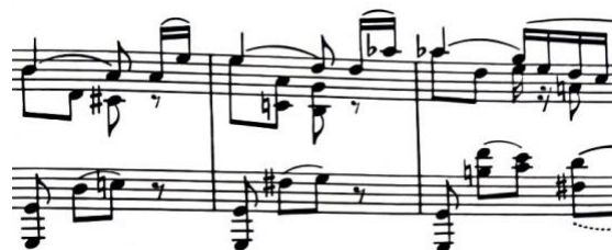
višeglasje u jednoj ruci, t. 1-3