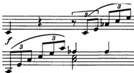
početak provedbe ,t. 90-91

Prvi dio provedbe (t.90-103) čini niz od sedam dvotaktnih fraza pri čemu se neke doslovno ponavljaju, dok su druge u obliku slobodne sekvence. Započinje u c-molu, no nakon četiri takta slijedi niz harmonija dominantnih funkcija, a bez rješenja. Završava na dominantu g-mola. Drugi dio provedbe (t. 104-113) je građen od motiva b (u inverznom ili variranom obliku) koji, praćen nizovima u triolama radi tri dvotaktne fraze uz dva ponovljena takta i dvotaktnim prijelazom na završnu kadencu. Započinje u A-duru pa nas preko fis-mola vodi na dominantu g-mola (u t. 107) stavljajući u tom trenutku u basovu dionicu pedalni ton. Završna kadenca (t. 114-122) koristi materijal s početka provedbe ne mijenjajući pritom basovu dionicu.