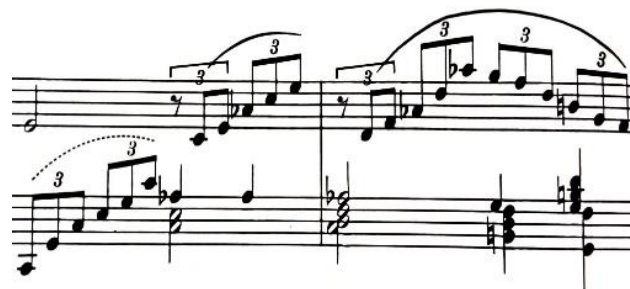
velike rastvorbe u ritmu triola, t. 92-93

Prateće figure u ritmu triola koje nalazimo u provedbi stavka uglavnom su rađene od elemenata velikih rastvorbi i ljestvičnih nizova gdje je osnovni tehnički zahtjev (pogotovo kod razlaganja akorda) osiguravanje čistoće položaja i pravilnost u podmetanju palca i premetanju ruke preko palca.