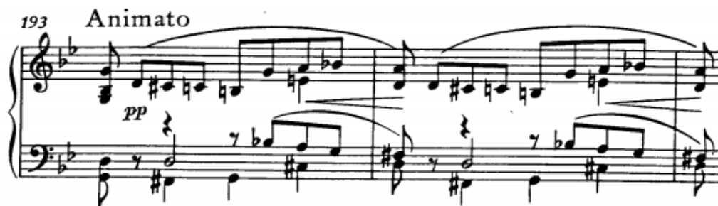
početak Code, t.193

Coda (t. 193-219) se razlikuje od one u ekspoziciji i sadržajem i karakterom. Započinje s dva ista čeverotakta građena na ritmički poznatom motivu koji su ovaj put obojeni kromatikom i završavaju tonikom g-mola. Slijedi uzlazna sekvenca jednotaktnog modela zaokružena kadencom i proširena trotaktnom potvrdom iste.