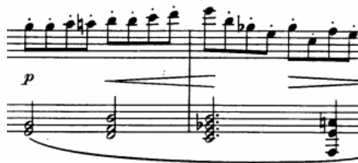
legato akordi u lijevoj ruci, t. 52/53

Kod legato akorada gdje je fizički nemoguće povezati svaki ton, vezat ćemo ono što se može, a „iluziju legata“ postići dugim izdržavanjem svakog akorda i zvučnim povezivanjem unutarnjim uhom.