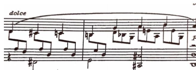
Melodija kao dio položajne figure, t. 112-113

Vrlo čest oblik višeglasja je onaj koji nastaje zadržavanjem prvih tonova položajnih figura i njihovim povezivanjem u melodijsku cjelinu. Za izvođenje takvih figura vrijede ista pravila kao i za prethodne s tim da je ovdje prijenos težine lakše izvesti zbog istovrsne vrste udara u obje dionice.