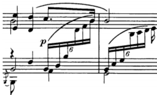
početak proširenja, t. 8/9

Drugi, b dio (t. 13-27) je u dominantnom je B-duru. Građen je od dvije rečenice s proširenjem čiji osnov je ritmički identičan motiv kao na početku stavka. Prva rečenica sadrži četiri takta, druga šest (pri čemu su prva dva dvotakta u sekventnom odnosu), a obje završavaju tonikom B-dura. Črtverotaktno proširenje koje slijedi vraća nas u Es-dur i odvija se na pedalnom tonu njegove dominante.