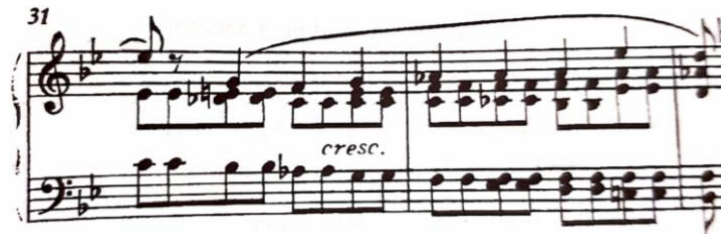
višeglasje u desnoj ruci, t. 31-33

istovremenom zadržavanju težine ruke na tonu melodije uz ponavljanje tonova pratnje vibriranjem ručnog zgloba. Stoga je bitno je razviti osjećaj legato melodije u unutarnjem uhu i raditi na osamostaljenju prstiju vježbajući, primjerice, gornji glas fortissimo, donji pianissimo i obrnuto.