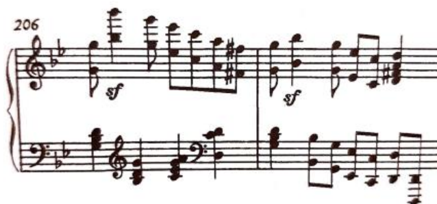
Oktave, t. 206-207