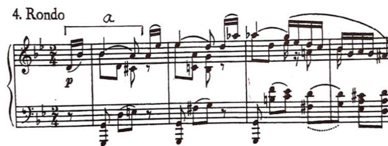
Prva rečenica dijela a, t. 0/1-4

A dio (t. 1-22) je građen iz tri dijela: a) mala perioda s kadencama na dominantni i tonici; b) još jedna mala perioda, ali s dvije autentične kadence; c) dvije male rečenice s kadencama na tonici, prva na sekstakordu, a druga na kvintakordu. Motiv iz kojeg izrasta a dio (motiv 'a') uzet je iz Schumannovog Carnavala op. 9 (Clarinet motiv), dok je baza b i c dijela submotiv od dvije šesnaestinke pod lukom