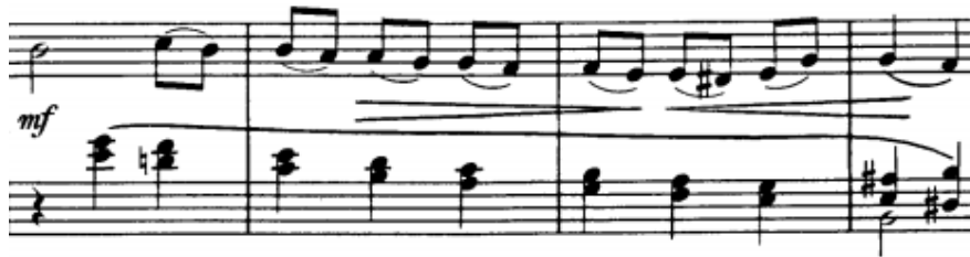
Trio, t. 49-52

(t. 49-52) gdje je to apsolutno moguće, niz terca u Scherzu koje s basovim tonom čine višeglasje zahtijeva što duže izdržavanje tonova i njihovo povezivanje unutarnjim uhom.