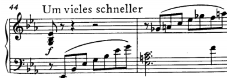
početak drugog dijela druge teme (t. 44)

Drugi dio druge teme (t. 44-70) građen je nizanjem manjih segmenata. Započinje s četiri četverotaktne fraze međusobno povezane u parove obzirom na istu motivsku građu kojom počinju. Slijedi slobodna uzlazna sekvenca od četiri ponavljanja jednotaktnog modela s dva taktova proširenja. Prve tri fraze su harmonijski stabilne i kreću se unutar Es-dura. Od t. 36, nakon skretanja u istoimeni mol nastupa kromatsko-enharmonijska modulacija u H-dur. Preostali dio ove cjeline, počevši od t. 59 prepun je kromatike, enharmonije i općenito harmonijske nestabilnosti pa povratak u Es-dur doživljavamo kao nužnost. Posljednja tri takta koriste motive c i d najavljujući tako promjenu.