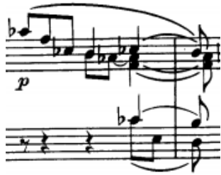
motiv c (t. 33)

Materijal koji slijedi zvuči poput proširenja, a sadrži jednu rečenicu od pet taktova (2x1+3 takta) i tri slična dvotakta. Unutar spomenute rečenice javljaju se dva značajna motiva: