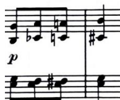
početni motiv b dijela, t.13/14

Drugi, b dio (t. 13-27) je u dominantnom je B-duru. Građen je od dvije rečenice s proširenjem čiji osnov je ritmički identičan motiv kao na početku stavka. Prva rečenica sadrži četiri takta, druga šest (pri čemu su prva dva dvotakta u sekventnom odnosu), a obje završavaju tonikom B-dura. Črtverotaktno proširenje koje slijedi vraća nas u Es-dur i odvija se na pedalnom tonu njegove dominante.