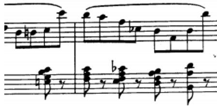
akordi non legato u lijevoj ruci, t.46/47

Akorde non legato sviramo s površine tipke, duge uranjanjem u dno, a kratke brzim odbivanjem s površine ako su u jakoj dinamici, odnosno polaganim ako su u pianu.