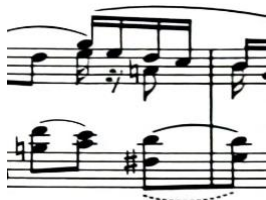
Dvohvati legato, t.3

Izvođenje dvohvata non legato i legato , kao i jednostavno višeglasje u jednoj ruci ovdje ne predstavljaju veći problem.