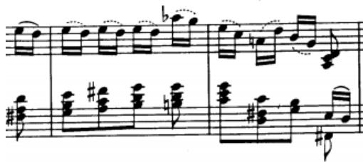
nizovi akorada, t. 47/48-49

Nizovi non legato akorada traže brzu prilagodbu ruke na promjenu položaja, pa ih je stoga jako važno prvo izvježbati u sporom tempu kako bi ruka mogla osjetiti svaku poziciju i na nju „sjesti“. Pri izvođenju, najbitnija je stavka elastičan ručni zglob. Akordi su, također, povremeno pisani u jako širokom slogu, pa ih iz nemogućnosti hvatanja izvodimo kao arpeggia što stvara dodatnu poteškoću kod brze izmjene položaja.