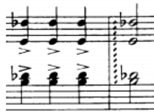
motiv d (t. 36)

Drugi dio druge teme (t. 44-70) građen je nizanjem manjih segmenata. Započinje s četiri četverotaktne fraze međusobno povezane u parove obzirom na istu motivsku građu kojom počinju. Slijedi slobodna uzlazna sekvenca od četiri ponavljanja jednotaktnog modela s dva taktova proširenja. Prve tri fraze su harmonijski stabilne i kreću se unutar Es-dura. Od t. 36, nakon skretanja u istoimeni mol nastupa kromatsko-enharmonijska modulacija u H-dur. Preostali dio ove cjeline, počevši od t. 59 prepun je kromatike, enharmonije i općenito harmonijske nestabilnosti pa povratak u Es-dur doživljavamo kao nužnost. Posljednja tri takta koriste motive c i d najavljujući tako promjenu.