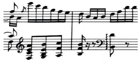
akordi u širokom slogu, t. 83-84

Izvođenje dvohvata non legato i legato , kao i jednostavno višeglasje u jednoj ruci ovdje ne predstavljaju veći problem.