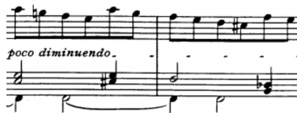
Scherzo, t. 22-24

Srednji dio Scherca čine nizovi staccato osminki u figurama razloženih akorada, velikih rastvorbi i pokretnih položajnih figura. Kako bismo izbjegli premetanje ruke preko palca i nepotreban skok, u narednom primjeru se zadnja 2 tona rastvorbe mogu odsvirati lijevom rukom. Takvom promjenom dobivamo položajnu figuru.