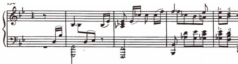
prvi četverotakt dijela B, t. 23/24-27

B dio (t. 23-39) započinje istim motivom kao i A dio, ali to je jedino što te dvije cjeline imaju zajedničko. Građen je nizanjem četverotakta: dva četverotakta u sekventnom odnosu u intervalu donje terce pri čemu drugi završava dominantom c-mola; četverotakt koji se svojim krajem vraća početnom g-molu završavajući na njegovoj dominantni; dva ista dvotakta s polovičnom kadencom.