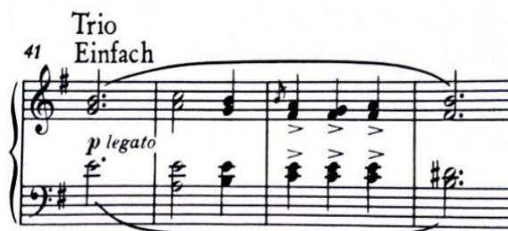
Slika 9, početak Tria

Trio je u paralelnom, e-molu i također je trodijelne forme, a b a'. Dio a (t. 41-56) čine dvije male periode, prva s variranom drugom rečenicom i dvije polovične kadenice, a druga s polovičnom kadencom na kraju prve i autentičnom na kraju druge rečenice. Dio b (t. 57-76.) sadrži veliku rečenicu s dva dvotakta proširenja i četiri puta ponovljenom polovičnom kadencom. Slijedi ponavljanje druge periode dijela a (t. 67/68-76) gdje je veliki dio druge rečenice zamijenjen kromatskim pomacima koji vode do kadenice i kraja „b“ dijela. Trio završava ponavljanjem prve periode dijela a (t. 77-84) u kojoj je polovična kadenca na kraju zamijenjena autentičnom.