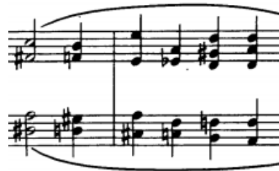
dvohvati legato u lijevoj ruci, t. 159/160

Kod dvohvata legato vezujemo tonove melodije pazeći pritom odsvira istovremeno, da prsti ostanu aktivni, a palac opušten i pokretljiv. s iluzijom legata.