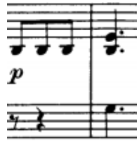
početni motiv a dijela. t. 0/1

I. stavkom čini i inicijalni motiv koji je, zapravo, diminuirani motiv d). Završni motiv druge rečenice, ritmiziran i praćen sekstolama, osnov je četverotaktnog proširenja koje nas preko g-mola vodi na toniku Es-dura.