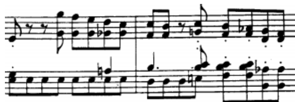
dvohvati non legato u desnoj ruci, t.28/29

Način na koji izvodimo dvohvate non legato ovisi o njihovom trajanju i propisanoj dinamici. Brze i tihe izvodimo iz što veće blizine malom polugom (ručni zglob). Kako dinamika raste tako se povećava i poluga koju koristimo. Tako ćemo, primjerice, dvohvate u drugoj temi svirati iz ručnog zgloba, oktave u osminkama u Codi podlacticom, a črtvrtinske cijelim ručnim lancem.