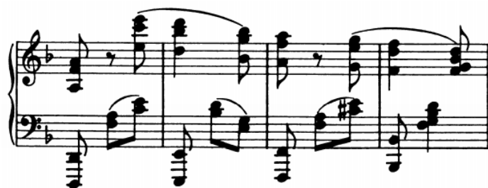
Slika 5 - t. 17-20

Premda je izrazito brzi tempo, Brahms je ostavio dovoljno vremena za prebacivanje s položaja na položaj. Osim na završetku prve teme u ekspoziciji.