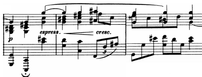
Slika 25 - t. 8-10

Dio A (t. 1-24) sadrži tri manje cjeline ( a b a' ), a ta je trodijelnost uočljiva samim pogledom na partituru, obzirom na to da su dijelovi jasno odvojeni koronama. Dio a (t. 1-8) sadrži četiri dvotaktne fraze složene u dvije male rečenice za koje slobodno možemo reći da tvore periodu, obzirom na podudarnost materijala (prvi i treći dvotakt donose isti materijal udaljen za sekundu naviše) i polovičnu kadencu na kraju prve rečenice (koja zvuči poput pitanja koje čeka odgovor). U toku zadnjeg dvotakta nastupa modulacija u Cis-dur. Dio b (t. 8/9-14) čini šesterotaktna rečenica također građena nizanjem dvotakta (kako je treći dvotakt vidno drugačiji možemo govoriti i o četverotaktnoj rečenici s proširenjem) u toku koje dolazi do modulacije u gis-mol čijom dominantom ovaj dio završava. Sponu a i b dijela čini motiv u osminkama koji je u b dijelu intervalski promijenjen.