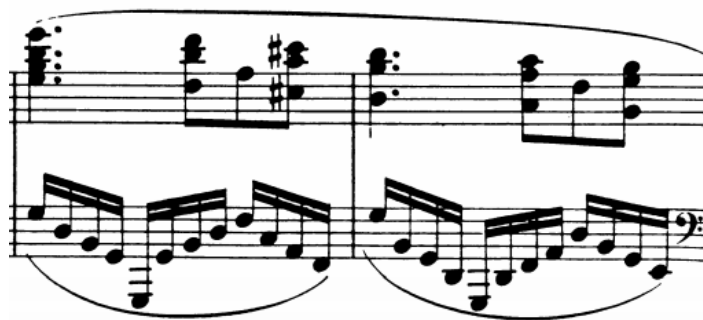
Slika 21 - t. 61-62