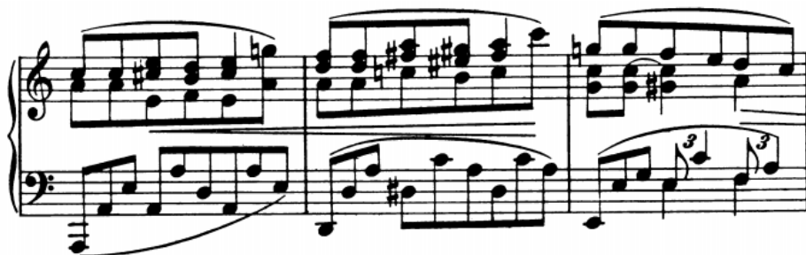
Slika 6 - t. 14-16

Problemi izvođenja koje dijele i dvohvati i akordi su jednakozvučnost i istovremenost zvučanja svih tonova vertikale. To se postiže tako da fiksirani prsti jednakom brzinom urone u dno tipki. U dionici desne ruke najviši ton suzvuka je ujedno i ton melodije pa kao takav treba biti istaknut, dok u dionici pratnje to nije nužno. Drugi problem je povezivanje dvohvata i akorada. Odabir adekvatnog prstometeta omogućuje bolje fizičko povezivanje. Ono što fizički nije moguće povezati, povezuje se slušno uz maksimalno izdržavanje tonova koji neće biti povezani. Prvenstvo u povezivanju imaju tonovi melodije.