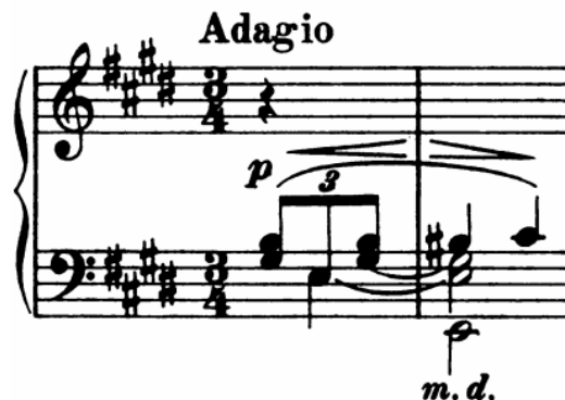
Slika 14 - t.1-2

Prva tema je građena od dvije rečenice od po četiri takta koje već spomenuti motiv povezuje u deveterotaktnu periodu. Prva rečenica završava tonikom polaznog tonaliteta, E-dura, dok druga modulira u H-dur i završava također autentičnom kadencom.