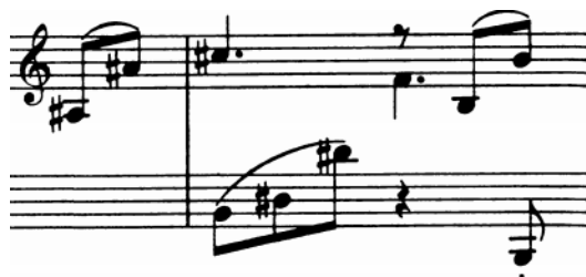
Slika 23 – t. 14/15

Dio b (t. 11-28) započinje u H-duru četverotaktnom rečenicom koju možemo smatrati uvodnom. Slijedi šesterotaktna rečenica na toničkom pedalnom tonu za izradu koje se Brahms poslužio motivom koji, zapravo, predstavlja inačicu motiva s početka.