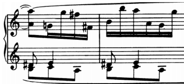
Slika 8 - t. 24-25

U čitavom srednjem dijelu skladbe dionica desne ruke je građena od lomljenih oktava u figurama gdje se izmjenjuju uzlazne i silazne tvoreći „lažno dvoglasje“. Gornji glas se izvodi petim i četvrtim prstom silazno, odnosno četvrtim i petim prstom uzlazno. Gornji glas također mora biti jači od donjeg u čemu će pomoći zamah rukom na prvi od dva tona melodije. Donji glas je tiši, a izvode ga palac i drugi prst. Problem nastaje u trenutku kad to nije moguće i dva susjedna tona se moraju odsvirati palcem. Navedeni problem se rješava tako da palac to izvede fleksibilno i neprimjetno, horizontalnim pokretom i najkraćim putem, mekano i bez akcenta.