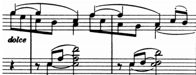
Slika 17 - 15/16-17