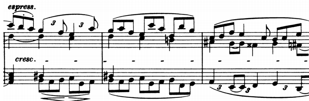
Slika 16 - t. 28-30

B2 (t. 26-36) započinje u cis molu. Nakon dva poznata takta melodija se mijenja, triole ritmiziraju (t. 28), prateća dionica pokreće, a peterotaktna rečenica proširuje na sedmerotaktnu. U posljednja tri takta melodiju prate hemiole u donja dva glasa (t. 30-32).