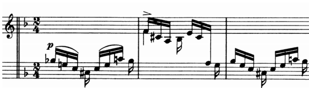
Slika 29 - t. 47-49

Početak dijela A' sadrži šesnaestinske figure koje se izvode izmjenjivanjem ruku. Kako lijeva ruka donosi zadnju, laganu šesnaestinku, dokle god ona ne postane dio melodijske linije treba je uklopiti u niz uz nastojanje da ne dođe iz zraka i ne proizvede neželjeni akcent. Kako se radi o brzom tempu, čitav taj dio bi jako dobro bilo vježbati tzv. sažimanjem formule tj. svirati desnu u akordima kako bi bila spremna brzo mijenjati položaje pogotovo kad su odijeljeni skokom.