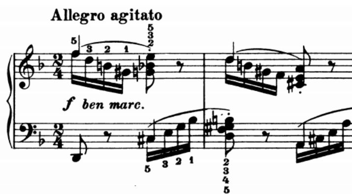
Slika 27 - t. 1-2

Početni motiv građen vezivanjem razloženog i kompaktnog akorda, s melodijom u najgornjem glasu, prvenstveno traži naslon na prvi ton razloženog akorda, potom oduzimanje težine kako bi ostatak akorda bio što laganiji te izvođenje narednog trozvuka premetanjem ruke preko palca, ponovo uz isticanje tona melodije i u dinamici primjerenom za dva tona pod lukom. Pritom palac mora biti učvršćen, a prsti koji prelaze preko njega hvataju tonove akorda vlastitom snagom, nikako pasivnim zamahom ruke u prebacivanju na novi položaj. Fiksiranje prstiju na novi akord odvija se u zadnji tren jer palac koji leži to ne dozvoljava. U slučaju da je udaljenost između palca i drugog prsta u sljedećem akordu veća, legato neće biti moguće. Tada je potrebno izdržati palac što duže, a legato slušati unutarnjim uhom. Sličan problem rješava i lijeva ruka s tim da u njenim figurama nedostaje melodijska linija.