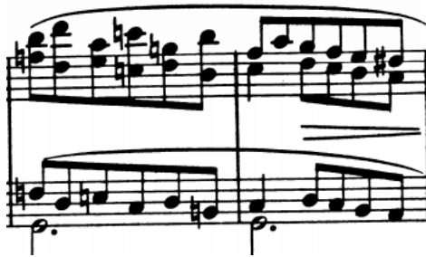
Slika 7 - t. 61-62