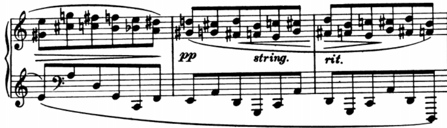
Slika 9 - t. 63-65

Dionica pratnje u A dijelovima donosi razložene akorde u velikim rasponima koji se adekvatnim prstometom mogu izvesti legato . U t. 63 – 65 nalazi se nezgodno mjesto gdje podmetanje palca može poremetiti izjednačenost i narušiti pianissimo dinamiku.