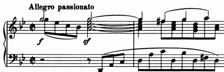
Slika 10 - t.1-2