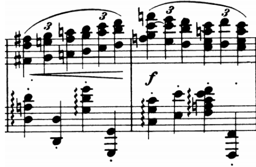
Slika 12 - t. 41-42

se javlja između desne i lijeve ruke dodatni je problem kojeg na ovim mjestima treba riješiti.