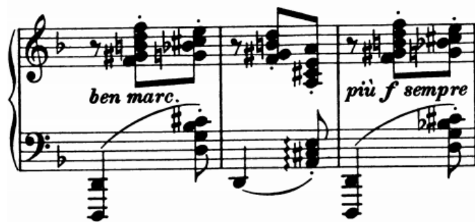
Slika 30 - t. 76-78