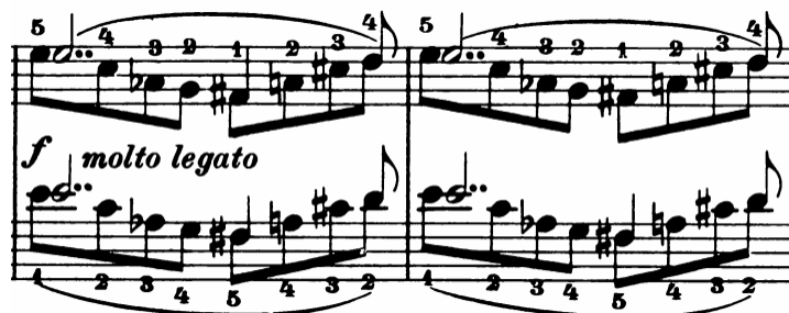
Slika 11 - t. 9-10