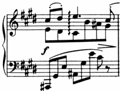
Slika 20 - t. 22