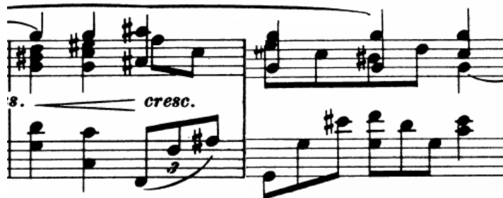
Slika 26 - t. 9-10

Tehnički problem u drugom dijelu skladbe je izvođenje položajnih figura uz isticanje melodijske linije. Položajne figure u obliku razloženih trozvuka prelaze iz ruke u ruku pa je potrebno obratiti pozornost na trenutak izmjene kako ne bi došlo do nepotrebnih akcenata i kako bi se osigurala tonska jednakost. U slučajevima kad je prvi ton položaja ujedno i dio melodijske linije, kako bi se postigla jasna razlika između melodije i pratnje, ton melodije potrebno je odsvirati dublje od ostalih koristeći naslon i prirodnu težinu ruke.