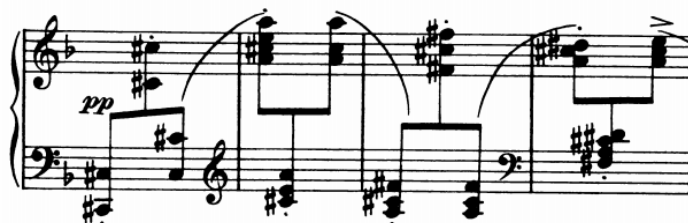
Slika 4 - t. 83-86

Martelato (tal. Martellare – udarati čekićem) svojim nazivom sugerira sviranje pri kojem zvuk podsjeća na udarce čekićem. Izvodi se cijelom rukom ili podlakticom, a odnosi se na jednostruke nizove tonova, dvohvate i akorde koji se izvode naizmjeničnim pokretima ruku. Teškoća izvođenja martellata upravo se i sastoji u dobivanju izjednačenog i neprekidnog pokreta obje ruke. Martellato spada među virtuozne elemente klavirske tehnike, a zvuči (i izgleda) vrlo moćno. Međutim, u provedbi Capriccia Brahms ga koristi iz čiste potrebe glazbe izmjenjujući melodijsku liniju najdubljeg tona akorda desne ruke s basovim tonom u lijevoj.