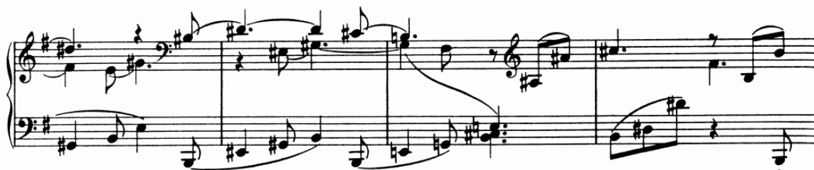
Slika 24 - t. 12-15

Drugi dio skladbe je pisan troglasno i sadrži: (poredano prema važnosti) melodiju u sopranu, bas i prateći razloženi akord. Za početak potrebno je glasove vježbati zasebno kako bi ih slušno diferencirali, a i riješili problem prelaska glasa iz ruke u ruku. Kad smjer melodije i trajanje svakog pojedinog glasa postane jasan, može se početi sa spajanjem glasova. Pritom prvenstveno treba obratiti pozornost na prstomet kako bi se ostvario legato i izbjegli nespretni pokreti. Dvoglasje u jednoj ruci je puno jednostavnije kad se tek pojavi (t. 13 i 14), jer se glasovi kreću naizmjenično, nego kasnije kad se u jednom trenutku suočimo sa sve tri razine (t. 15).