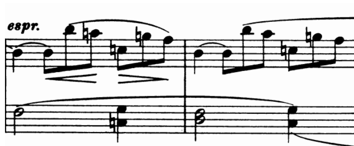
Slika 15 - t. 10-11

B1 (t. 10-14) čini peterotaktna rečenica koja se cijelim tokom odvija u e-molu završavajući na dominantni. Građena je od motiva u triolama koji se spušta u slobodnoj sekvenci pretvarajući prvi ton triole u melodijsku liniju.