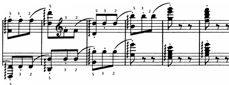
Slika 3 - t. 193-197

Repeticija ili brzo ponavljanje jednog tona najefikasnije se izvodi prstima, dok je kod repetiranja dvohvata (oktava) potrebno koristiti ručni zglob. Repeticije u materijalu prve teme izvodimo promjenom prstiju tako da nam oktava koja slijedi bude što bliže.