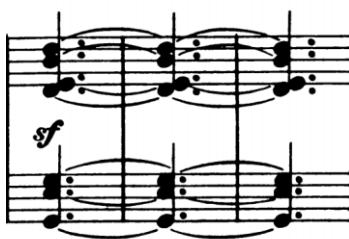
Slika 1 - t. 56-58

Pravilnost izvođenja akorada se ogleda u tome da svi tonovi vertikale dođu do dna tipke u isto vrijeme i jednakom brzinom kako bi se postigla zvučna izjednačenost. To je naročito važno kad ruke sviraju zajedno, a vertikalna broji šest do osam tonova.