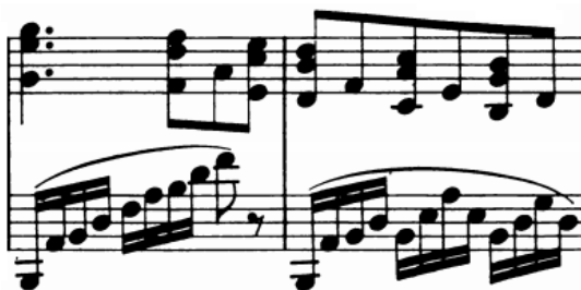
Slika 19 - t.38-39

Dionica pratnje u lijevoj ruci je većinom građena od figura razloženih akorada u triolskom ili šesnaestinskom ritmu koje u ovom polaganom tempu nisu virtuozne i ne predstavljaju poteškoću te vrste. Međutim, vrlo su česte položajne figure širokih, nepijanističkih raspona gdje je potrebno paziti prvenstveno na tonsku izjednačenost. S druge strane, u nizovima koji sadrže elemente velike rastvorbe, iz istog razloga treba pripaziti da podmetanje palca ili premetanje ruke preko palca ne unese neželjene akcente