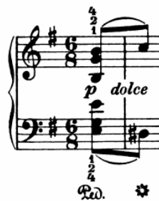
Slika 22 - t.1

Dio a (t. 1-10) počiva na motivu satkanom od jedne ritmičke ćelije u trajanju od pola takta koju čine dvije osminke s pauzom.