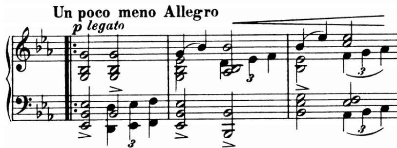
Slika 13 - t. 35-37

2. Akordi unutar kojih započinje melodijski fragment zahtijevaju svladanu tehniku isticanja jednog od unutarnjih glasova akorda. Ta vrsta tehnike traži samostalnost prstiju i umijeće oslanjanja na svaki pojedini ton vertikale. Prst koji mora istaknuti određeni ton akorda postavlja se malo niže, a na njega se oslanja težina ruke što znači da težina ne pada podjednako na sve prste.