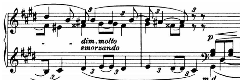
Slika 18 - t. 31-32