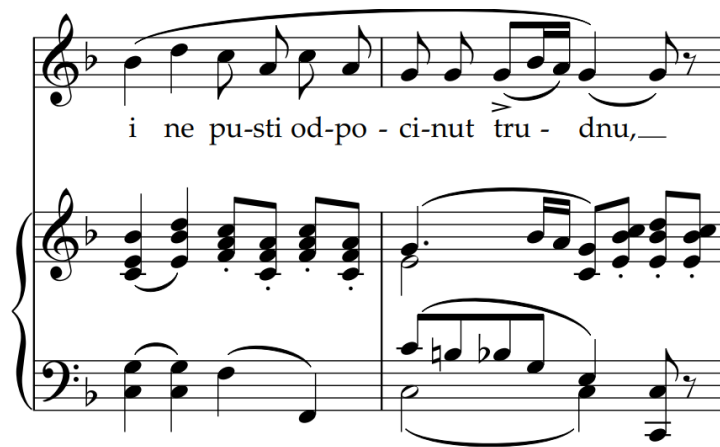
Slika 45 – t. 13-14 (izvornik)

Drugi dio tematskog sadržaja donosi novu strukturu klavirske pratnje; prevladava homofonija (najviši tonovi gornjeg glasa podupiru melodiju teme) a po završetku se pojavljuje silazni kromatski motiv: