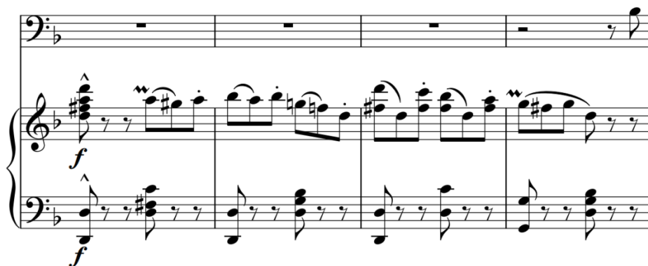
Slika 118 – t. 69-72 (izvornik)

S obzirom na to da se nakon ulomka dalje razvija novi tematski materijal, nametnuo se zaključak da zadržim strukturu klavirske pratnje kao poveznicu za daljnji razvoj i nadolazeći vrhunac skladbe. Tekst je preuzet dijelom iz prethodnog (i u manjoj mjeri reducirano- „neću cvjetke ove“ promijenjeno u „neću cvjetke“) i predstojećeg izlaganja („Ta ruka grlila je jednako“ također bez zadnje riječi). Izmjenični motiv male/velike sekunde donose basi i prvi tenori.