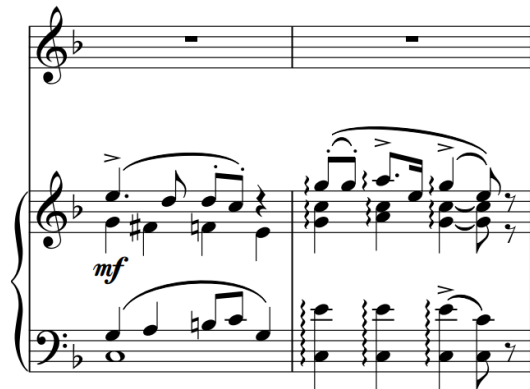
Slika 72 – t. 47-48 (izvornik)

Opet muški dio zbora nastupa; zadržana je struktura klavirske pratnje u dionicama glasova, samo što je donji motiv prebačen u T2 a gornji u B1 (zamjena). Svi glasovi pjevaju boccachiusa :