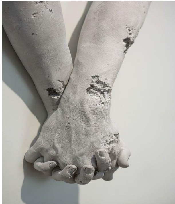
Daniel Arsham – Holding Hands