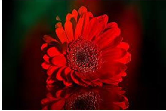
Eva kao cvijet – crveni gerber