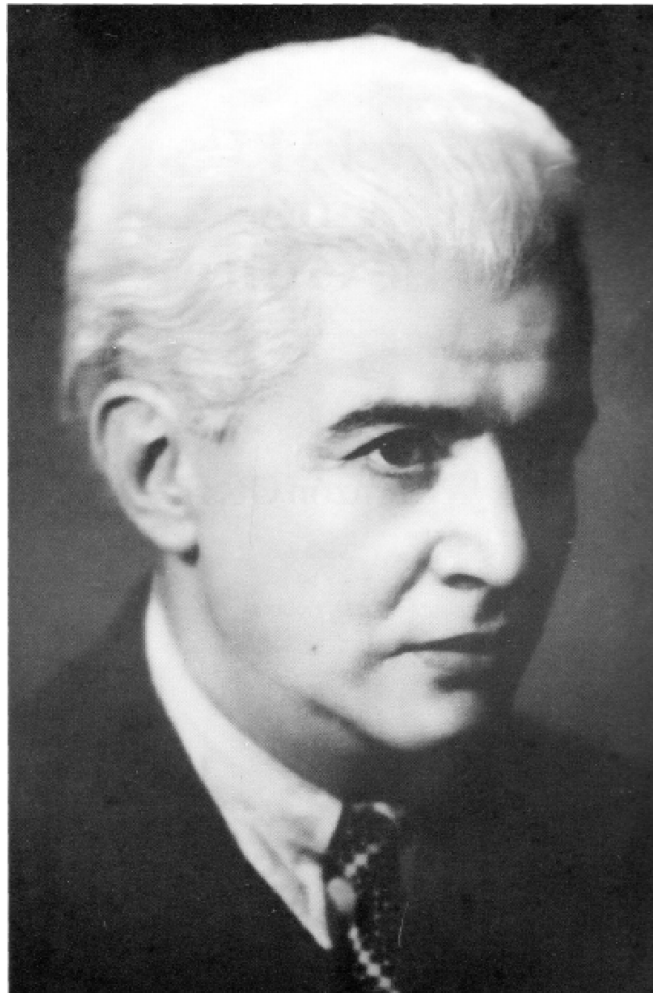
Manuel María Ponce

Manuel María Ponce bio je meksički skladatelj i pijanist aktivan za vrijeme 20. stoljeća. U ovom radu bavit ću se njegovim životom, glazbenim stilom i doprinosom gitari. Njegova glazba je delikatna, jednostavna, ali istovremeno i zanimljiva. Glavni elementi izražavanja kojima se ističe je upotreba kontrapunkta, moderne harmonije i jednostavnih tema. Ponce je bitan zbog doprinosa meksičkom nacionalnom stilu i upotrebi folkloru u svojim djelima. Iako je gitara posljednji instrument za koji je skladao, njegov doprinos gitarističkom repertoaru je ogroman, a djela su među najizvođenijima.