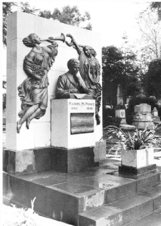
Ponceov grob u Mexico Cityu

Nakon neprestanih uspona i padova u bolesti koja je Poncea mučila godinama, 1948. godine stanje mu se znatno pogoršalo. 24. travnja 1948., u dobi od 66 godina umro je jedan od najvećih skladatelja Amerika, ostavljajući iza sebe ogroman gitaristički repertoar.