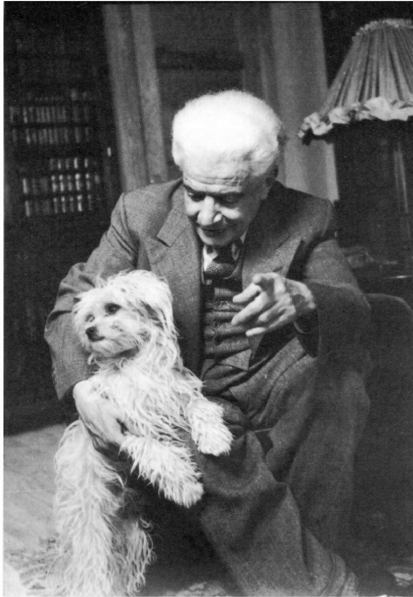
Ponce i pas Kiki