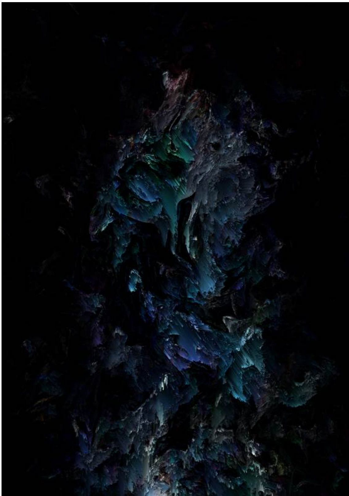
Kristijan Vrdoljak, Autoportret, 2021, digitalno generirana slika