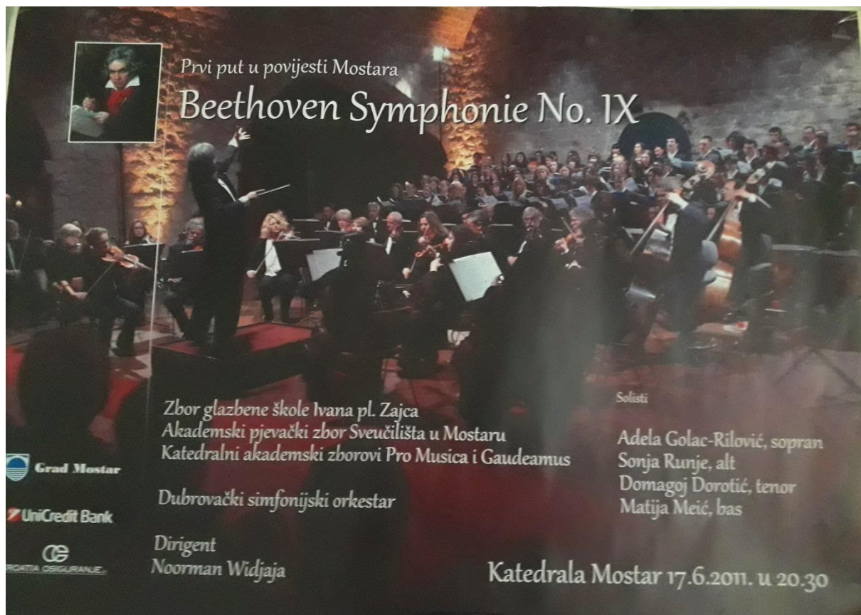
Slika 15. Plakat koji najavljuje izvedbu Beethovenove „IX. simfonije“ u Mostaru (Župni ured mostarske katedrale)