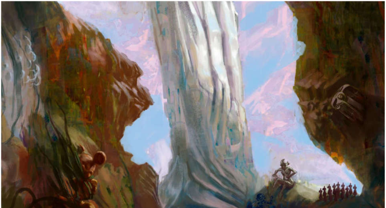
Prijedlog za „Prvi prikaz“, 2020., digitalna slika.

Prikazi estetskog razvoja djela u raznim fazama razvoja.