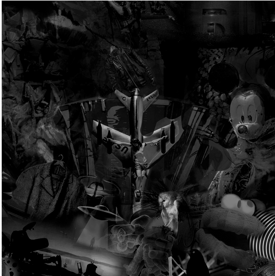
METAVERSE 2 (detalj), 2021., digitalna slika/print, 150 x 330 cm.