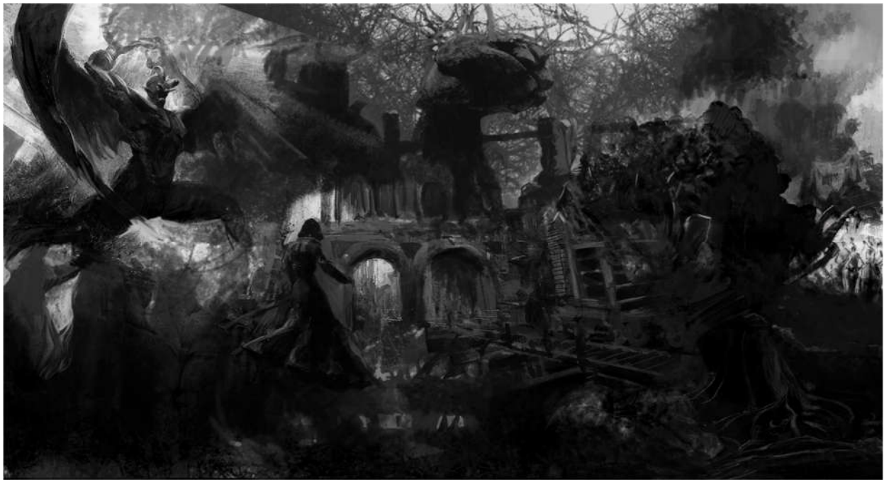
Drugi prijedlog za „Prvi prikaz“, 2020., digitalna slika.