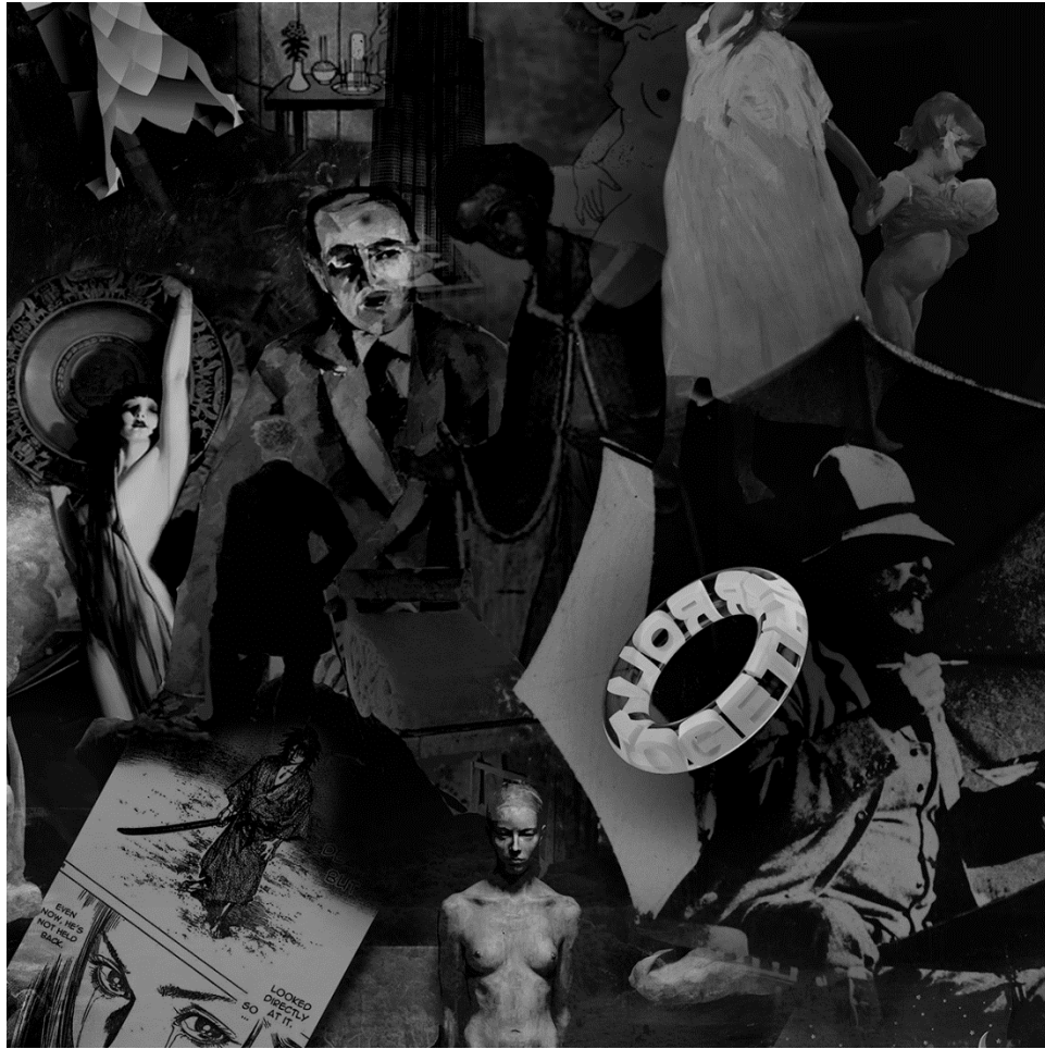
METAVERSE 3 (detalj), 2021., digitalna slika/print, 150 x 330 cm.