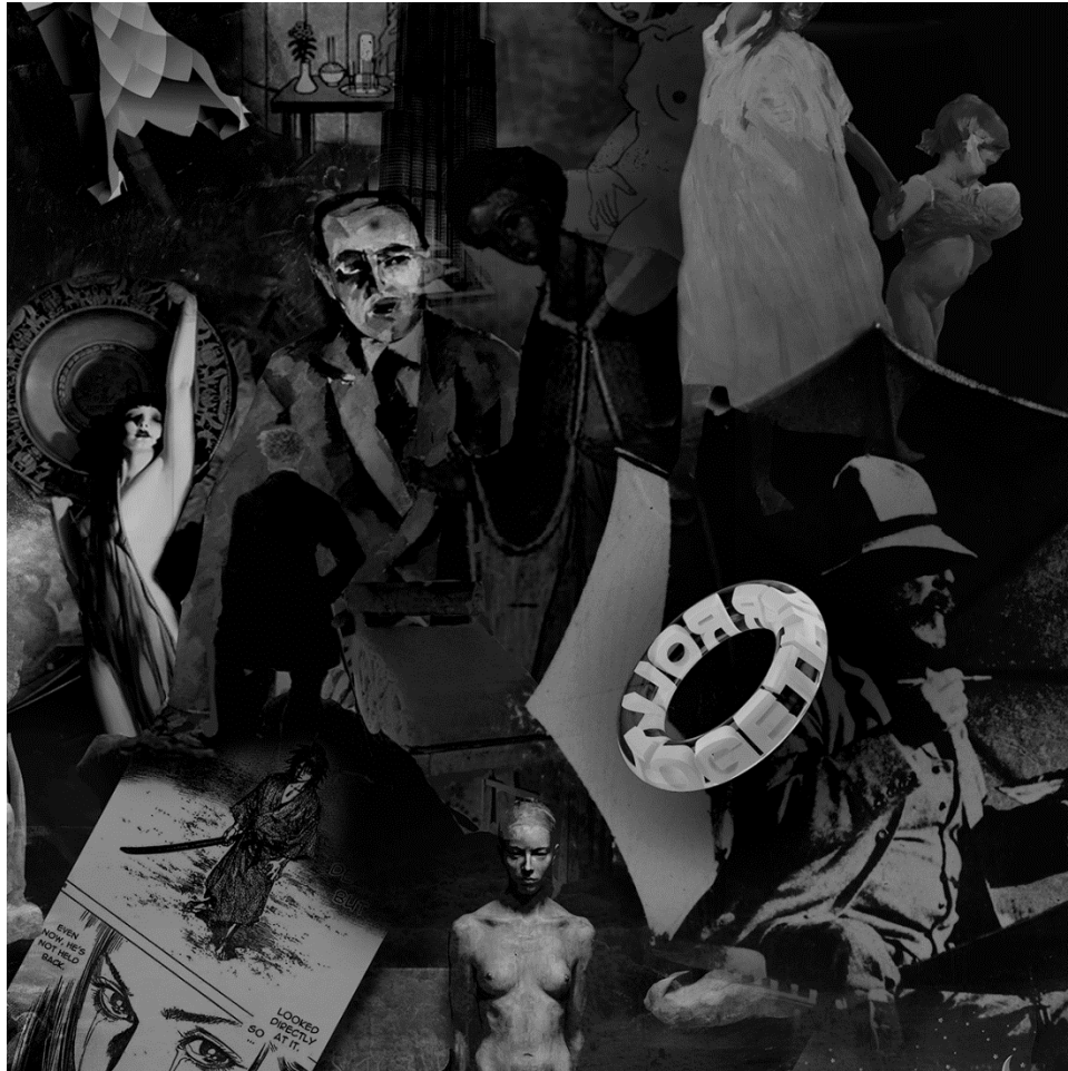
METAVERSE 3 (detalj), 2021., digitalna slika/print, 150 x 330 cm.