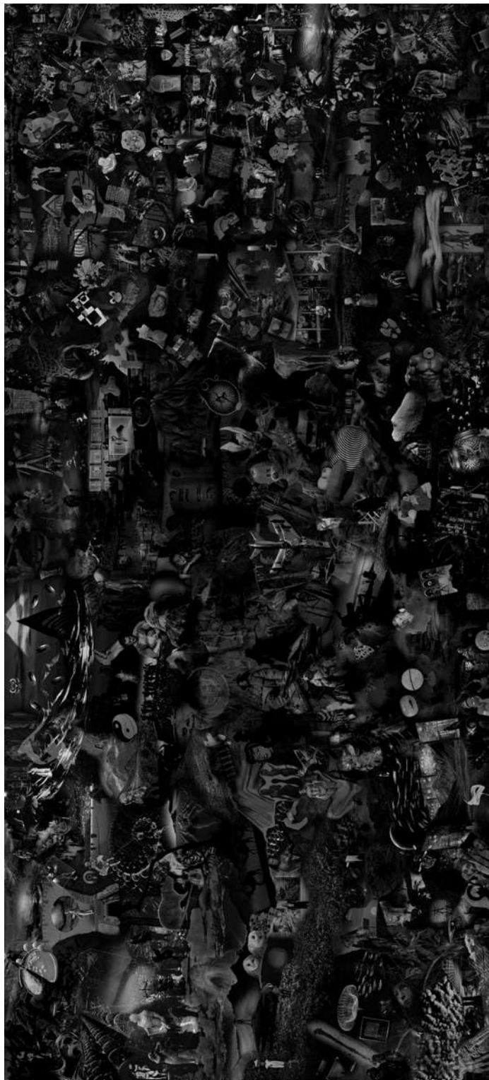
METAVERSE 2, 2021., digitalna slika/print, 150 x 330 cm.