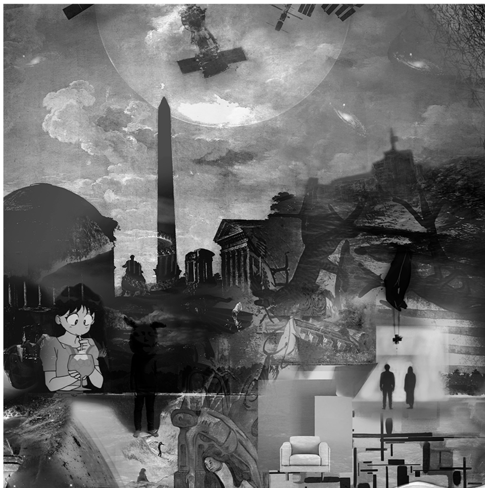
METAVERSE 1 (detalj), 2021., digitalna slika/print, 150 x 330 cm.