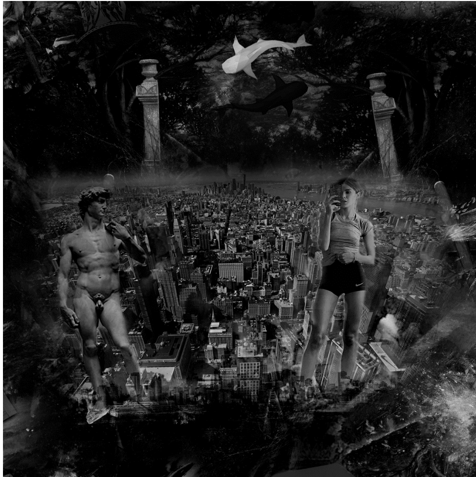
METAVERSE 3 (detalj), 2021., digitalna slika/print, 150 x 330 cm.