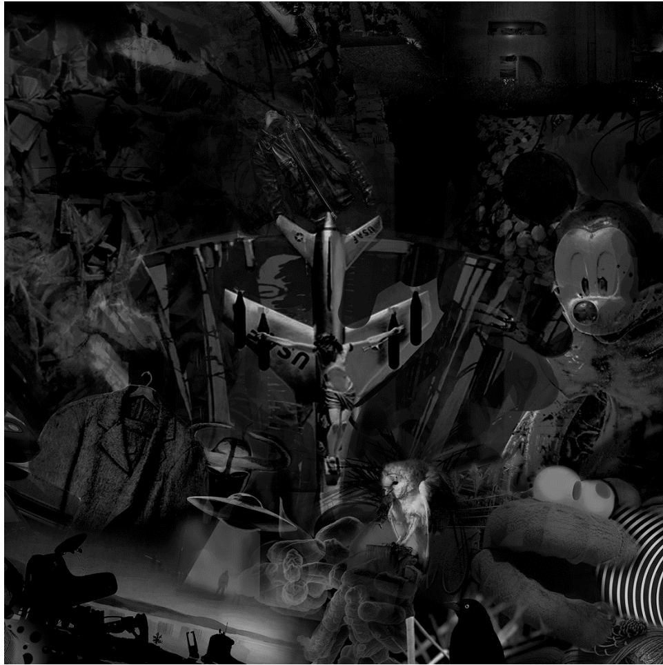
METAVERSE 2 (detalj), 2021., digitalna slika/print, 150 x 330 cm.