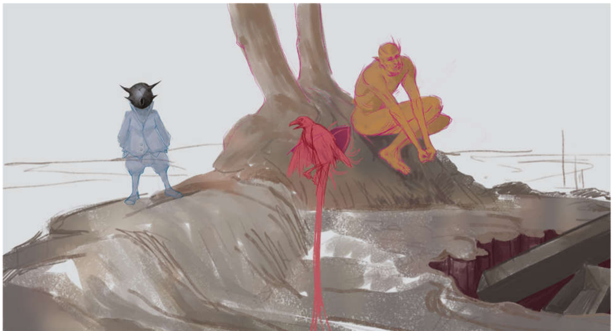
Prijedlog za „Drugi prikaz“, 2020., digitalna slika.