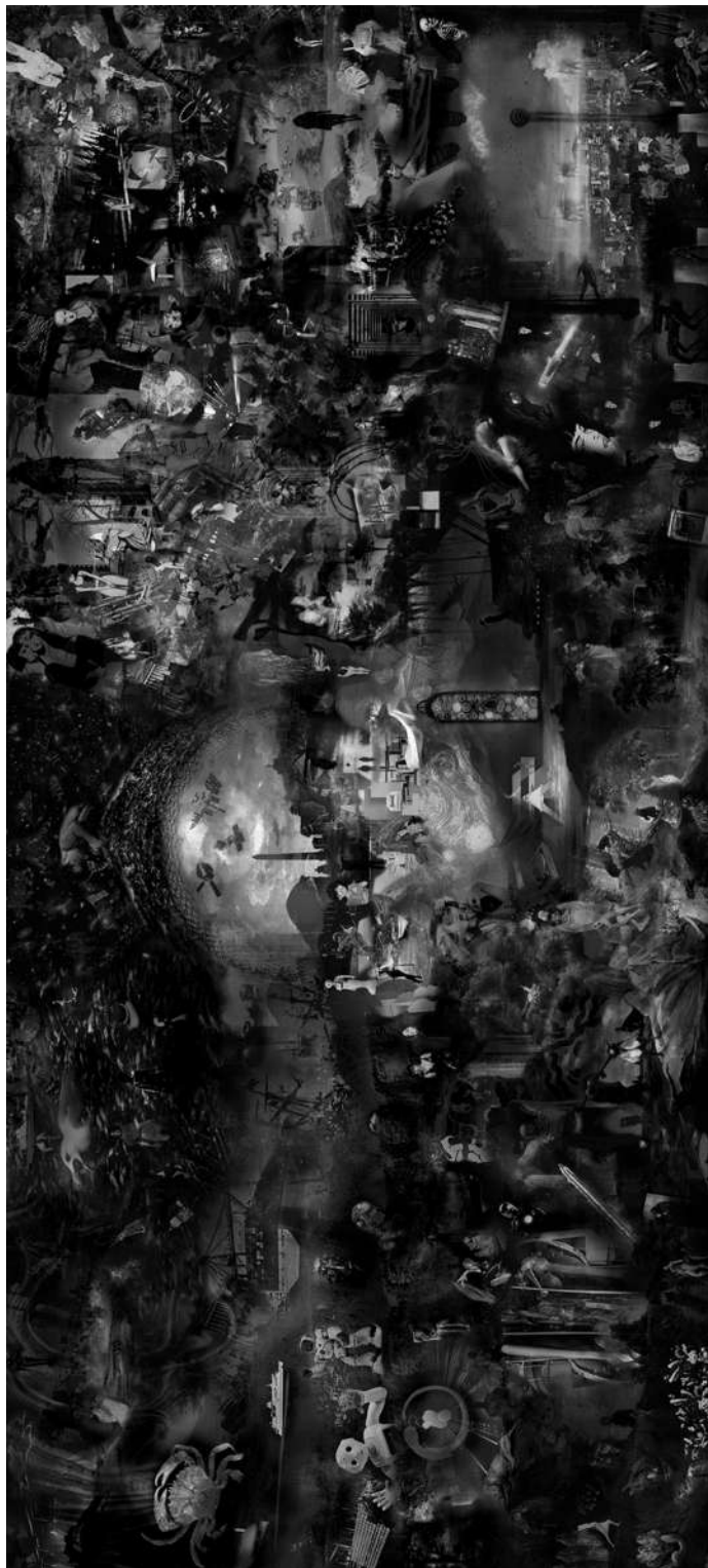
METAVERSE 1, 2021., digitalna slika/print, 150 x 330 cm.