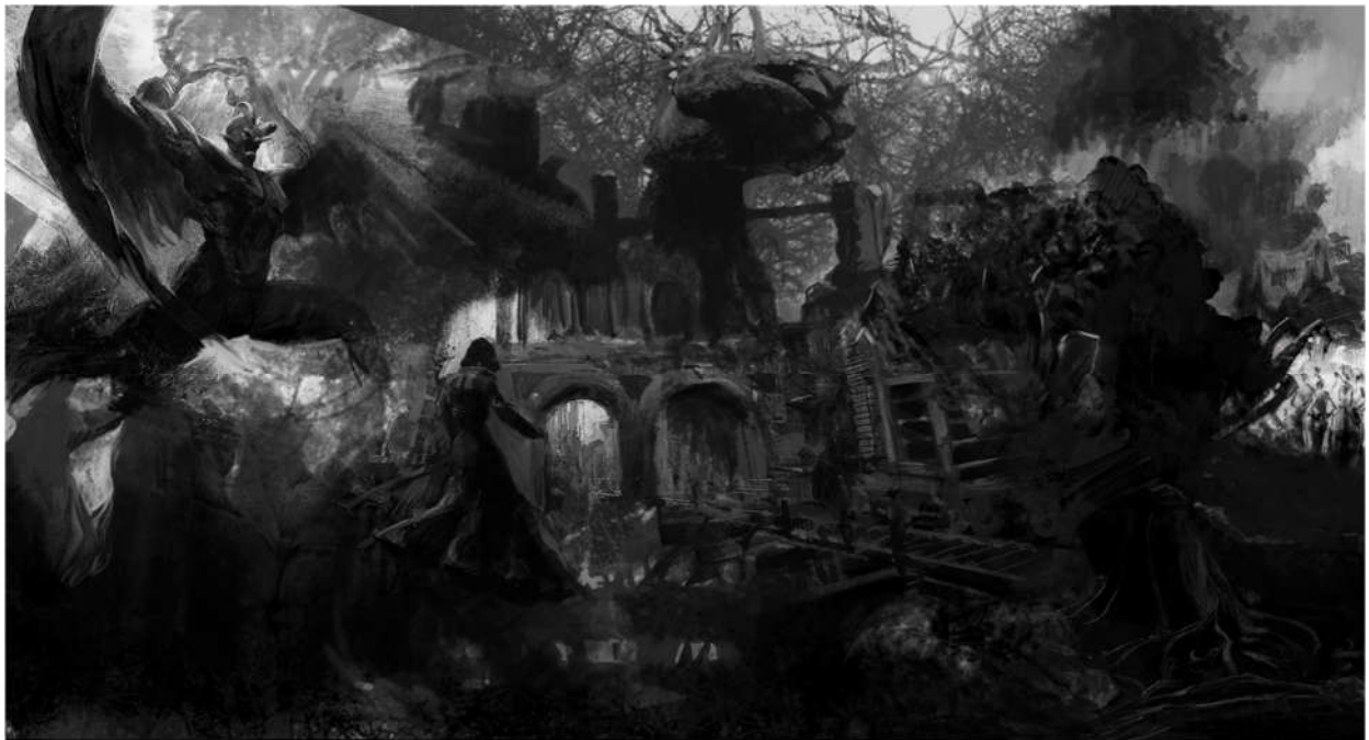
Drugi prijedlog za „Prvi prikaz“, 2020., digitalna slika.