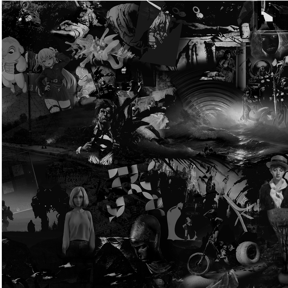
METAVERSE 2 (detalj), 2021., digitalna slika/print, 150 x 330 cm.