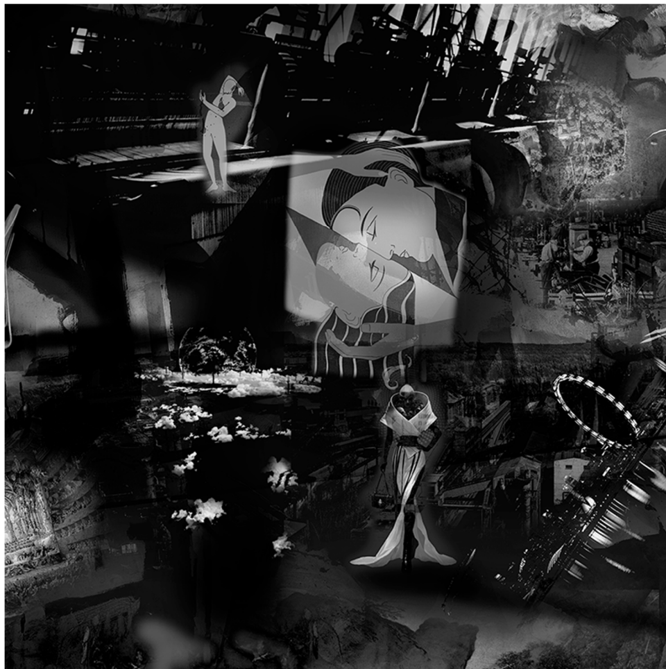
METAVERSE 1 (detalj), 2021., digitalna slika/print, 150 x 330 cm.