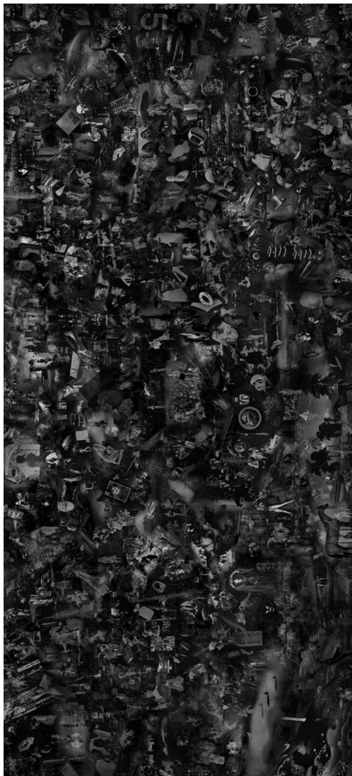
METAVERSE 3, 2021., digitalna slika/print, 150 x 330 cm.