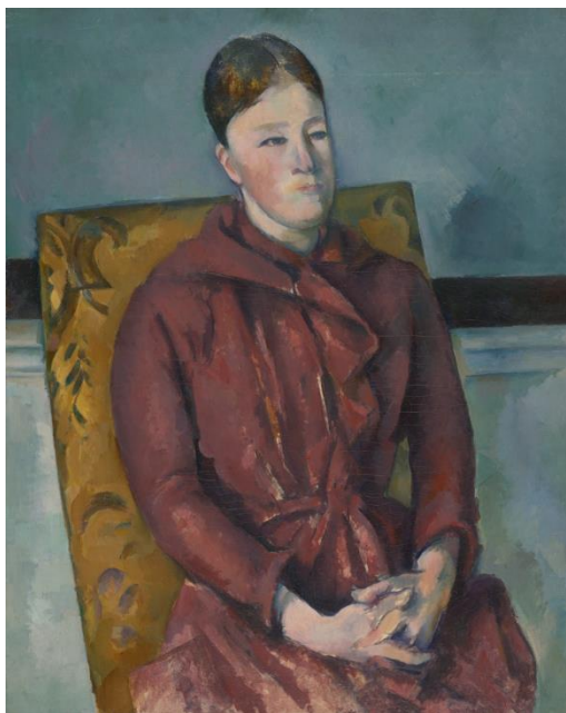
Slika 1 Madame Cézanne na žutoj stolici, 1888/90, ulje na platnu, 80.9 × 64.9 cm (The Art Institute of Chicago)

U svom djelu Fenomenologija percepcije (1945) Merleau-Ponty je ponajprije reagirao protiv prevladavajućeg vjerovanja znanosti i analitičke filozofije sredine stoljeća u to da apstraktan, objektivan pogled na svijet predstavlja potpuni, samodostatan pogled na stvarnost, kao i protiv tendencije u zapadnoj filozofiji da se takvom gledištu pridaje pretjerano značenje. Merleau-Pontyjev stav je da ovo znanstveno gledište, odmaknuto od bilo kakve individualne perspektive, nije autonomno niti potpuno jer ovisi o postojanju prethodnog (i suviše zanemarenog) ljudskog sudjelovanja u stvarnosti. On je stoga nastojao razviti deskriptivnu filozofiju percepcije u čijem je centru tijelo, podsjećajući znanost da se njeni apstraktni pojmovi oslanjaju na činove proživljenog iskustva, našu "operativnu intencionalnost", koja prethodi teoriji.