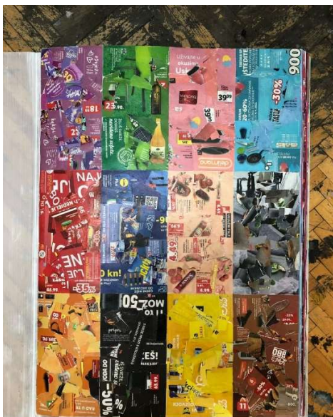
Slika 2 Katalog- "Naslovnica" 50 x 70 cm

Standardne reklame, kao i komercijalni časopisi i katalogi, koriste znanja iz područja dizajna i teorije boja. Na taj način stvaraju optimalnu viziju proizvoda koja se onda servira kupcima. Svi katalogi zato imaju zajednička pravila po kojima se oblikuju. Umjetnici je za završni rad bilo najvažnije korištenje boje, jer je boja odlučujući faktor u slaganju „slike“. Boja se u katalogima koristi kao sadržajni razdjeljivač i glavno vizualno uporište.