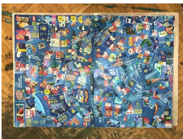
Slika 14 Dvadesetprva i dvadesetdruga stranica