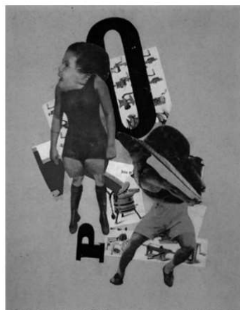
18. Hannah Höch, Bourgeois Wedding Couple - Quarrel , photomontage, 1919