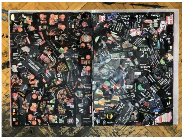
Slika 8 Deveta i deseta stranica