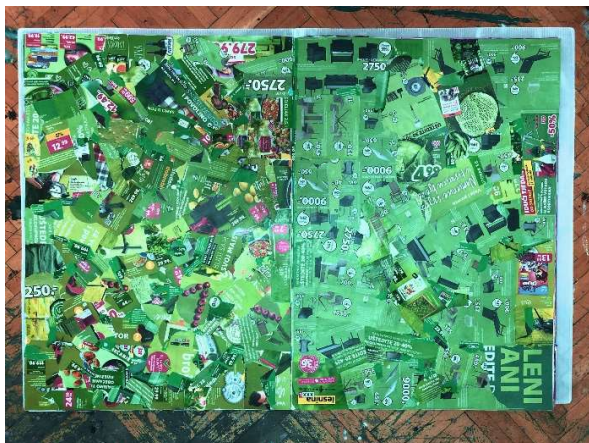
Slika 12 Sedamnaesta i osamnaesta stranica