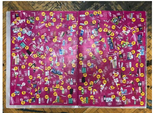
Slika 5 Treća i četvrta strana