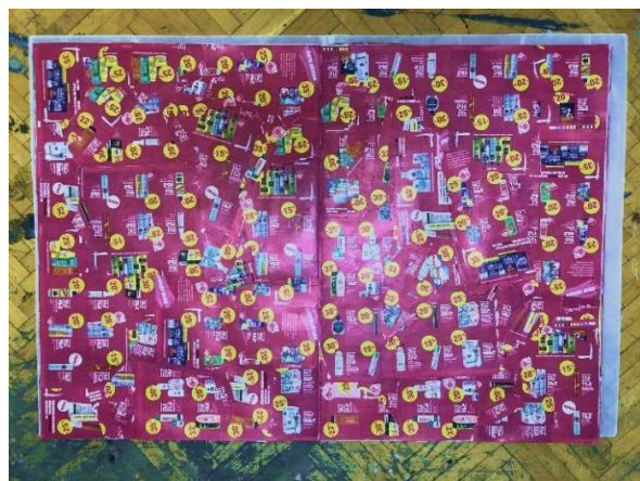
Slika 11 Petnaesta i šesnaesta stranica