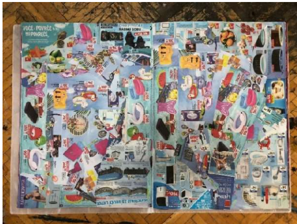
Slika 6 Peta i šesta stranica