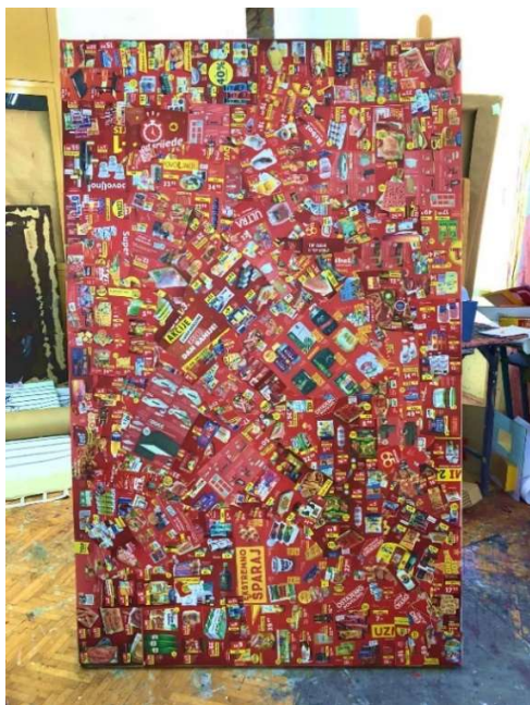
Slika 24 Trošim više 120 x 200 cm

Autorici pri ovakvim procesima sažimanja preostaje velika količina crvenog materijala. Preostali materijal crvene boje autorica koristi za zasebni rad Trošim više veličine 120 x 200 cm, a koji smatra nastavkom rada Katalog . U planu joj je uskoro realizirati i drugi pojedinačni rad zvan Kupujem manje koristeći prepoznatljivu magentu spomenute palete iz Bipa -ponude. Autorica tako upotpunjuje cilj djela.