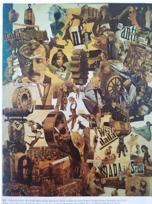
28.2. Hannah Höch: Rez kuhinjskim nožem dada kroz zadnju weimarsku epohu kulture pivskog trbuha Njemačke , oko 1919. Kolaž, 114 x 91,2 cm. Staatliche Museen, Berlin.