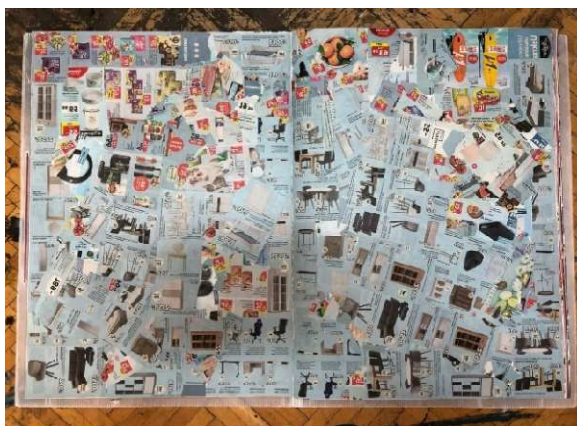
Slika 20 Tridesetreća i tridesetčetvrta stranica