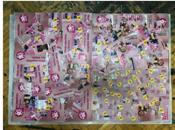
Slika 17 Dvadesetsedma i dvadesetosma stranica