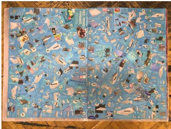
Slika 4 Prva i druga stranica