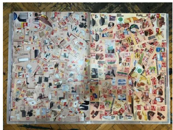
Slika 19 Tridesetprva i tridesetdruga stranica