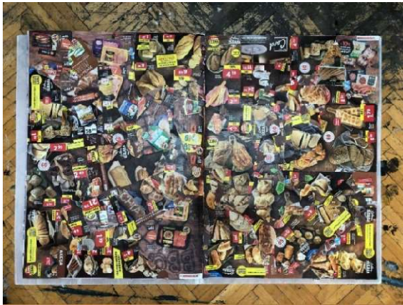
Slika 16 Dvadesetpeti i dvadesetšesta stranica