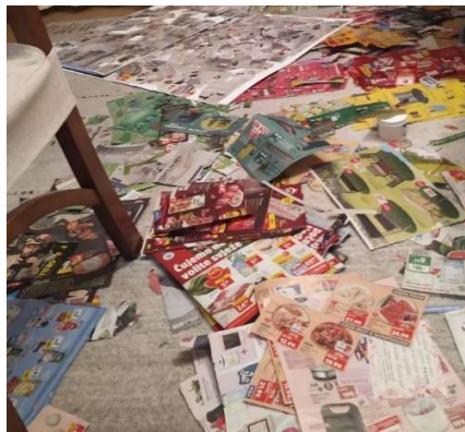
Slika 23 Proces odabira

Autorica „sažima“ više od 100 kataloga koje kategorizira po boji. Spajanjem svih odvojenih odlomaka dolazi do pojavljivanja određenih ponavljanja. Primjerice, učestalo je korištenje crvene boje kod prikaza prehrambenih proizvoda; plave uz proizvode vezane za more ili magente koja se ekskluzivno pojavljuje u katalogima trgovačkog lanca Bipa kao način brendiranja tvrtke.