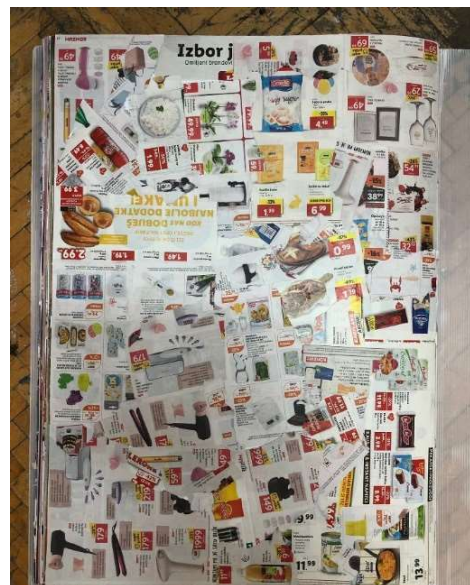
Slika 3 Katalog- Zadnja stranica 50 x 70 cm