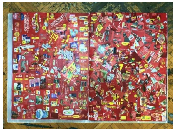
Slika 7 sedma i osma stranica