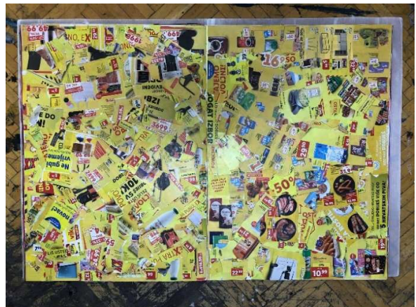
Slika 9 Jedanaesta i dvanaesta stranica