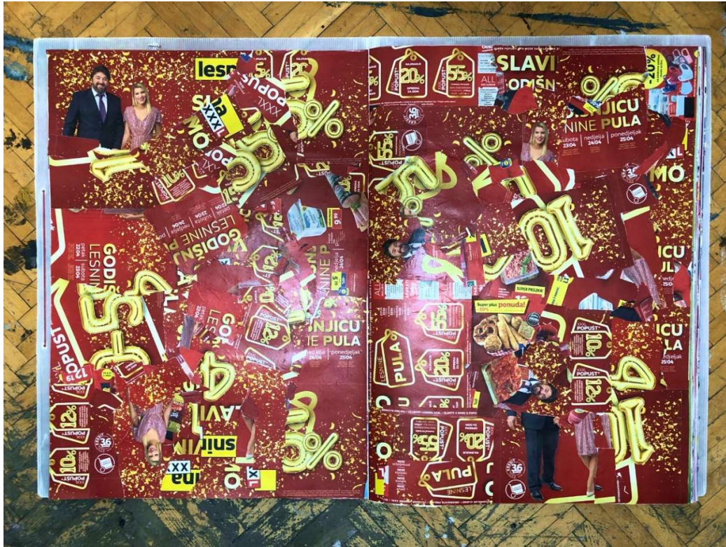
Slika 22 Tridesetsedma i tridesetosma stranica

Odabirući i slažući motive prema različitim bojama autorica pronalazi različite uzorke koji se i vizualno i sadržajno razdvajaju jedni od drugih stvarajući tako nove „slike“ ili stranice, novi katalog.