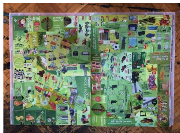
Slika 21 Tridesetpeti i trideset šesta stranica