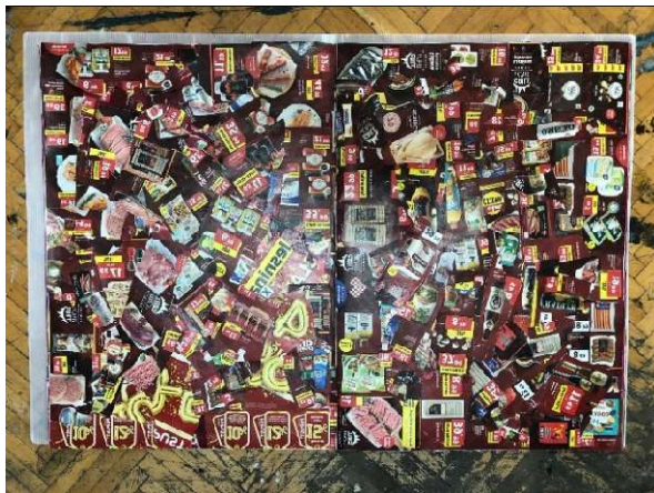
Slika 10 Trinaesta i četrnaesta stranica