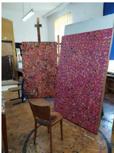
Slika 26 Radovi u prostoru