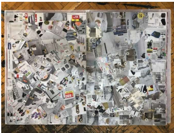
Slika 18 Dvadesetdeveta i trideseta stranica