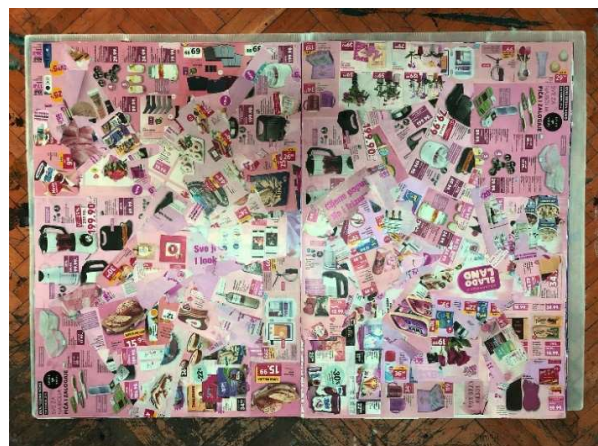
Slika 15 Dvadesetteća i dvadesetčetvrta stranica