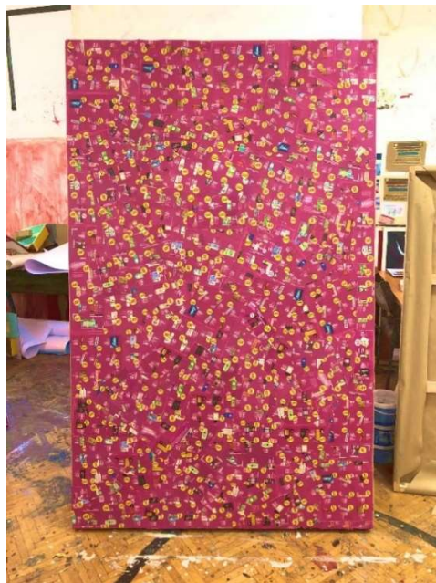
Slika 25 Kupujem manje 120 x 200 cm