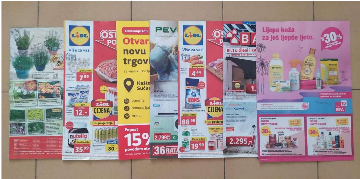
Slika 1 Primjer odabranih kataloga

autoricu je bio bitan upravo oblik papirnatom „časopisa“ radi velike dostupnosti materijala za rad, jer veliki broj kataloga izlazi bar jedanput tjedno.