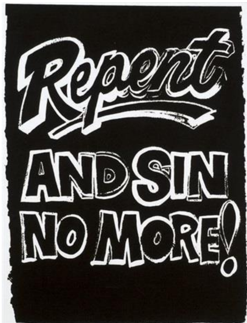
Slika 6. Andy Warhol, Repent and sin no more, akrilik i sitotisak na platnu, 1985-1986 2kom 2034 × 1781 × 33 mm, ARTIST ROOMS Tate and National Galleries of Scotland, http://www.artnet.com/artists/andy-warhol/repent-and-sin-no-more-wNwHZT_1hUWeFaA94KVtRQ2 (Pristupljeno 9.9.2022)