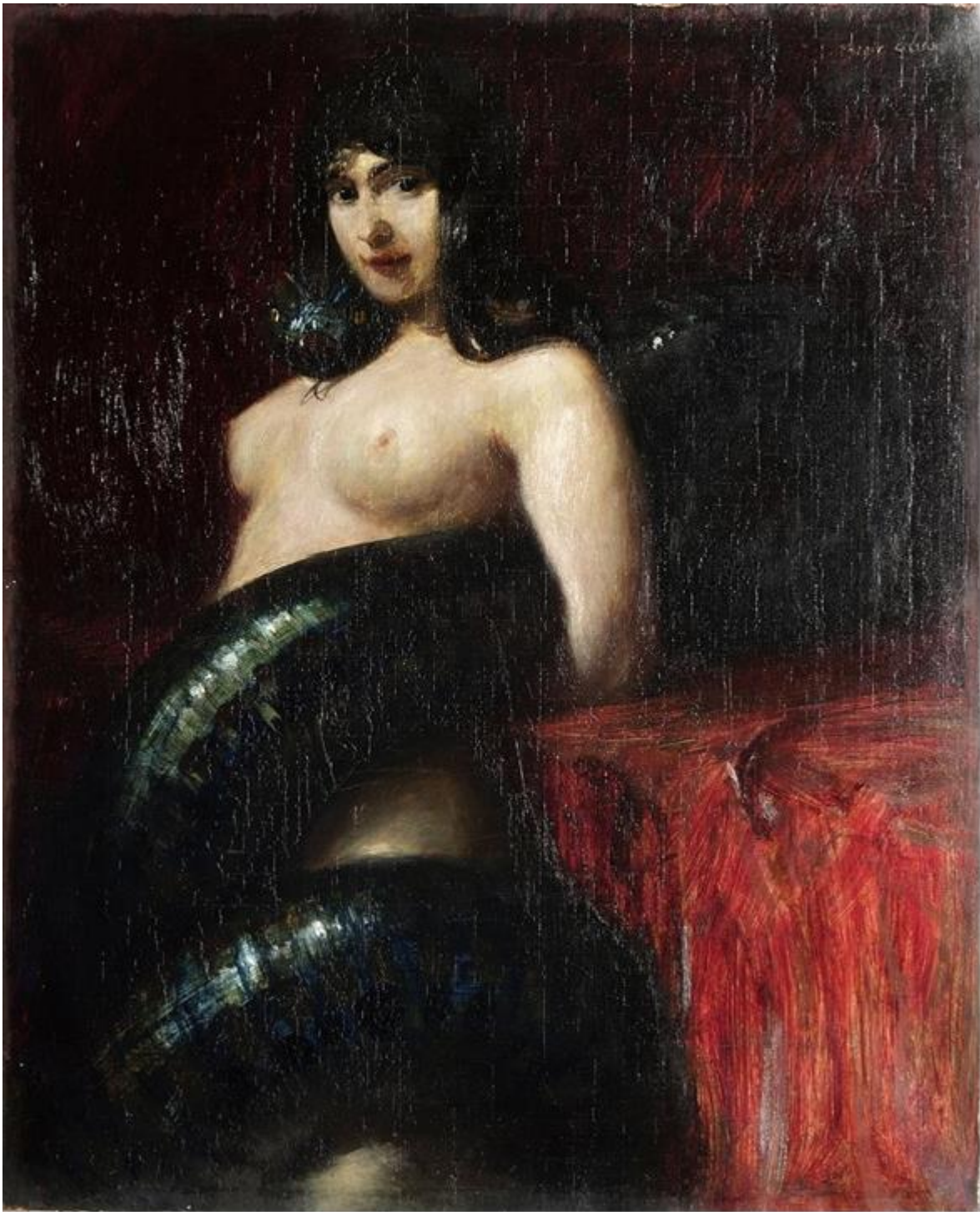
Slika 5. Franz Vvon Stuck, Grieh, ulje na platnu, 1893, 94.5 cm × 59.6 cm, Neue Pinakothek, Munich, https://victorianweb.org/decadence/painting/vonstuck/paintings/eschrich14.html (pristupljeno: 9.9.2022)