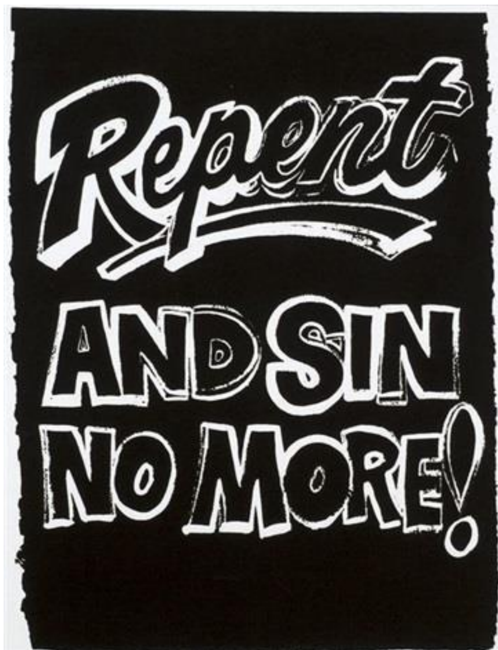
Slika 6. Andy Warhol, Repent and sin no more, akrilik i sitotisk na platnu, 1985-1986 2kom 2034 × 1781 × 33 mm, ARTIST ROOMS Tate and National Galleries of Scotland, http://www.artnet.com/artists/andy-warhol/repent-and-sin-no-more-wNwHZT_1hUWeFaA94KVtRQ2 (Pristupljeno 9.9.2022)