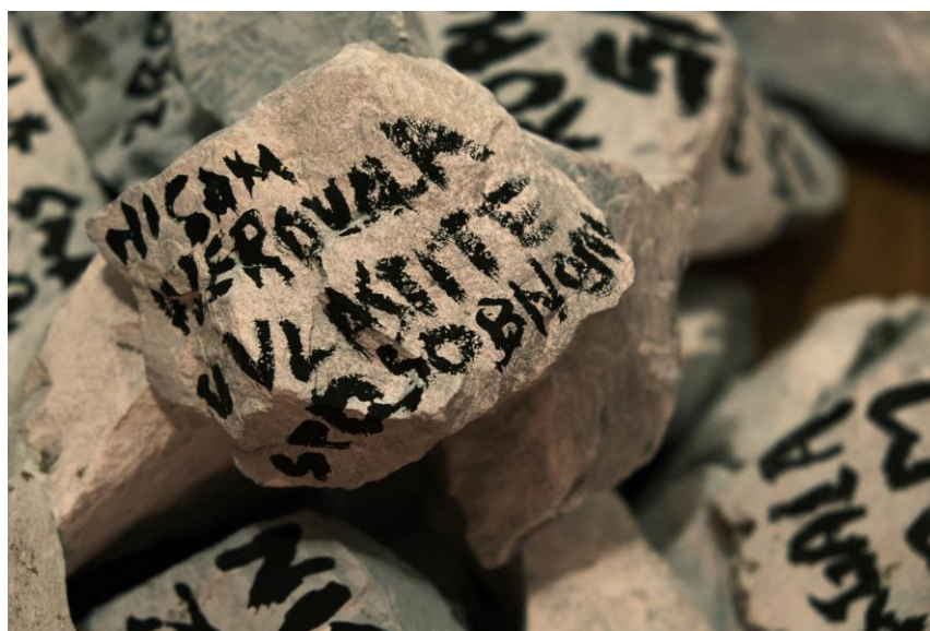
Slika 2. Jelena Tucak, Ispovijed, akrilik i kamen, 2022. 85kom, cca Ø15cm, , Ninska 20, Split, Hrvatska