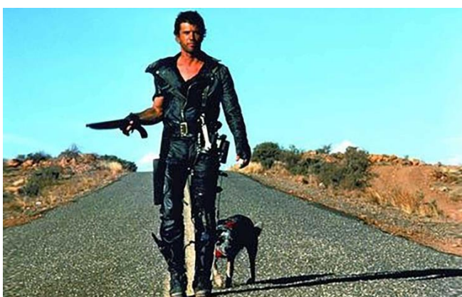
Slika 9 Slika 10

Lik odbacuje autore kao stvoritelje s punim pravom. Autor je jedva ovladao njemu već priređenim elementima, sredstvima, Peterličevim čimbenicima razlike i sličnosti. U jednu ruku više od samo fizičkih, u drugu ruku više od samo duhovnih faktora, omogućuju egzistenciju fiktivnih likova. Obraćajući se svojem stvoritelju, oni ne bi trebali imati kako razložiti svoju egzistenciju. Na taj bi nam način bili sličniji. Osim što im je omogućena posredstvom čovjeka, ona ima zamršenu, čak i autorima stranu logiku; čak da slični i na koju drugu - koliko još oblika egzistencije razumijemo? Čemu će svakako najviše nalikovati, ako ne čovjeku?