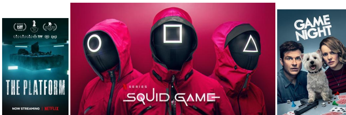
Slika 6 Slika 7 Slika 8

Saznat ćemo za zadovoljstvo u nespitanosti. Pokazat će nam probitačni performansi. Obratit će nam se kroz poznate strukture na nepovratan način, između ostalog, o mogućnostima koje smo naslućivali da u nekoj varijanti postoje kao “ono nešto” što čini remek djelo. To će biti trenutci u kojima likovi iskaču iz platna, čime god se poslužili, u “zonu” (Stalker) u kojoj će nam se približiti kao svojoj svrsi, izvoru svoje težnje iza tobožnje granice, svojem stvoritelju. Ali često, na granicama svojeg svijeta, taj lik odbacuje autore filma kao svoje stvoritelje.