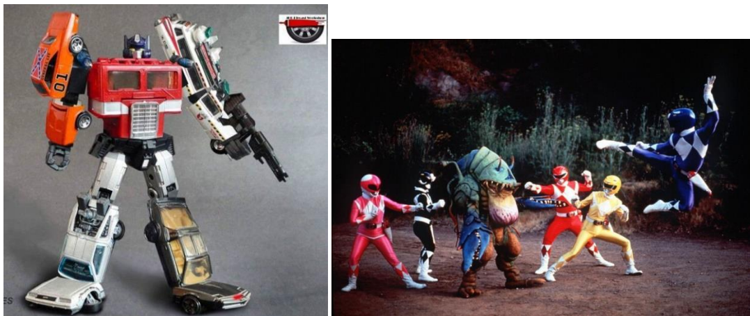
Slika 4 Slika 5

Biramo što je korisno i punimo ideju o “svrsi” svim različitim značenjima. Razum će nas prevesti u ozdravljenje. Razum kao ured za intervenciju duha, posredovanje između materije i snoviđenja. Otvara se ujutro, papiri su poslani na potpisivanje, stižu odozgor - čekamo glas razuma. Razumski reagiramo na film, ali to je, tek i ako, primaći šalter, otegotna okolnost odrastanja u već izgrađenom svijetu. Istovremeno reagiramo kao tabula rasa, potpuno poremećeni ulaskom filma u našu svijest.