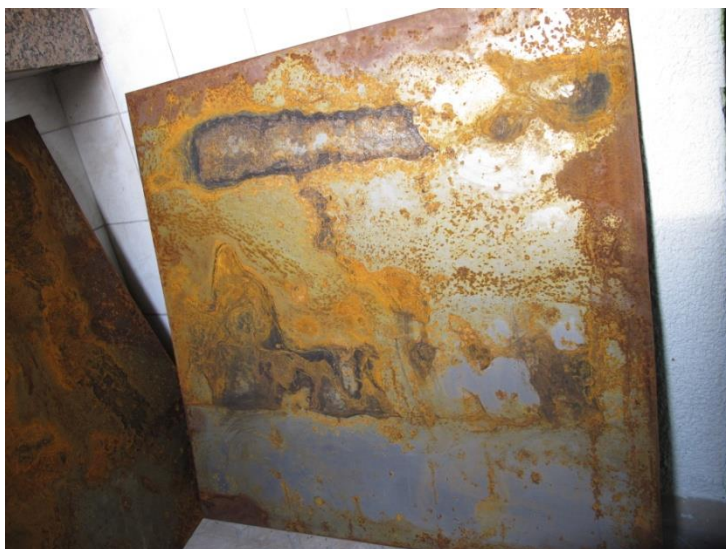
Slika 2. Nastanak hrđe pod utjecajem klimatskih uvjeta

Inspirirana teksturom i oblicima koje sam uočila na pločama, odlučila sam ponovno intervenirati i kreirati dimenziju nekog novog svijeta koji se sastoji od mnoštva neobičnih oblika. Na određenim dijelovima dviju ploča, kojima je to po mojoj procjeni bilo potrebno, ponovno sam koristila hidrogen, sol i vodu kako bih dodatno pospješila nastanak hrđe. Potaknuta spontanom prepoznavanjem organskih formi, naposljetku sam koristila i uljane boje istih i/ili sličnih tonova poput same hrđe, što je rezultiralo isticanjem već postojećih oblika, figura i lica (Slika 3.). Razlog korištenja istih i/ili sličnih tonova karakterističnih za hrđu, leži u namjeri da se istaknu same forme te da se naglasi ljepota zahrđale površine. Osim toga, željela sam ostvariti kontrast između tamnih i svjetlih komponenata cjelokupne kompozicije, kako bih postigla dojam dinamičke ravnoteže te na taj način kreirala vizualnu impresiju zaustavljenog trenutka u dimenziji vremena.