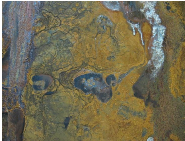
Slika 4. Detalj istaknutog lica

Osim same fascinacije i impresije vizualnim identitom hrđe, rad je također inspiriran željom da zabilježim i donekle zaustavim jedan trenutak u beskonačnoj dimenziji vremena koja nas često podsjeća na činjenicu kako je sve prolazno te da svi podliježemo zubu vremena pa čak i materija poput željeza koja se odlikuje čvrstoćom i izdržljivošću. Entropija 1 , odnosno kaos, prouzrokovan igrom sunca, kiše i vjetra, zaustavljen je u onom trenutku kada se pojavio sloj hrđe na sjajnim metalnim površinama dviju željeznih ploča. Posljedica zaustavljanja tog procesa je nastanak mnoštva zanimljivih formi i tekstura u obliku hrđe koji tvore potpuno novu percepciju materije željeza. Forme i oblici koji su se pojavili u procesu ovog rada, potaknuli su me na spontano prepoznavanje figura i lica različitih facijalnih ekspresija. Fenomen pareidolije 2 je neizbježan, stoga sam odlučila popratiti slike čudesnog svijeta koje je moj um prepoznao (Slika 4.).